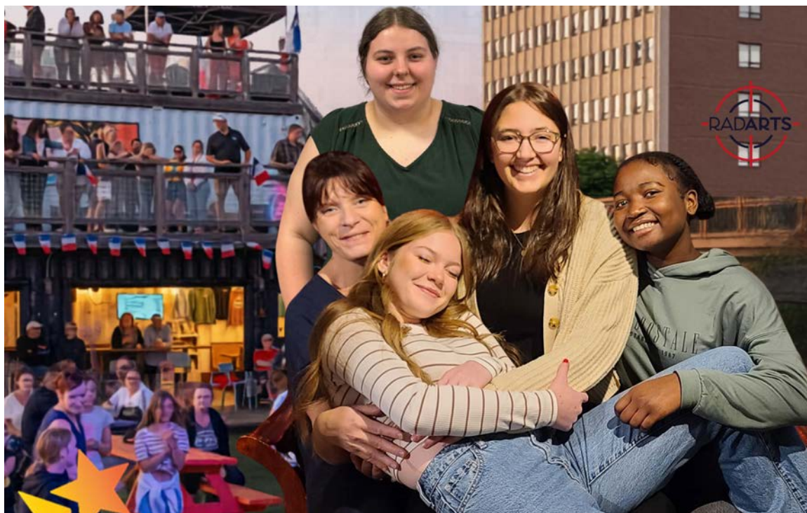
La belle équipe de Flash Culture.

Les jeunes sont invités à participer à la FrancoFête en Acadie, à Dieppe, accompagnés de leur diffuseur, pour découvrir le milieu des arts de la scène de l'intérieur. Nous assistons à des dizaines de vitrines, participons à des ateliers, rencontrons des artistes et des professionnels. De retour