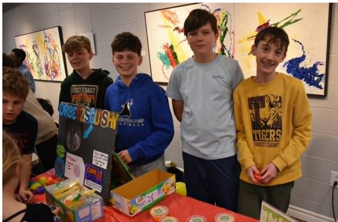
Des élèves avec leurs différents produits lors du marché.