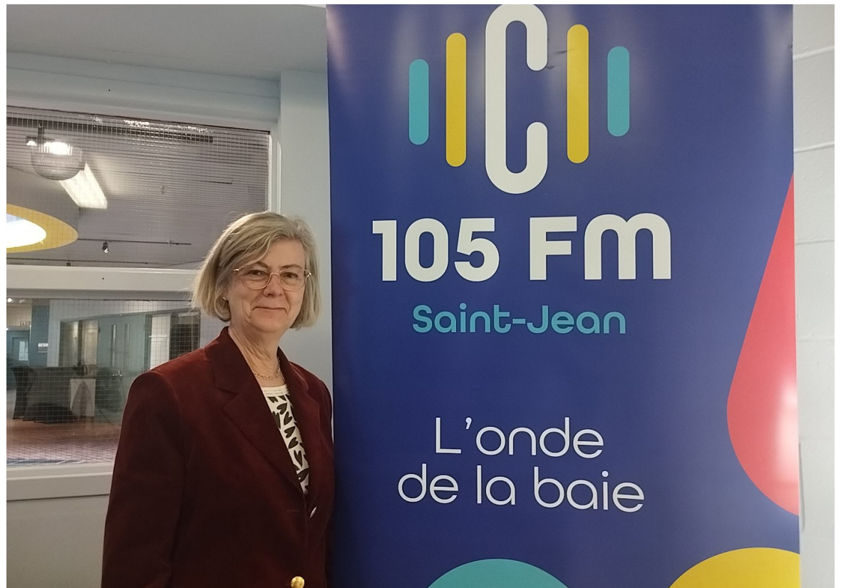
La mairesse de Saint-Jean, lors de son passage dans les studios du C105 FM.

dollars par année pendant presque 15 ans. Le dernier paiement sera effectué en mars 2028. Nous avons donc dû ajuster le budget. Aujourd'hui, finalement, nous sommes rendus à un point où nous avons un peu d'argent en banque et où plusieurs des grands enjeux ont été réglés ou sont en voie de l'être, et j'ai envie de participer à cette prochaine étape pour la ville ».