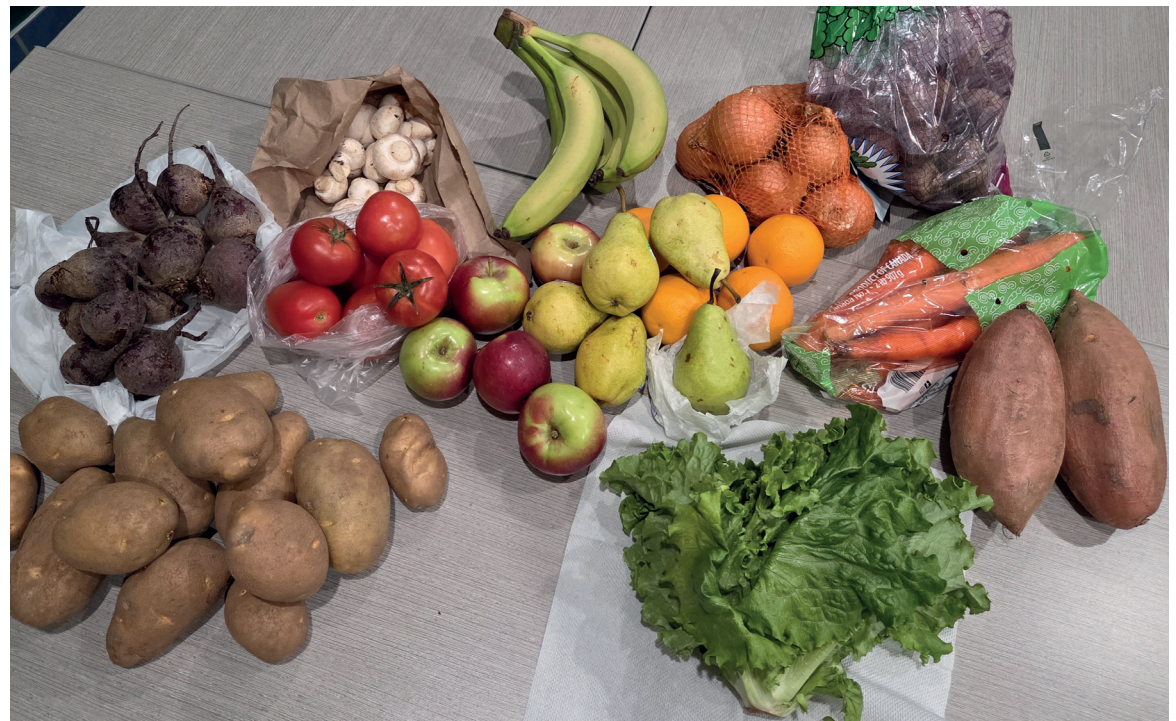
Ce que contenait la commande du mois de janvier 2026.

N'hésitez pas de prendre contact avec Linda Longon pour plus d'information au: linda.longon@arcf.ca ou au 506 658-4600 poste 2004.