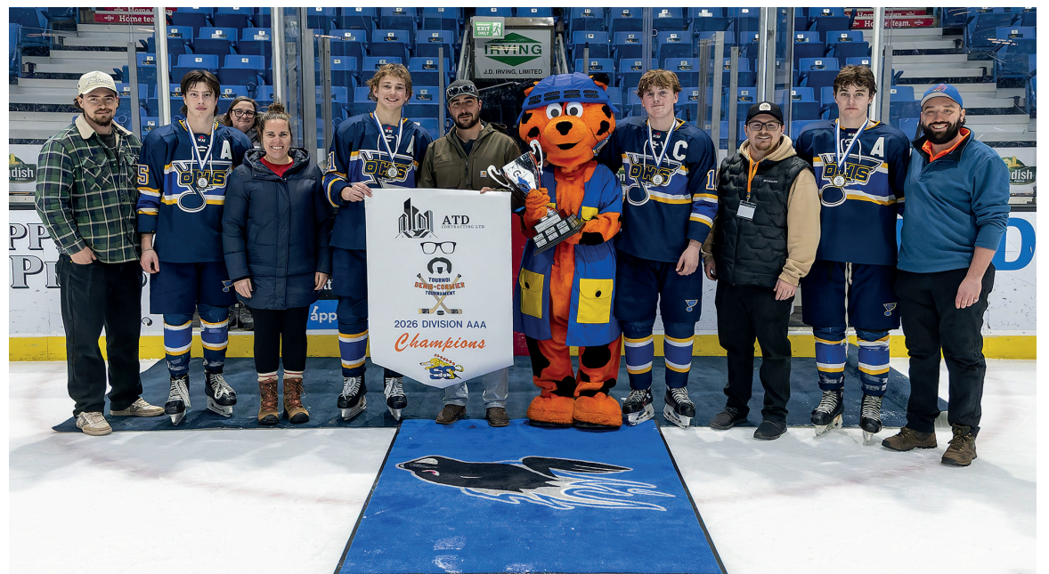
Les Blues d'Oromocto, gagnants de la catégorie AAA.