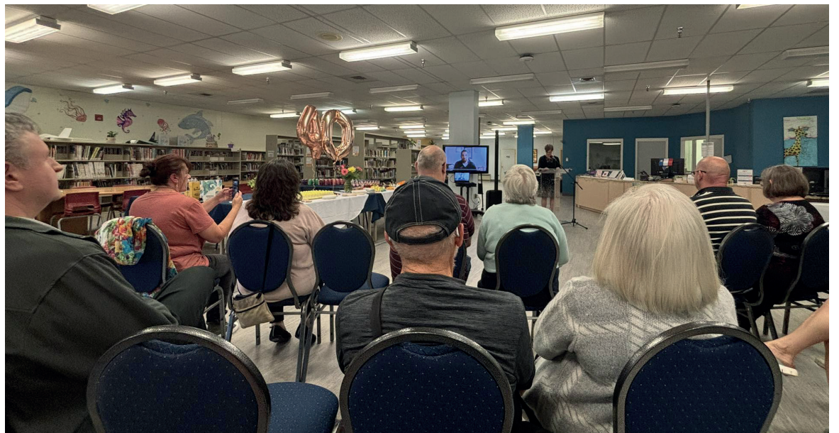
La bibliothèque Le Cormoran a fêté ses 40 ans en 2025.

communautaire Samuel-de-Champlain pour confirmer ou changer votre NIP.