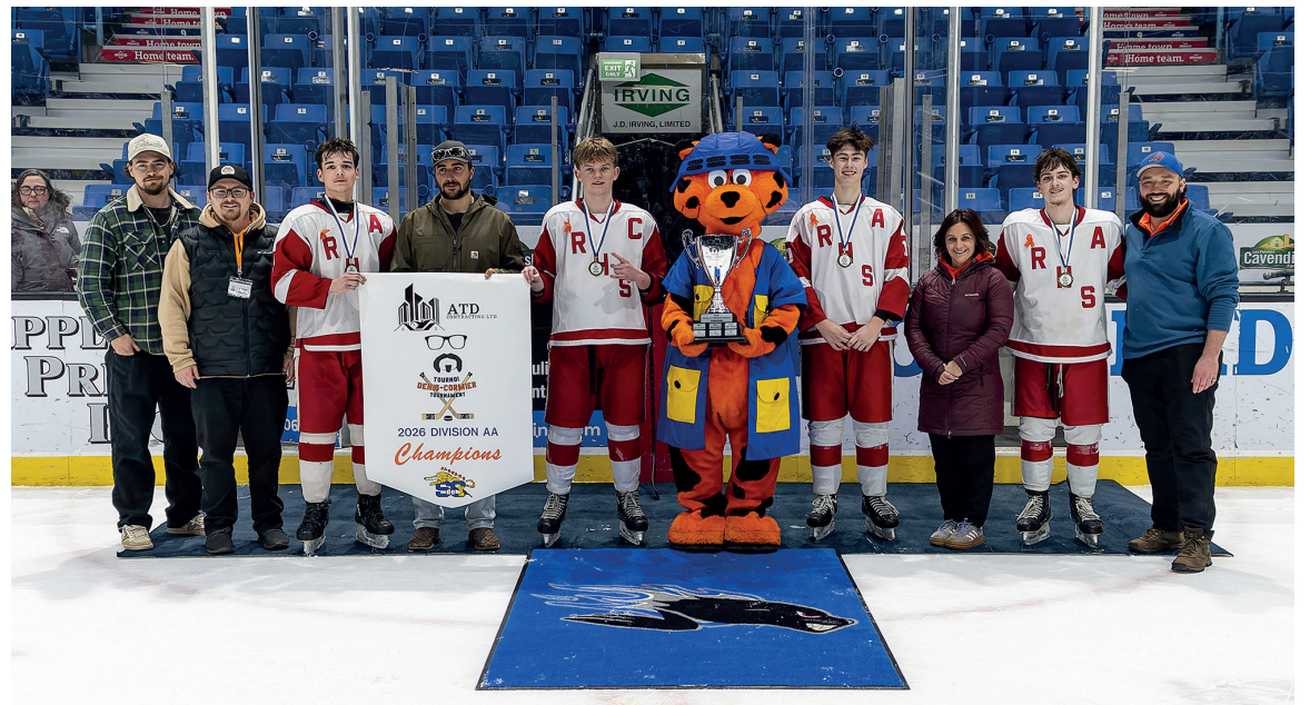
Les Redhawks de Rothesay, gagnants de la catégorie AA.