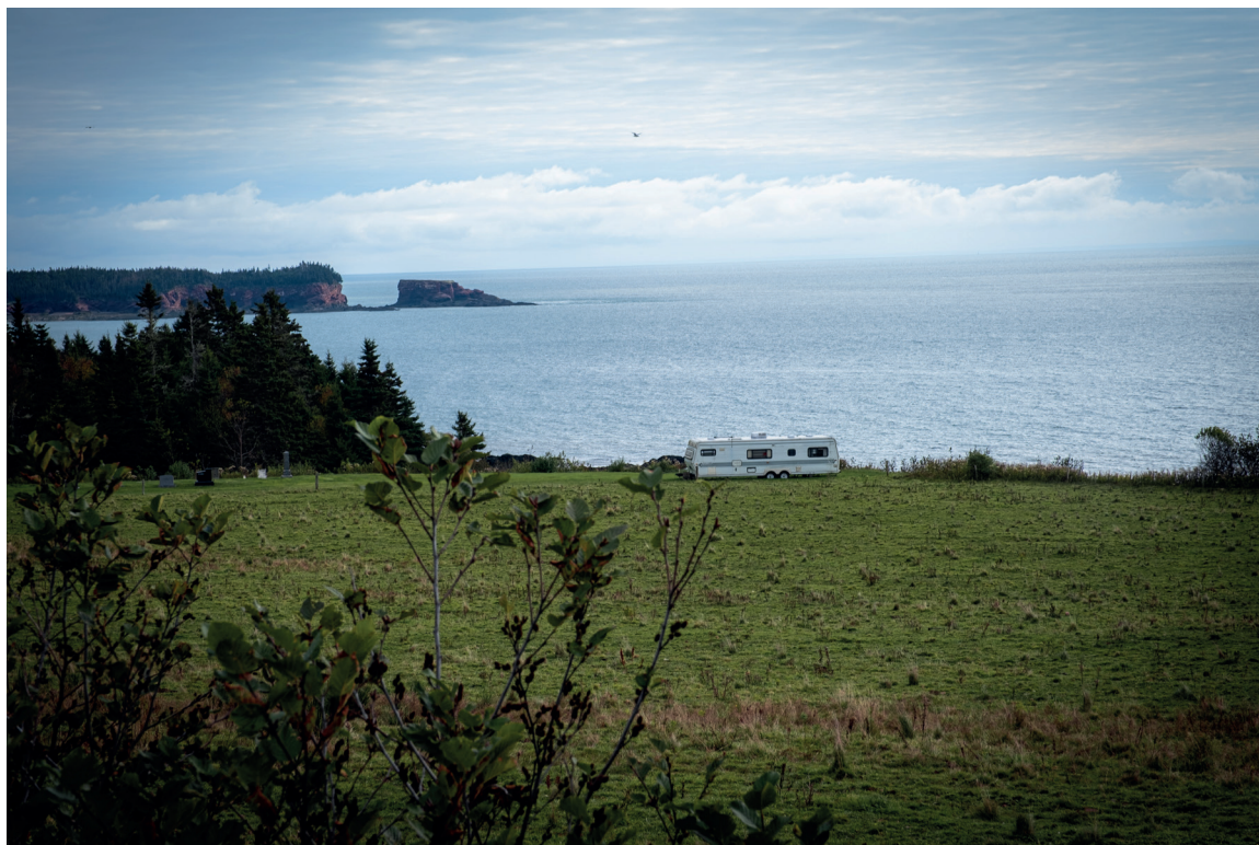
Vue de la baie de Fundy en chemin vers Saint-Martins.