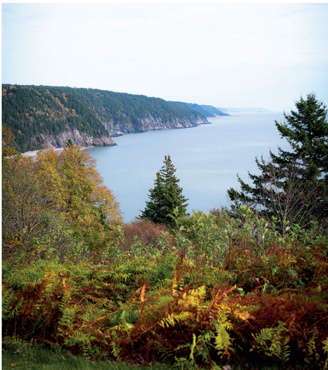
Vue de la baie en randonnée à Fundy Trail.