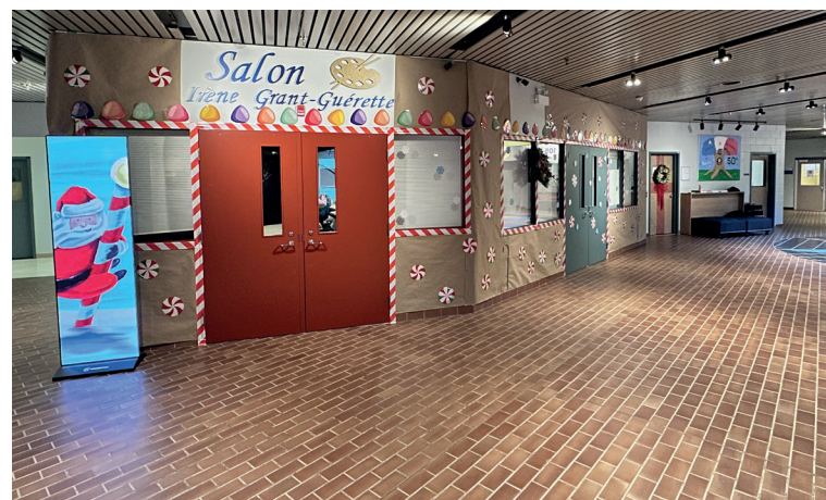
Le Salon IGG décoré.