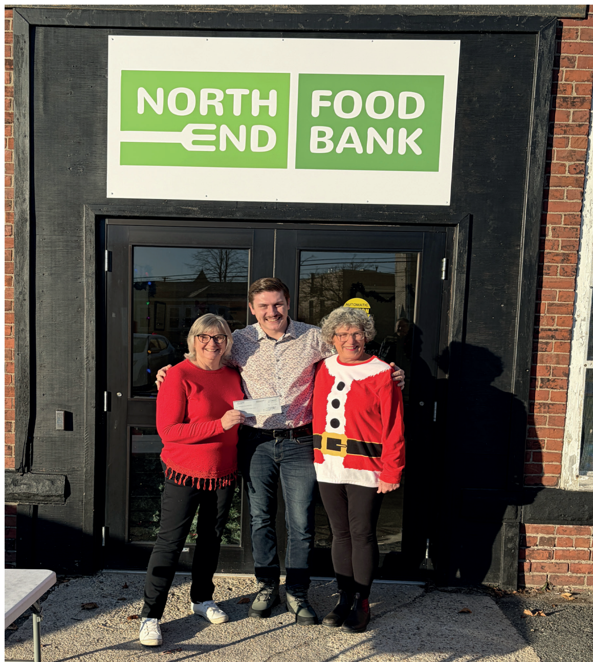
Remise du chèque à la banque alimentaire.