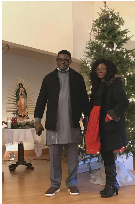
Père Pierre du Bénin avec une paroissienne. Il est en stage ici avant de rejoindre sa paroisse à Miramichi.