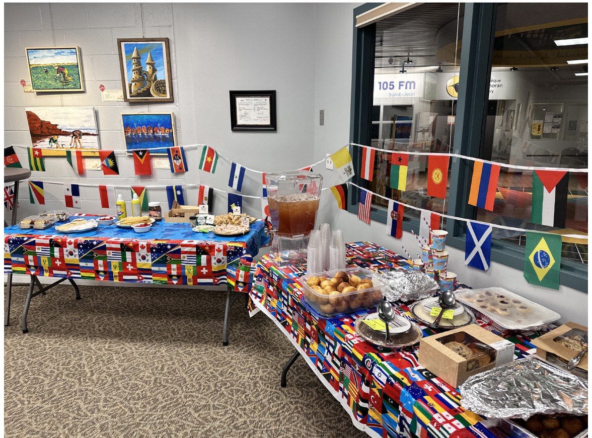
succès retentissant.