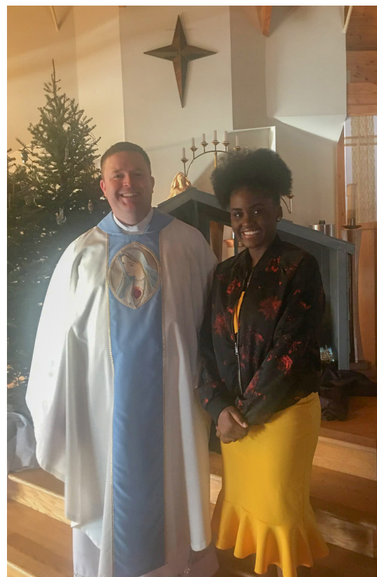
Père Knox et Yema.

nourriture traditionnelle, c'est le côté inoubliable de la fête de Noël et le temps de passer les traditions aux plus jeunes.