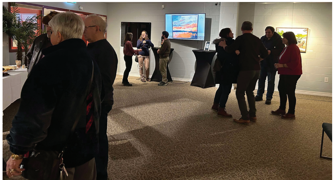
De nombreuses personnes sont venues au vernissage de l'exposition.

Apprenez-en plus sur le CYC en visitant leur site web: https://cycinc.ca/