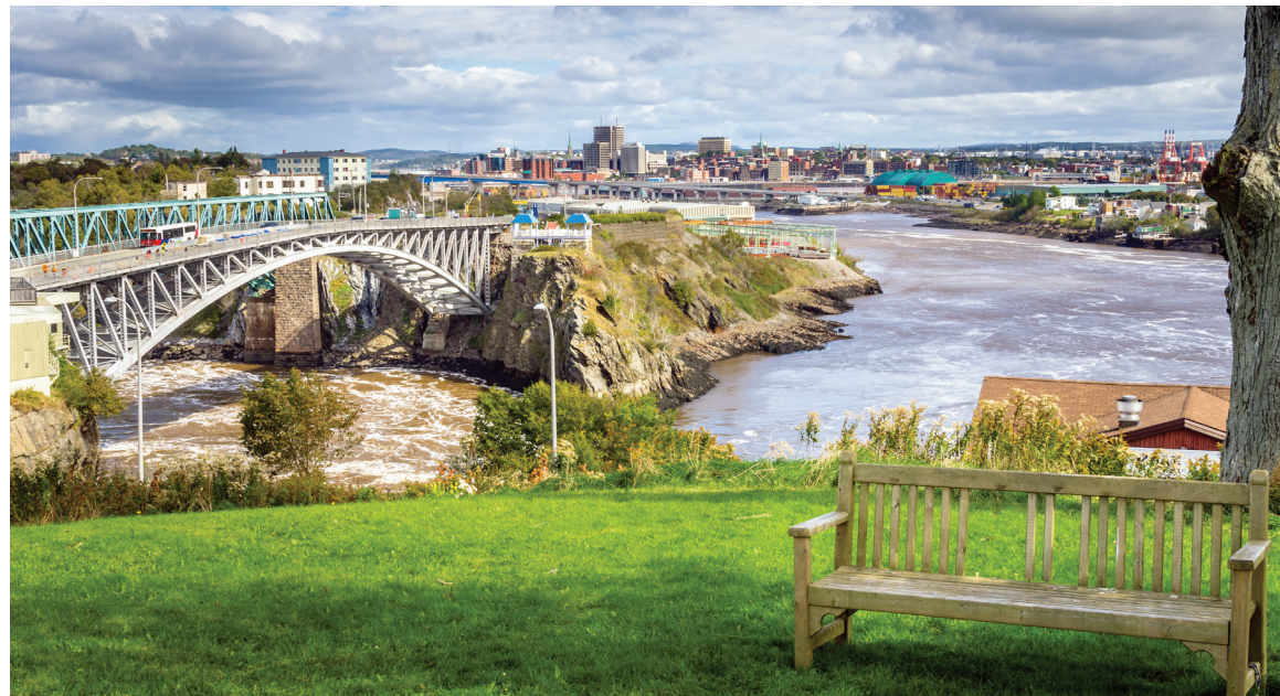
Ville de Saint-Jean.

La lecture du document Stratégie d'immigration 2022-2032 de Saint-Jean permet de constater que les élus soutiennent «l'engagement permanent d'accroître la population et de reconnaître que l'immigration sera un moteur essentiel de cette croissance». On estime que la région devra faire croître sa population de 32 000 individus d'ici 2040 pour atteindre sa pleine croissance économique.