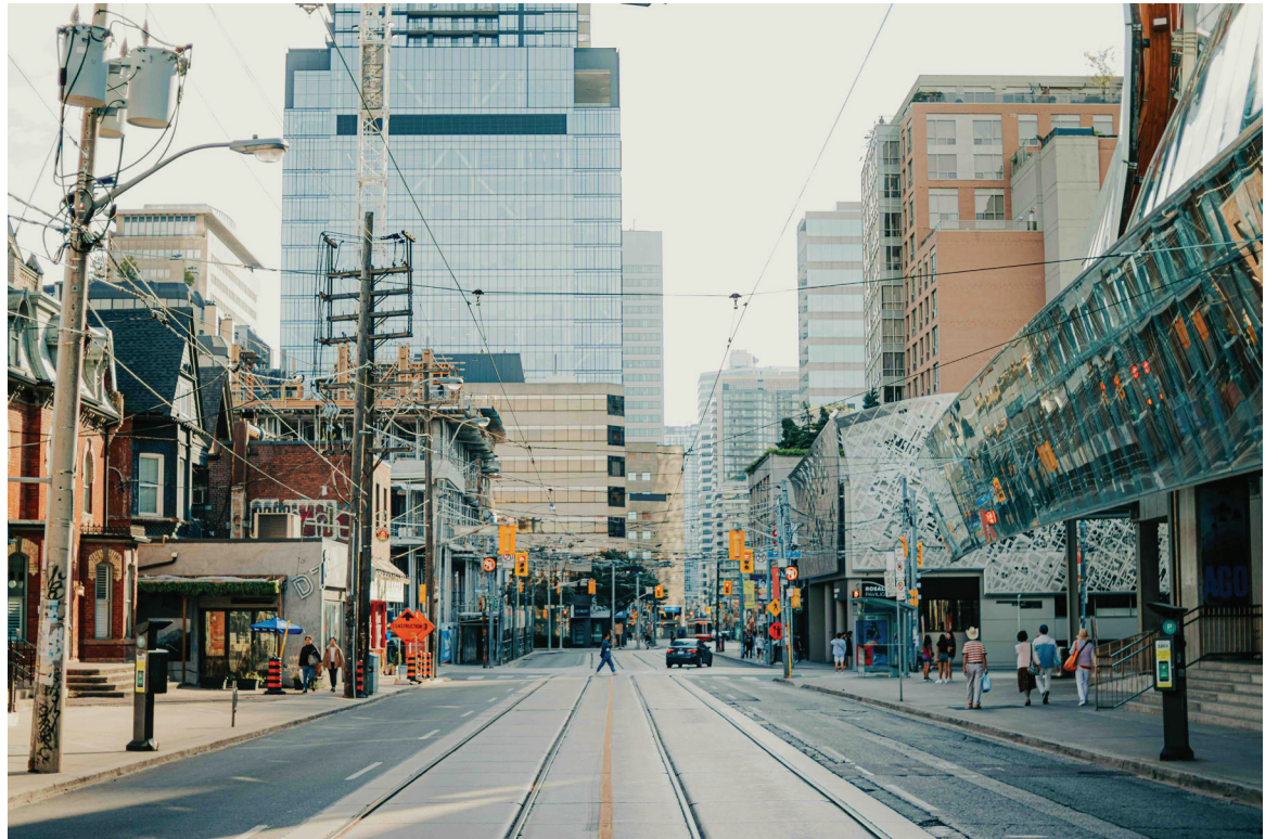
Les acteurs et représentants du milieu exigent des données économiques sur les francophones en situation minoritaire pour mieux outiller les communautés et justifier les demandes de financements gouvernementaux.

Les établissements postsecondaires francophones doivent parfois présenter de