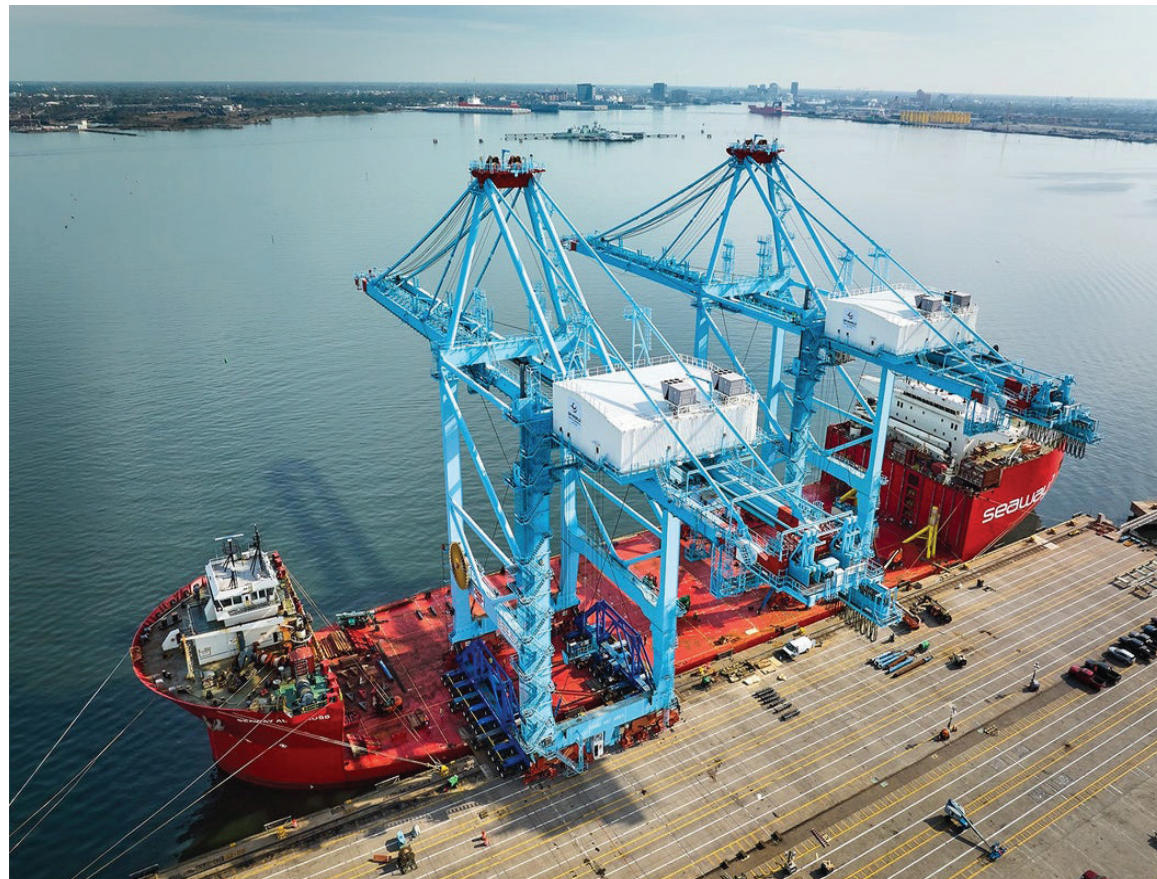
L'arrivée par bateau des deux nouvelles grues.

Avec une hauteur de portée augmentée de 15%, les nouveaux mastodontes sont évidemment les plus grandes grues de quai à ce jour à Saint-Jean. En raison de leur capacité à entretenir et servir des navires transportant plus de 10 000 TEU (le sigle TEU, signifiant Twenty-foot Equivalent Unit en anglais ou EVP en français pour Équivalent Vingt Pieds, sert à désigner le volume d'un conteneur), les