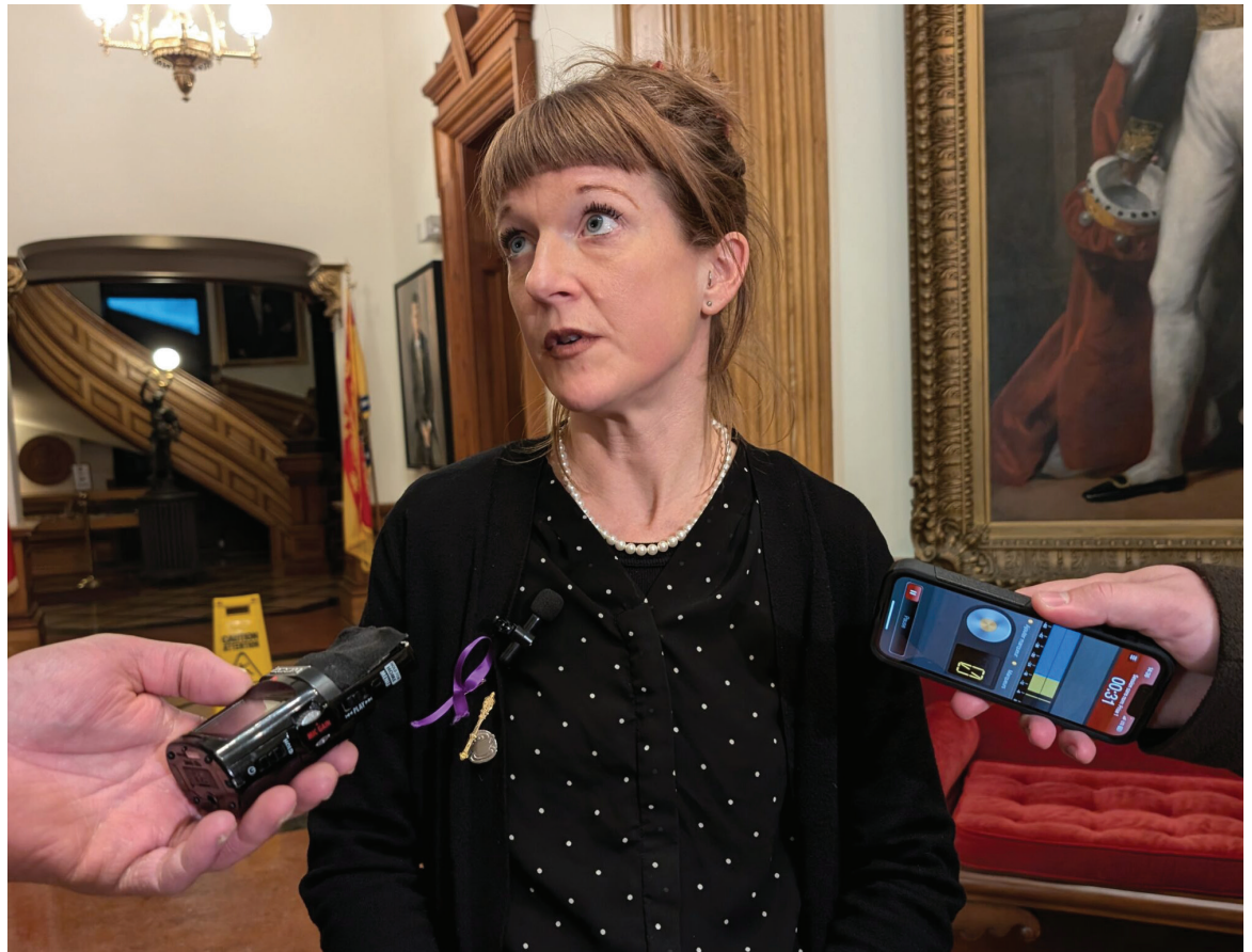
Claire Johnson, ministre de l'Éducation et du Développement de la petite enfance, dans la rotonde de l'Assemblée législative, à Fredericton.

Ces deux écoles font d'ailleurs partie d'une demande du CED du District scolaire francophone Sud qui figure dans sa poursuite entamée contre le gouvernement du Nouveau-Brunswick en raison d'un sous-financement de projets d'infrastructure scolaire francophone.