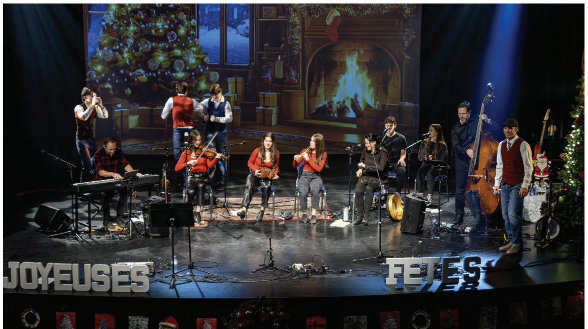
Le spectacle de Noël a mis en vedette La Famille LeBlanc et Moyenne Rig.