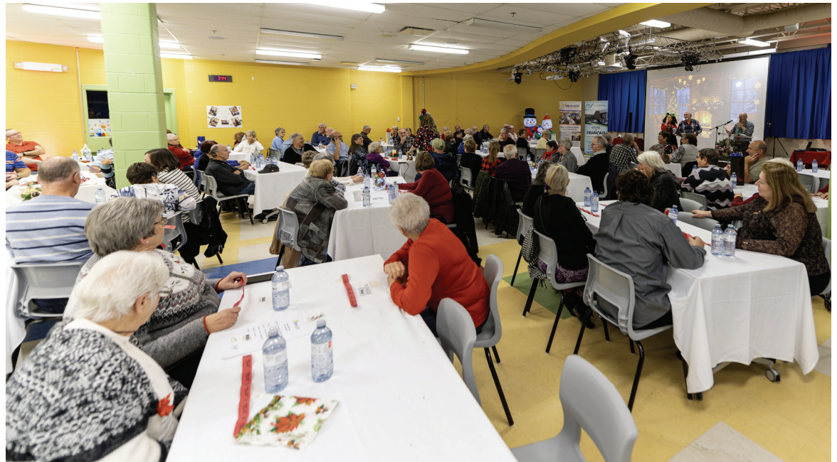
Le souper de Noël.