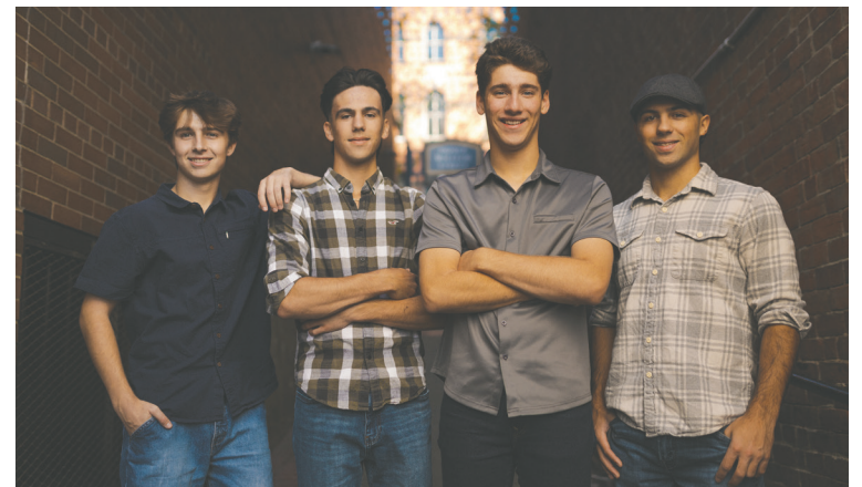
Moyenne Rig.