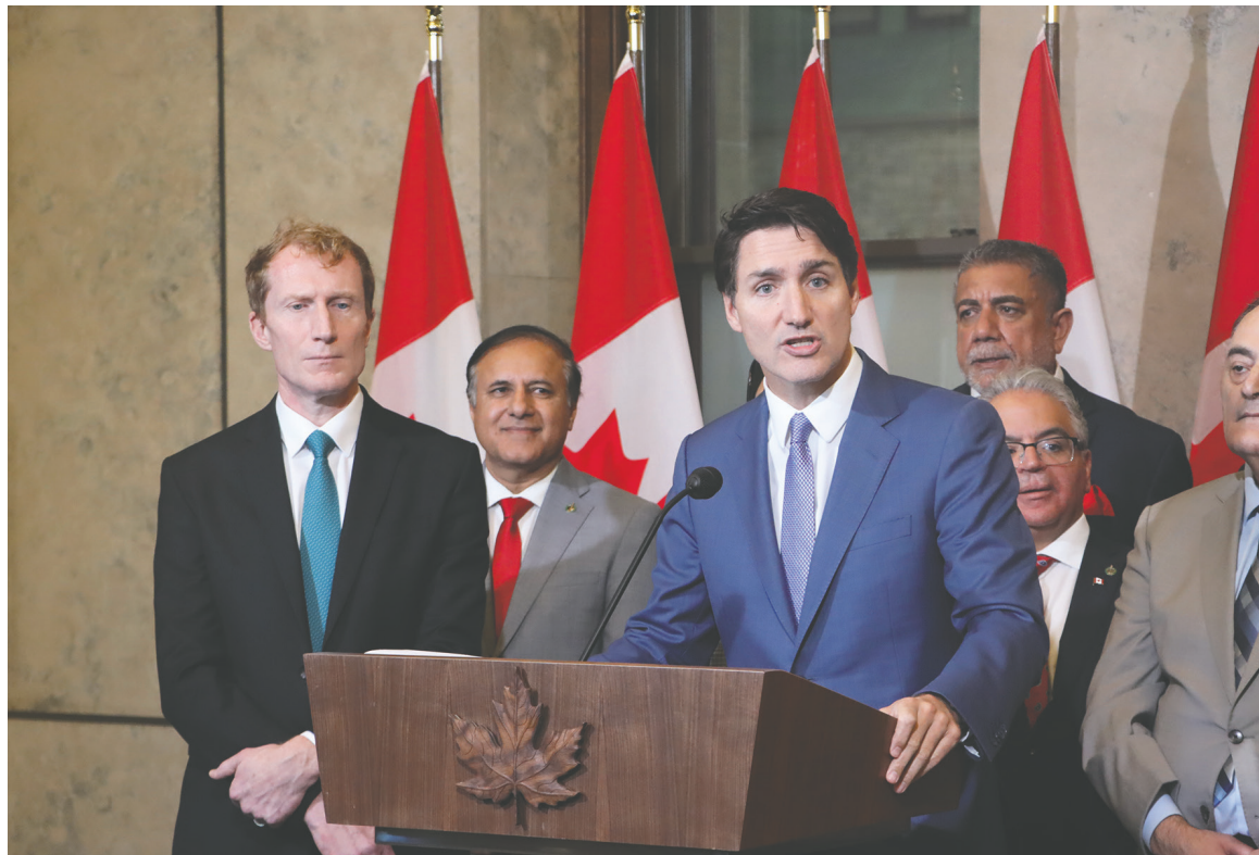
Le premier ministre Justin Trudeau et le ministre de l'Immigration, Marc Miller, ont annoncé une baisse considérable du nombre de résidents permanents dès 2025.

De son côté, le porte-parole du Bloc québécois en matière d'immigration