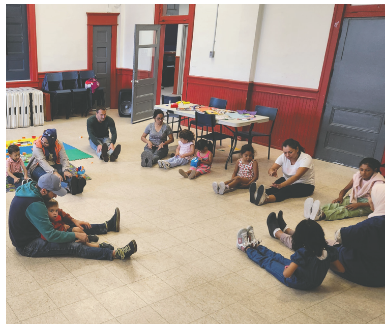
Groupe de jeu au Carleton Community Centre.

L'augmentation des places dans les CPE représente un enjeu majeur pour la vitalité de la communauté francophone de Saint-Jean et de ses environs, en assurant que les jeunes enfants grandissent dans