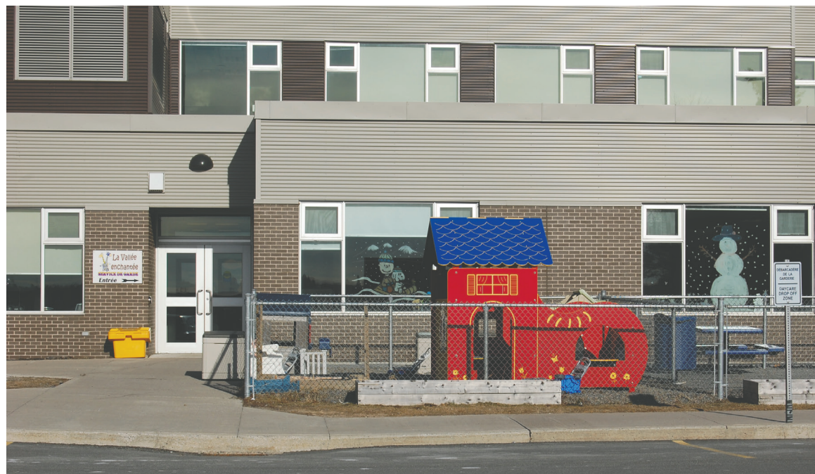
CPE La Vallée enchantée.

Cette initiative s'inscrit dans un plan stratégique plus large de l'ARCf, qui a défini quatre grandes actions pour cette année. Outre la création de nouvelles places en garderie, l'ARCf a mis en place quatre groupes