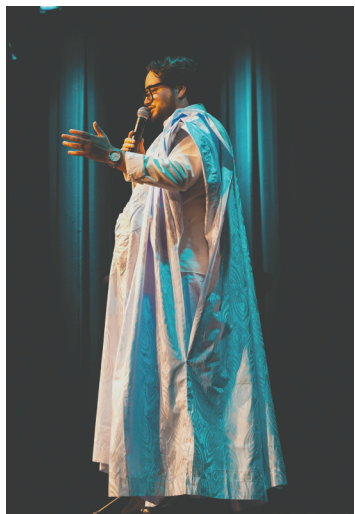
P'tit Bouya en Acadie. Crédit: Gracieuseté.

Le 15 novembre, l'ARCf propose un voyage linguistique et culturel unique avec Les langues se délient . Lors de cet événement, membres de la communauté et