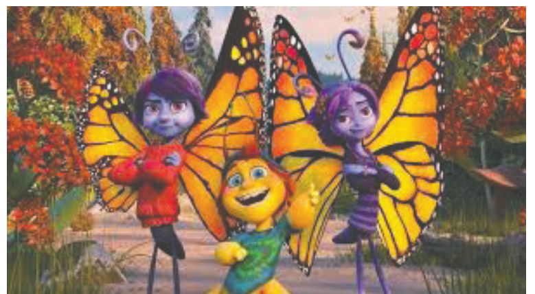
La légende du papillon.