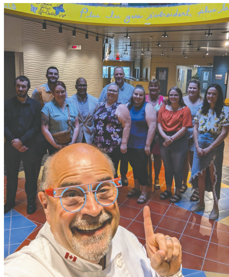
Le Kilted Chef en compagnie des participants.

Le Kilted Chef a également évoqué son lien particulier avec Saint-Jean. Il raconte qu'il a commencé sa carrière dans la région dans les années 80. Il a travaillé en stage avec le chef Yves Blodow au Hilton à l'époque où l'hôtel n'était même pas encore ouvert et c'était seulement le centre de conventions.