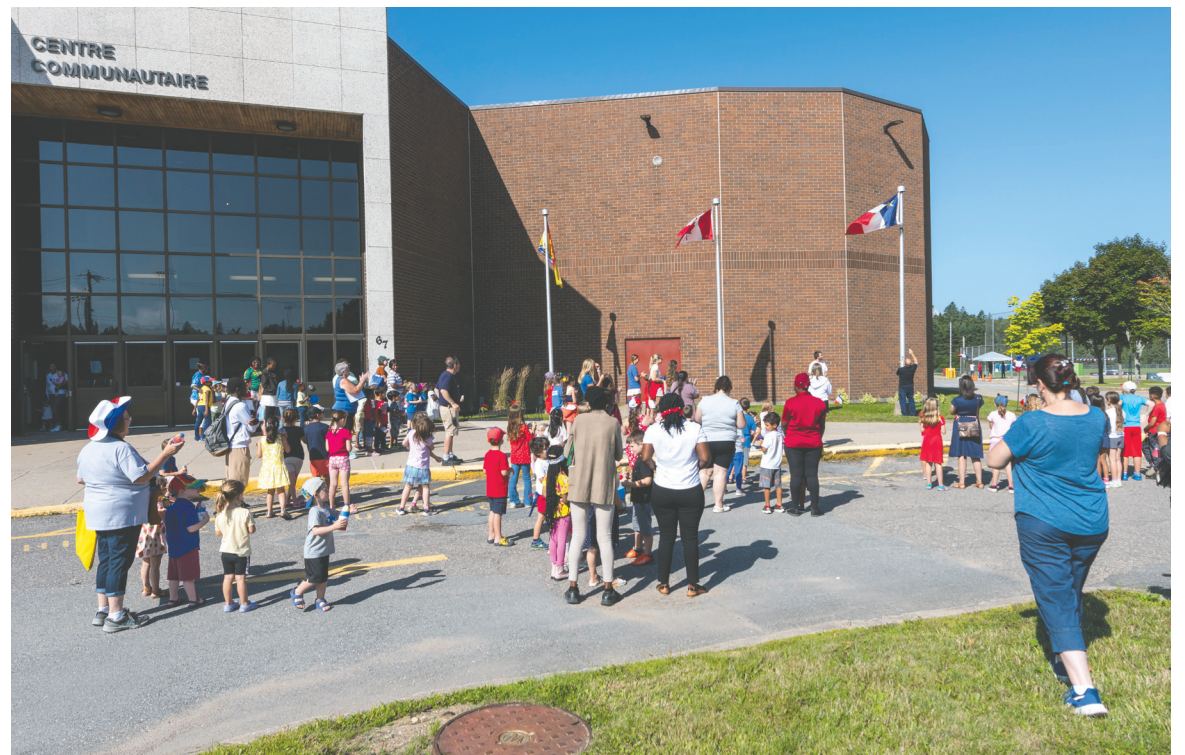
Avant le tintamarre, les enfants ont eu une petite cérémonie de levée du drapeau.