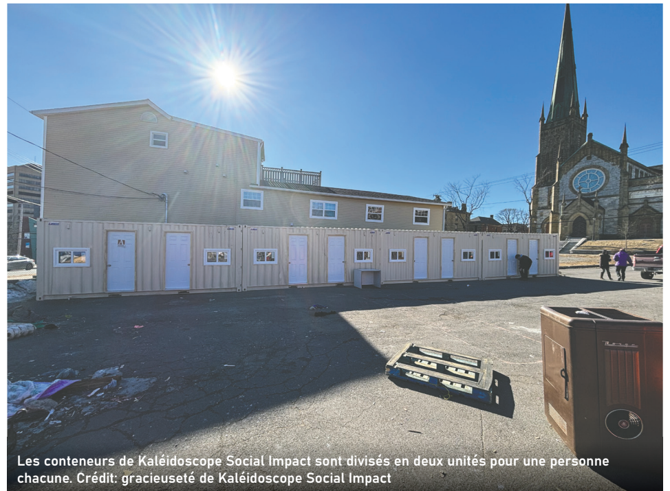
Les conteneurs de Kaléidoscope Social Impact sont divisés en deux unités pour une personne chacune.