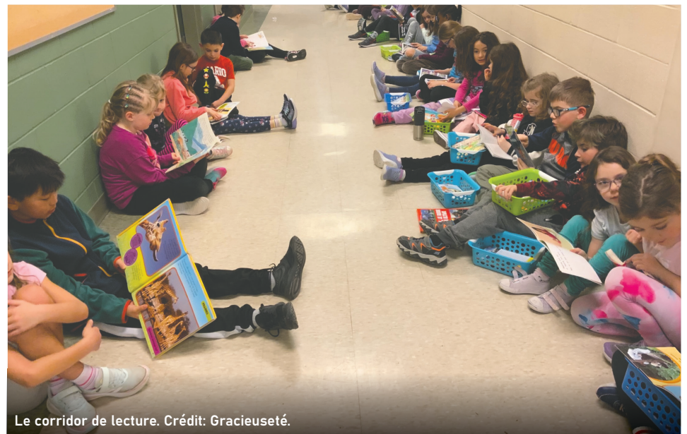
Le corridor de lecture.