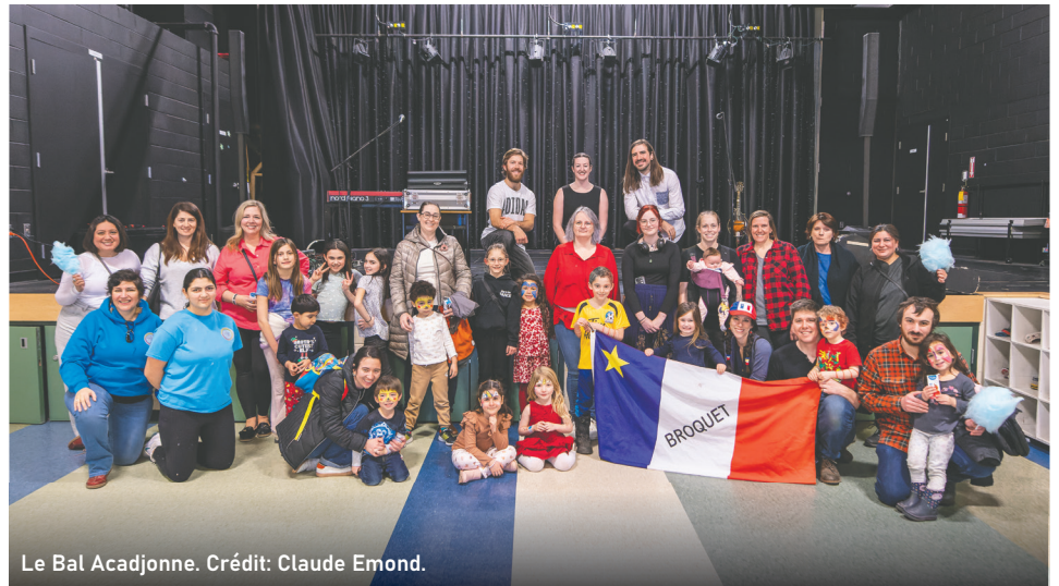
Le Bal Acadjonne.

Il est important que nos pionniers et pionnières, aujourd'hui, demain et pour toujours, soient fiers de leur francophonie et il faut continuer de la faire briller !