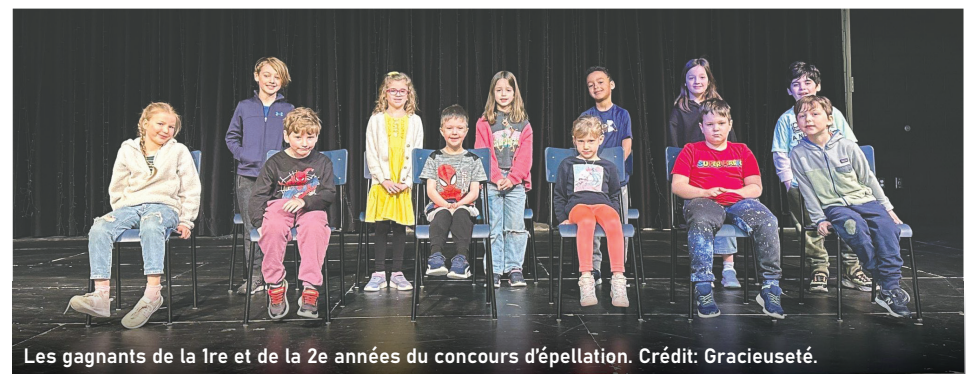
Les gagnants de la 1re et de la 2e années du concours d'épellation.