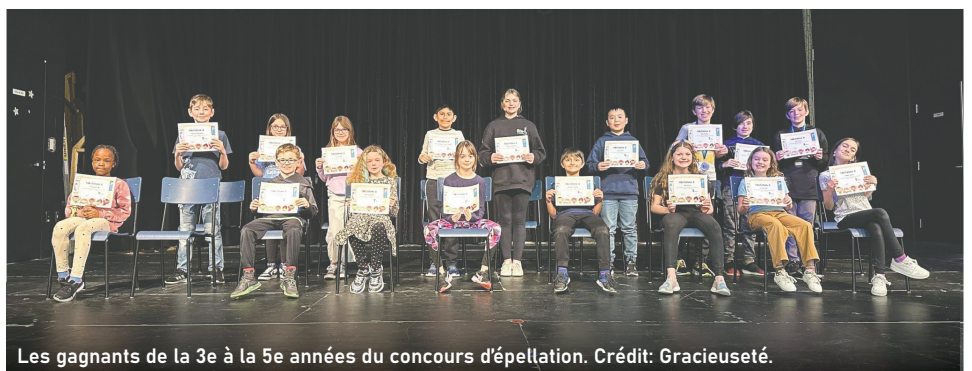
Les gagnants de la 3e à la 5e années du concours d'épellation.