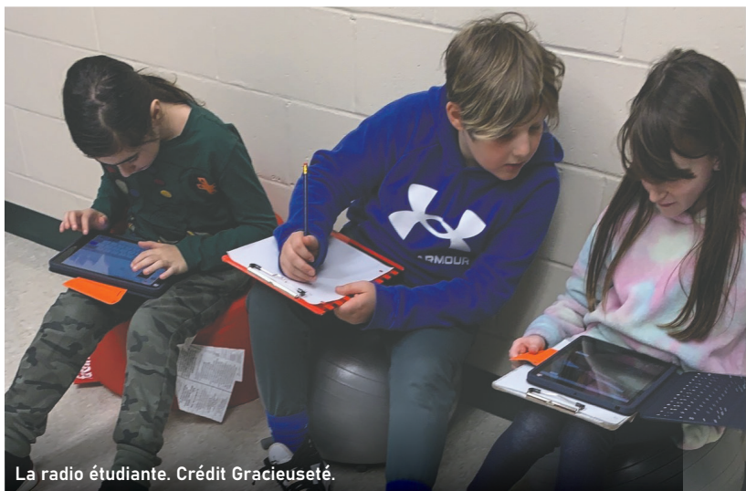
La radio étudiante.

L'ACADIE EN MUSIQUE & EN DANSE BAL ACADJONNE L'ÉCOLE DES PIONNIERS