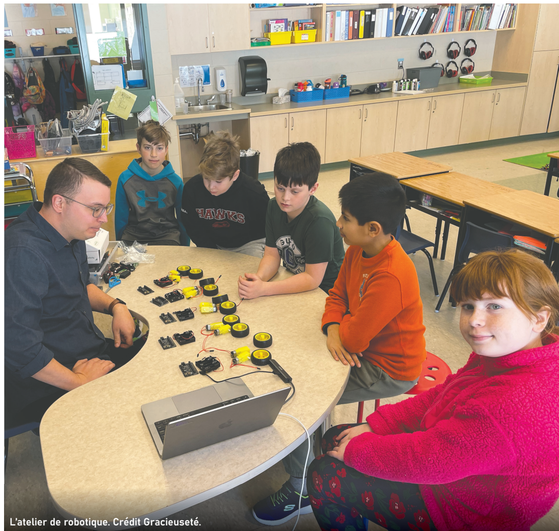
L'atelier de robotique.

En adoptant une approche flexible et inclusive, le personnel démontre son engagement envers le développement des compétences de ses élèves. L'initiative Pionniers en ACTION ne se limite pas seulement à l'acquisition de connaissances académiques, mais vise à former des individus équilibrés, créatifs et résilients. Cette initiative illustre parfaitement comment l'éducation peut évoluer pour répondre aux besoins changeants de la société tout en plaçant le bien-être des élèves au premier plan.