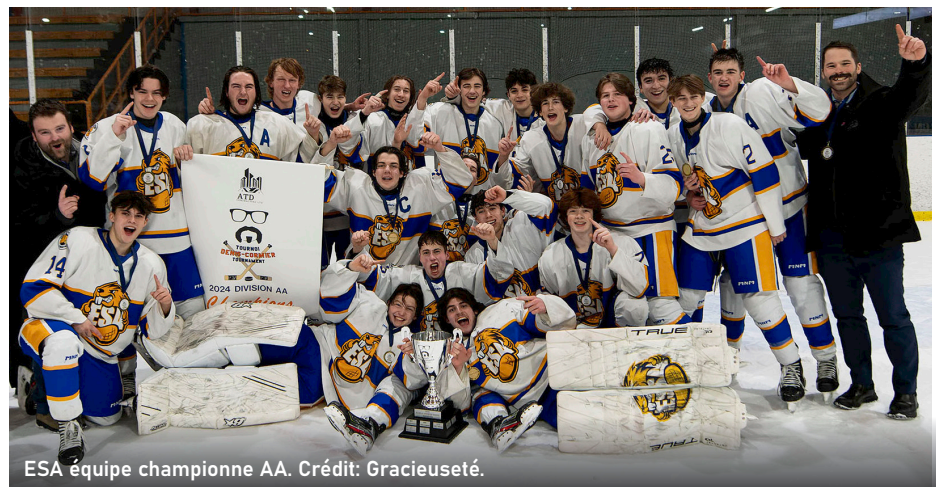
ESA équipe championne AA.