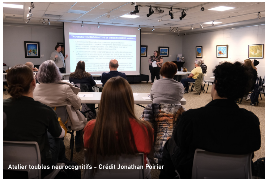
Atelier troubles neurocognitifs