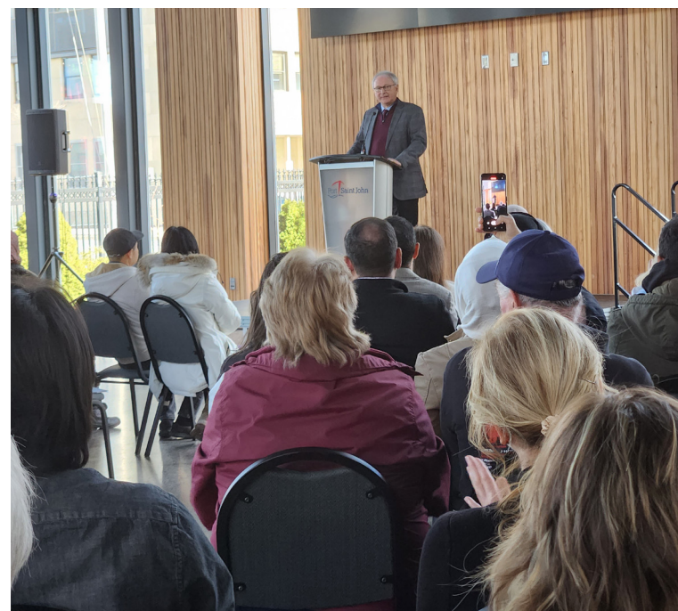
Blaine Higgs répondant aux questions.

Les défis des immigrants ont également été abordés au cours de cette rencontre, certains profitant du temps des questions pour évoquer leurs situations personnelles.