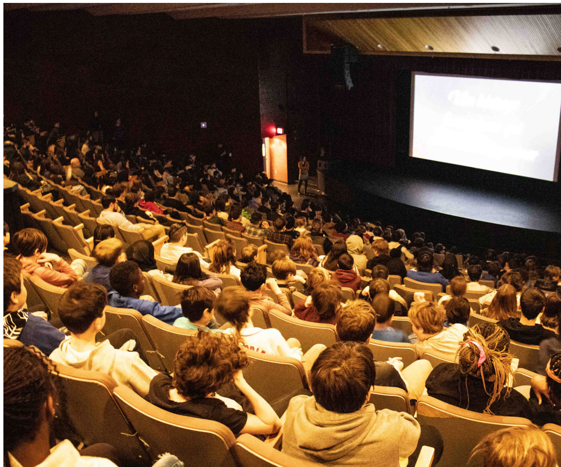
Les élèves du Centre scolaire-Samuel-de-Champlain lors du dévoilement.

Chacun d'entre eux a évidemment hâte de revoir les artistes avec qui ils avaient chanté lors des éditions auxquelles ils ont participé, mais ils sont aussi curieux de rencontrer et d'échanger avec Christian Kit Goguen. Celui-ci fut le tout premier parrain de l'événement et aucun d'entre eux n'a eu la chance de chanter avec lui.