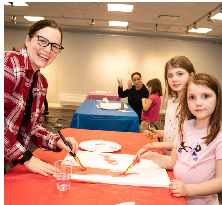
21 duos intergénérationnels ont participé à l'activité de peinture avec Audrey Smith.