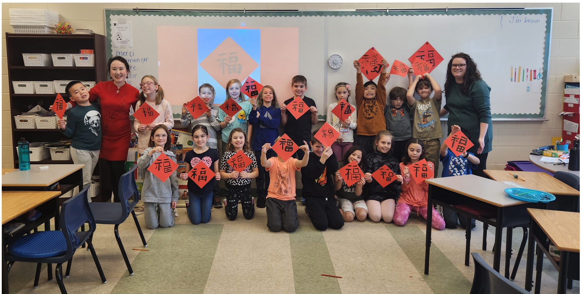
La classe de Madame Alexandra.