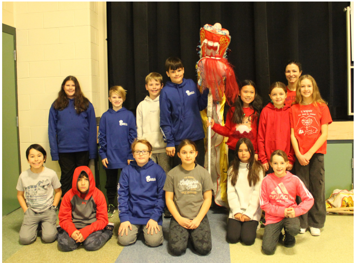
Des élèves avec le dragon chinois.