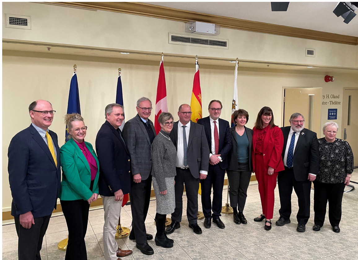
Les dignitaires présents le jour du dévoilement.

- Enfin, certains élèves viendront directement de France. Ils viendront passer une année à Saint-Jean avant de rentrer en France pour la suite de leurs études.