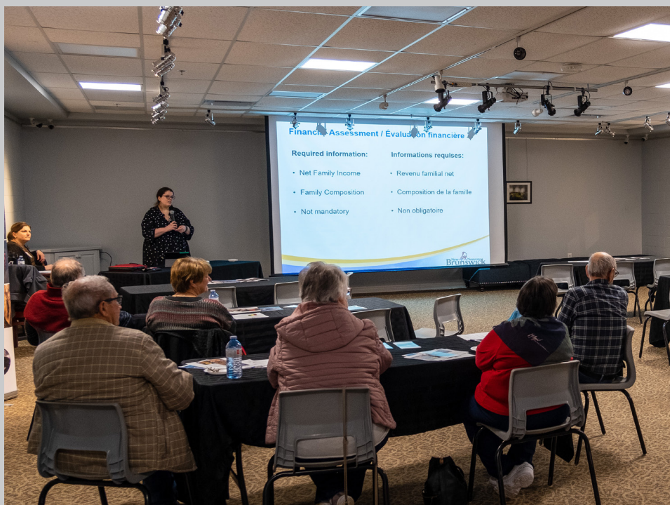
Une présentation sur les services de longue durée pour aînés offerte par le ministère du Développement social suivi d'une collation a eu lieu le 17 janvier dernier.