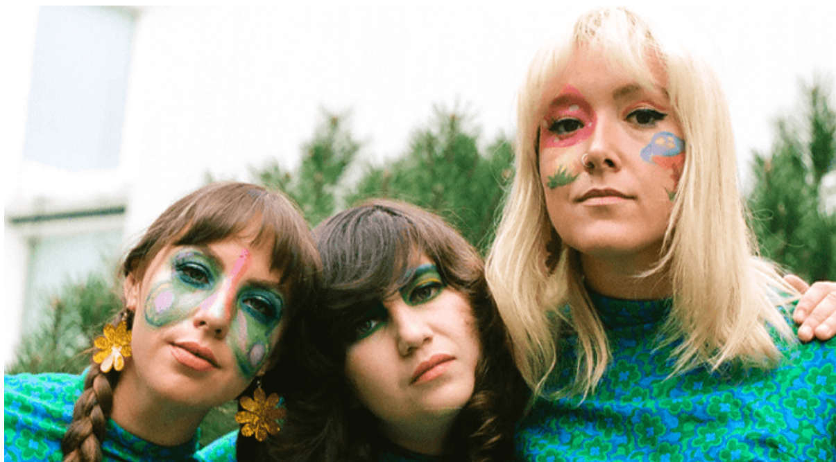
Les Hay Babies.

Elles auront à cœur de vous offrir un spectacle concept, méticuleusement travaillé et bien sincère.