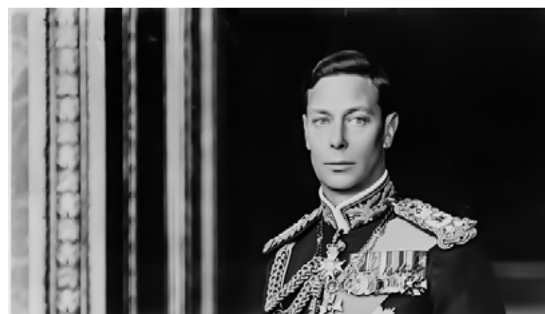
Le Roi Georges VI.

Le jour vint et les soldats firent leurs défilés, marchant en synchronie aux ordres de leur commandant, puis furent ordonnés de se tenir au garde-à-vous pour être inspectés. Au loin, il entendit des pas résonner dans le silence puis ici et là, il entendit le Roi George VI s'arrêter et causer avec un soldat. Regardant le tout d'un coin d'œil, notre soldat d'Acadieville devint de plus en plus nerveux, la peur de ce dont il dirait, si jamais le roi s'arrêtait lui parler. Divers scénarios lui remplirent la tête. «Waillons dont ben, se dit-il, quoi's qu'est les odds ?» Il décida alors de penser à autre chose afin de baisser son anxiété. Sous peu, il oublia le tout. Des sons lointains, un vent doux, un soleil essayant de percer