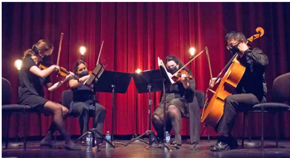
Le Quatuor Résonance.