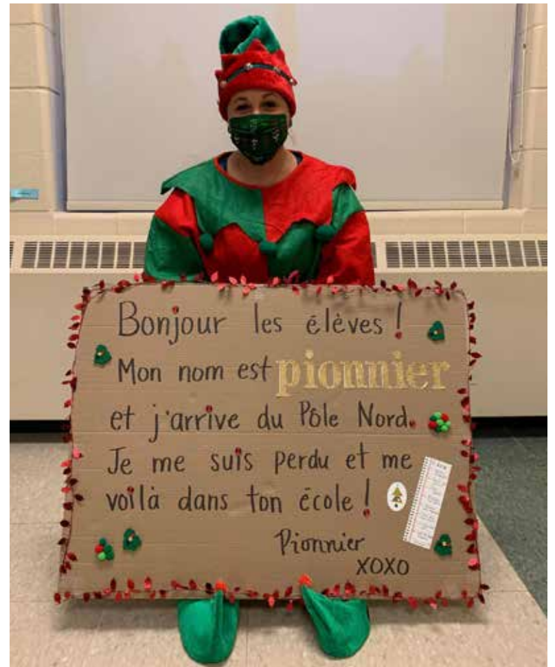
Pionnier le lutin.