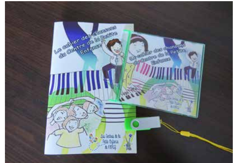
Le livre de chansons et le disque.

Les restrictions dues à la COVID-19 ont de nombreux impacts négatifs sur la vie des enfants tant au niveau social qu'éducatif. Lorsqu'ils sont issus d'un milieu défavorisé, ces impacts sont encore plus grands en raison du contexte familial difficile dans lequel plusieurs vivent. Pour certains enfants d'âge préscolaire issus de milieux vulnérables, le ministère du Développement social a mandaté le Centre de ressources familiales de créer des trousse d'apprentissage