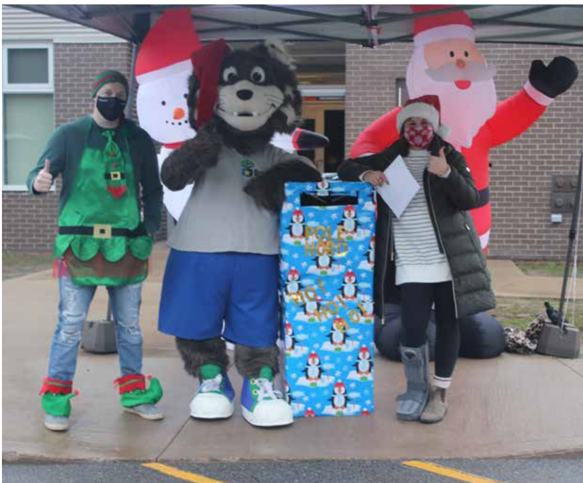
Un lutin, Félynx et Madame Anik ont accueilli les enfants venus déposer leurs lettres au père Noël.