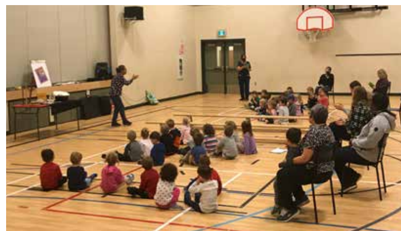
Représentation à l'École des Pionniers de Quispamsis.