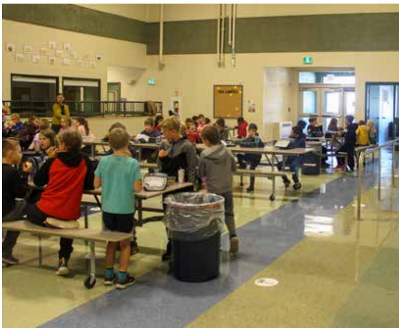
Les élèves sont contents que la cafétéria soit à nouveau de service.