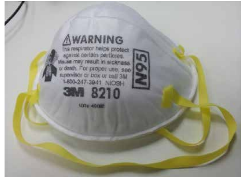
Un masque N95.

Certains commencent aussi à fabriquer leurs propres masques à l'aide de simples morceaux de tissu. Ces masques-là n'ont pas les mêmes caractéristiques que les deux types de masques médicaux cités plus haut. Il n'y a aucune preuve scientifique de leur efficacité pour se protéger d'une contamination. Ils peuvent à la rigueur être utiles pour protéger les autres, si on est soi-même malade. «Il n'y a pas de différence entre porter un masque artisanal et tousser dans son coude», assure Heather Morrison, la médecin-hygiéniste en chef de l'Île-du-Prince-Édouard. «Le masque non médical peut réduire la propagation du virus à partir de personnes infectées, complète Theresa Tam sur Twitter. Ces masques doivent être utilisés comme ajout, pas pour remplacer les pratiques de santé publique comme l'éloignement physique ou le lavage des mains».