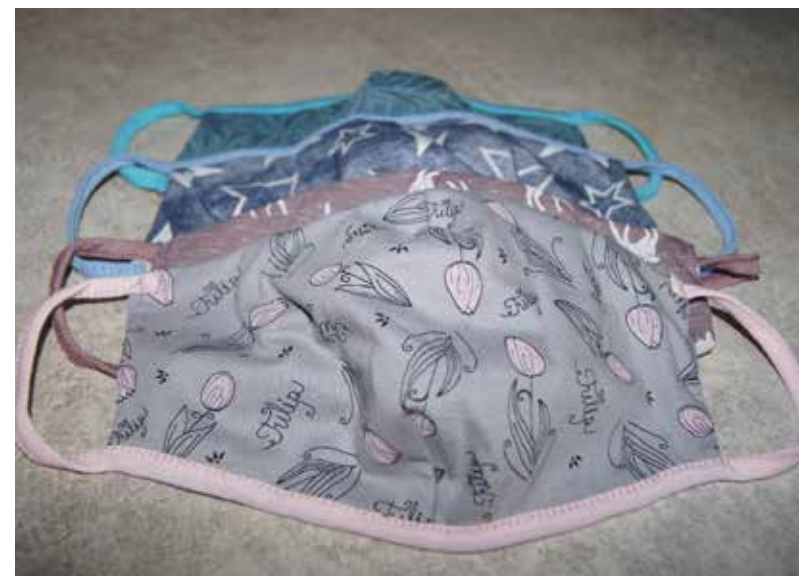
Des masques artisanaux.