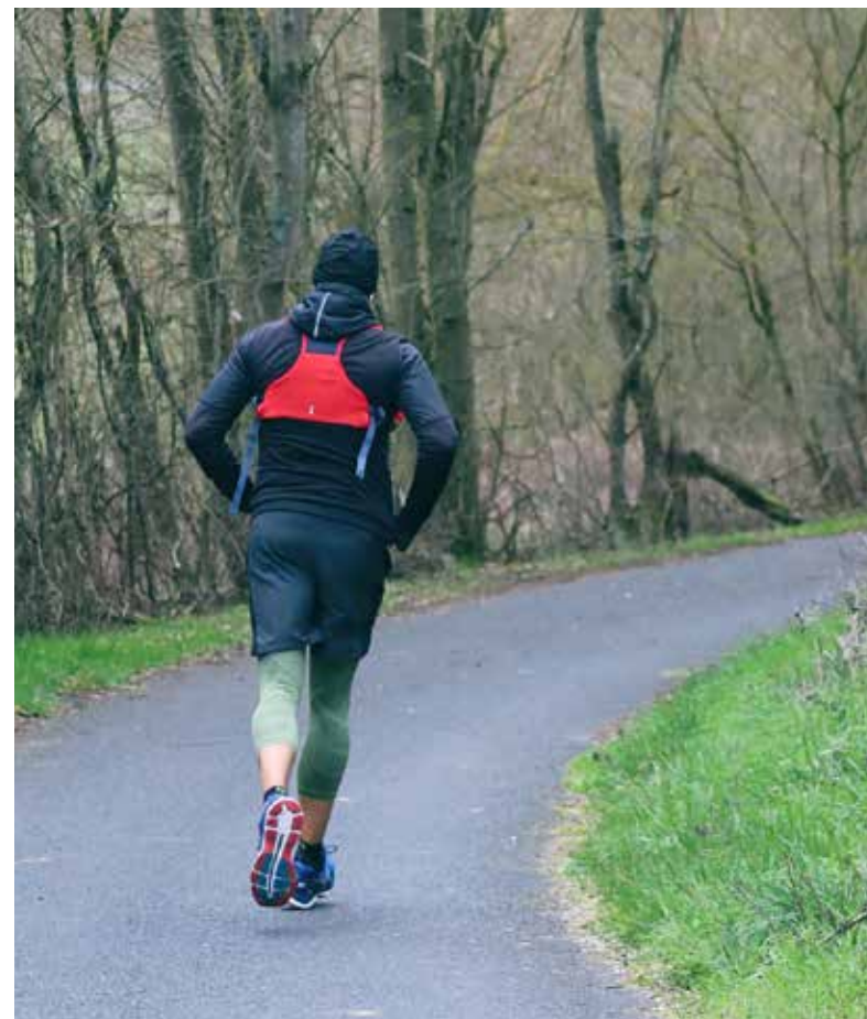
Malgré le confinement, il faut rester en forme.

mes amis sur Facebook presque tous les jours. Alors que cette pandémie est perçue d'un extrême à l'autre par certains, j'essaie de trouver une balance et du positif dans tout ça. Figurativement, lorsque mon verre devient moitié/moitié, je me dis, bien voilà donc plus de place pour en ajouter. Cependant comme toutes bonnes choses, je ne cherche pas à abuser!