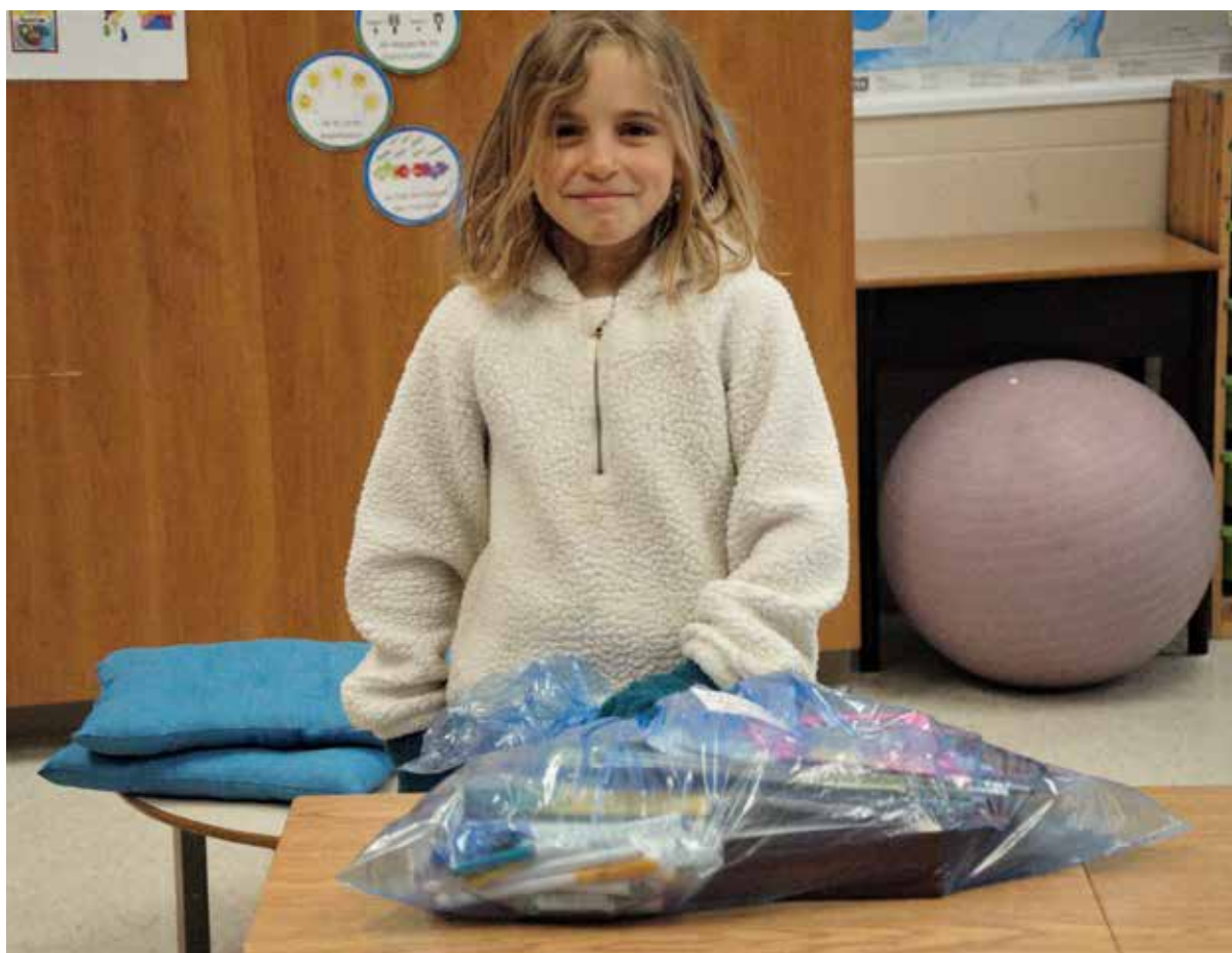
Victoria a pu récupérer ses effets personnels à l'école.

Mais ce n'est que partie remise les amis! Merci au travail extraordinaire des bénévoles et du personnel de l'école, qui ont préparé le matériel, la signalisation et qui se sont assurés que tous puissent circuler dans l'école en toute sécurité. Bon été et à la prochaine année scolaire!