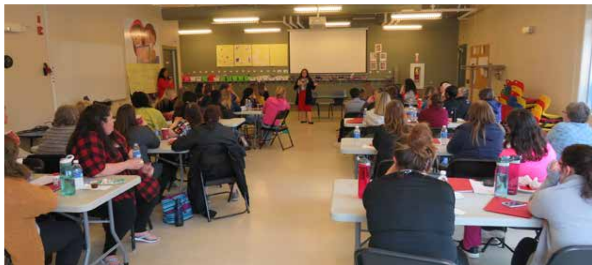
Les éducateurs et éducatrices durant leur journée de formation en mai 2019.

Association Régionale de la Communauté francophone de Saint-Jean inc.