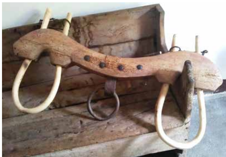
Un "martyr".

C'est là que je compris qu'il cherchait un joug.