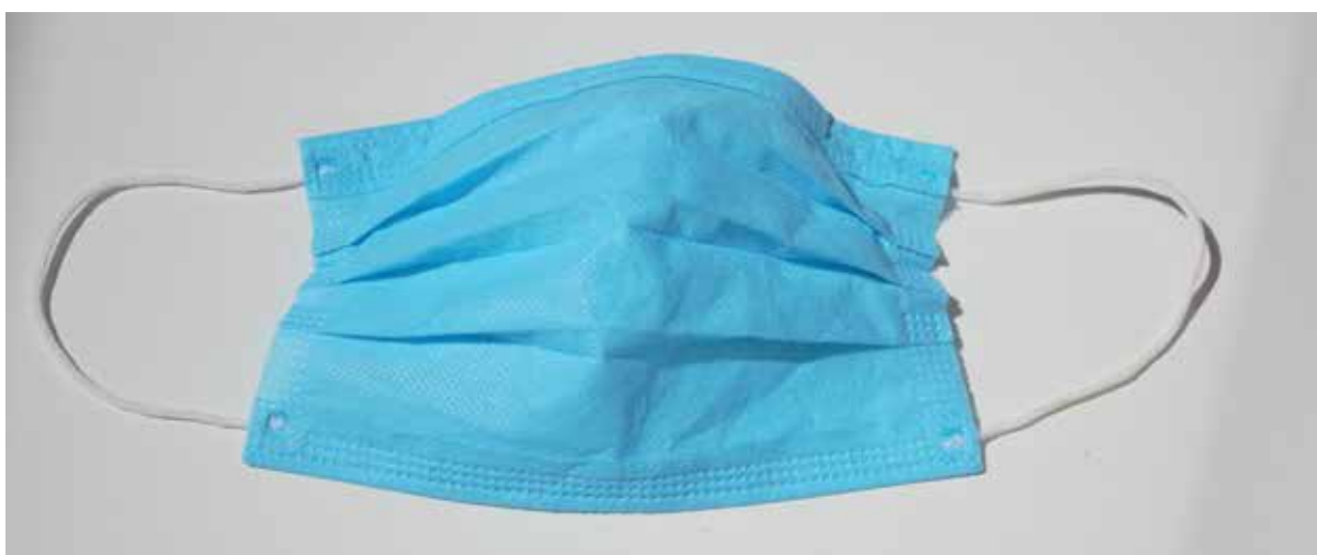
Un masque chirurgical.