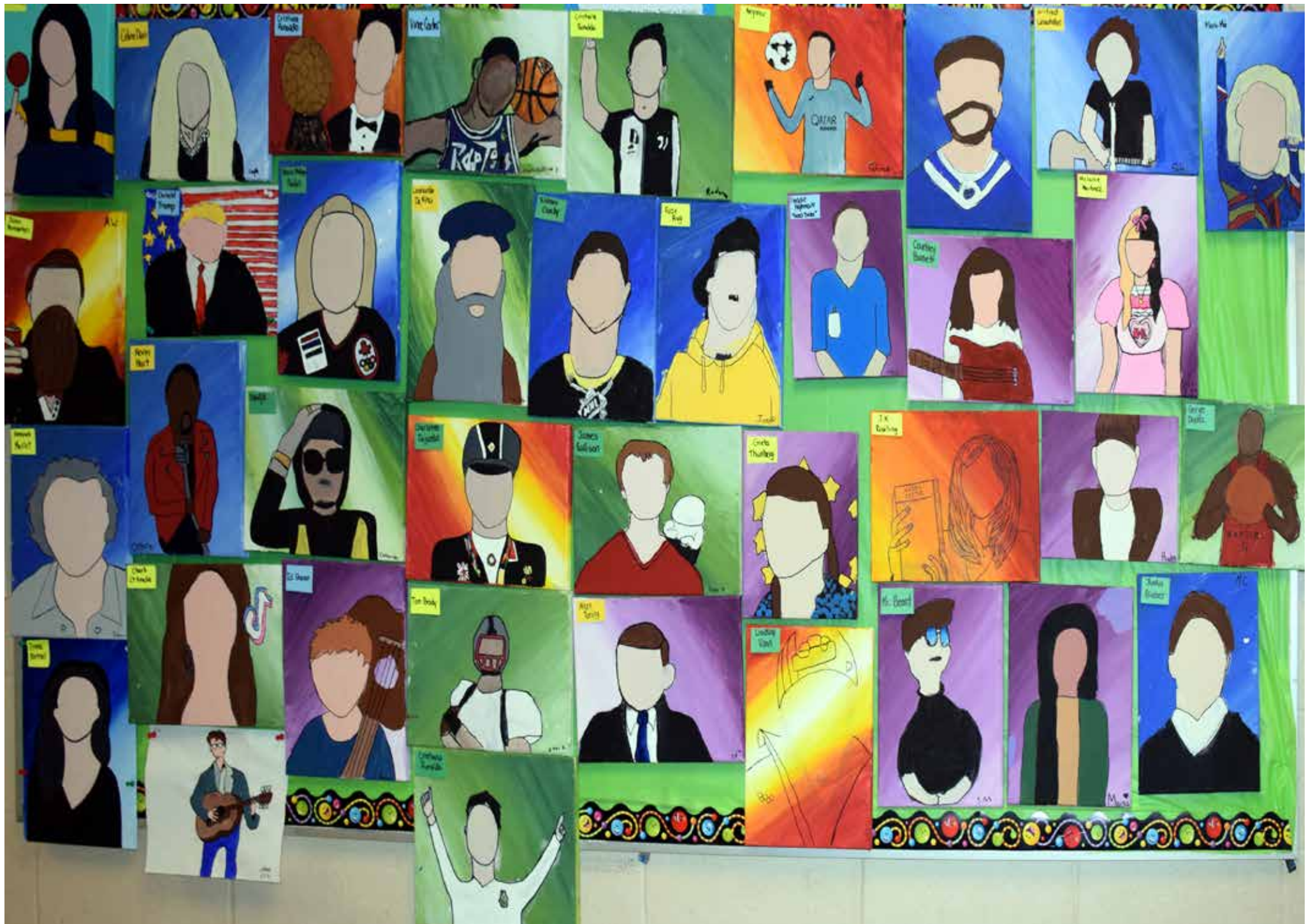
La murale contenant toutes les oeuvres de la classe de Monica Martine.