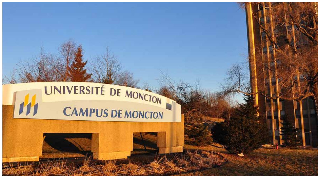
L'Université de Moncton.

Aujourd'hui, les jeunes Acadiens mettent naturellement en avant leur identité linguistique. Ils ne veulent pas être perçus comme des gens à la veille de disparaître. Ils disent «prenez-nous comme on est, on n'a pas d'explication à vous donner». Mais une certaine élite traditionnelle acadienne, formée en France, a du mal à l'accepter car ce n'est pas conforme à l'idéal qu'elle se fait de la langue.