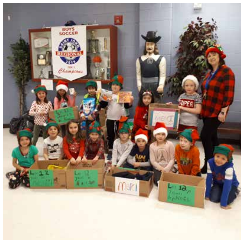
Les élèves de la classe de 1re année de Mme Lianne.