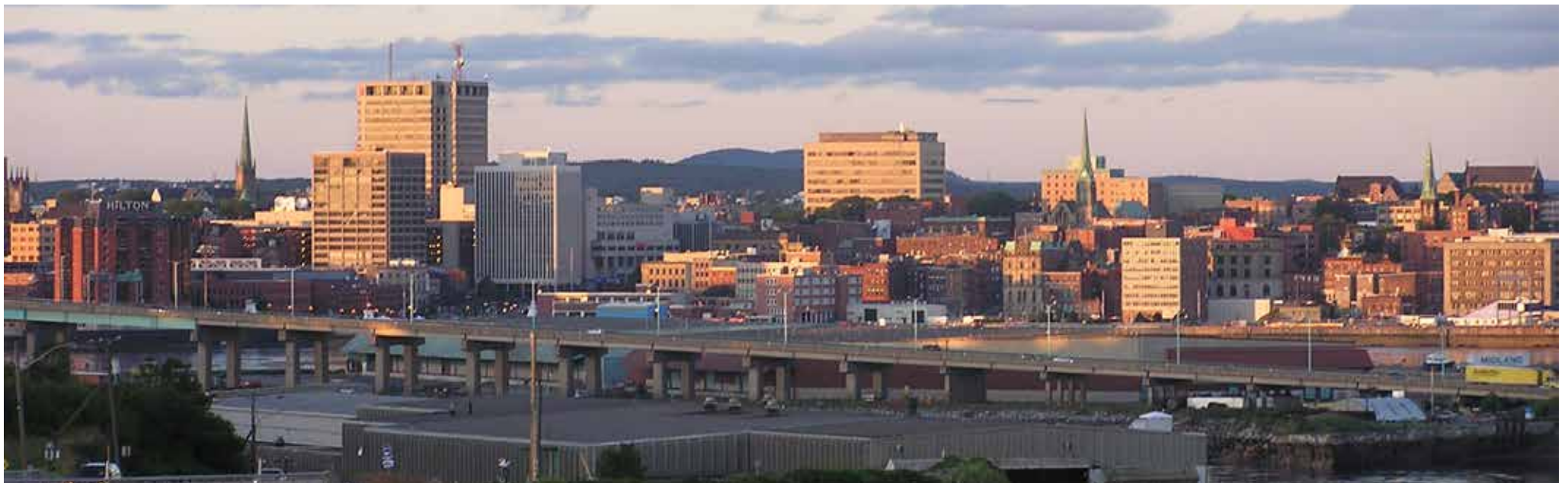
La Ville de Saint-Jean.

Ces écarts pèsent dans la balance lorsque les gens choisissent l'endroit où ils vont s'installer et ces décisions individuelles ont des impacts collectifs majeurs. Ainsi, malgré son taux de taxes plus élevé, la Ville de Saint-Jean continue d'enregistrer des déficits d'année en année.