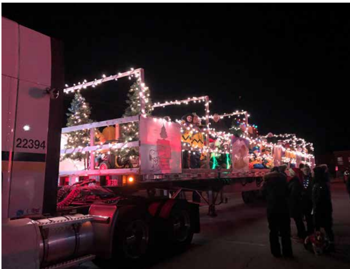
40 Charlie Brown, 20 robots, de la musique de Noël, la niche de Snoopy et des arbres de Noël composaient le char allégorique de l'École des Pionniers.