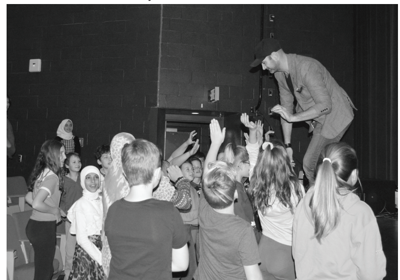
Les élèves du Centre scolaire Samuel-de-Champlain étaient très heureux de faire la connaissance de leur parrain.