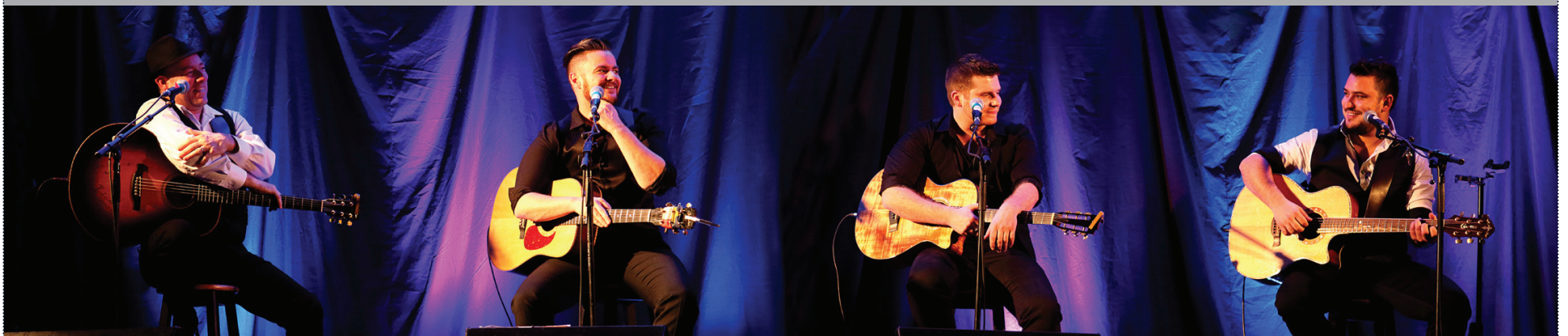
Les Gars du Nord en spectacle.