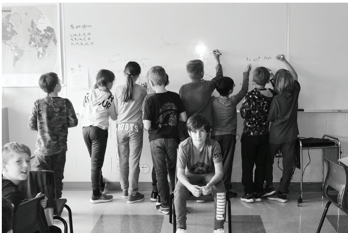
Les élèves écrivent en «cachette» des messages d'amitié à un collègue.