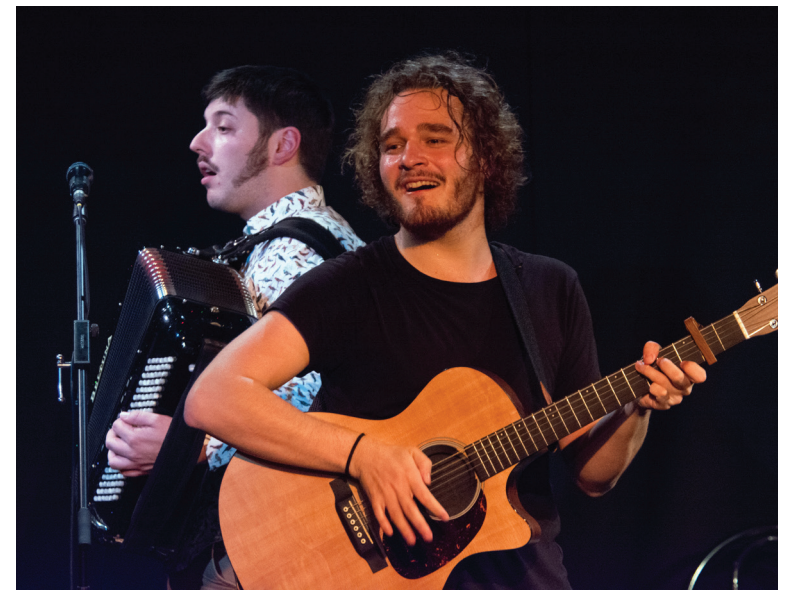
Les Fils du Facteur durant le spectacle.