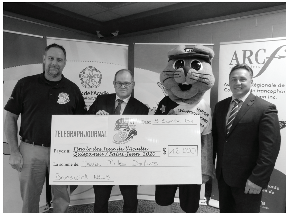
Le Telegraph Journal a offert une contribution de 12 000$.