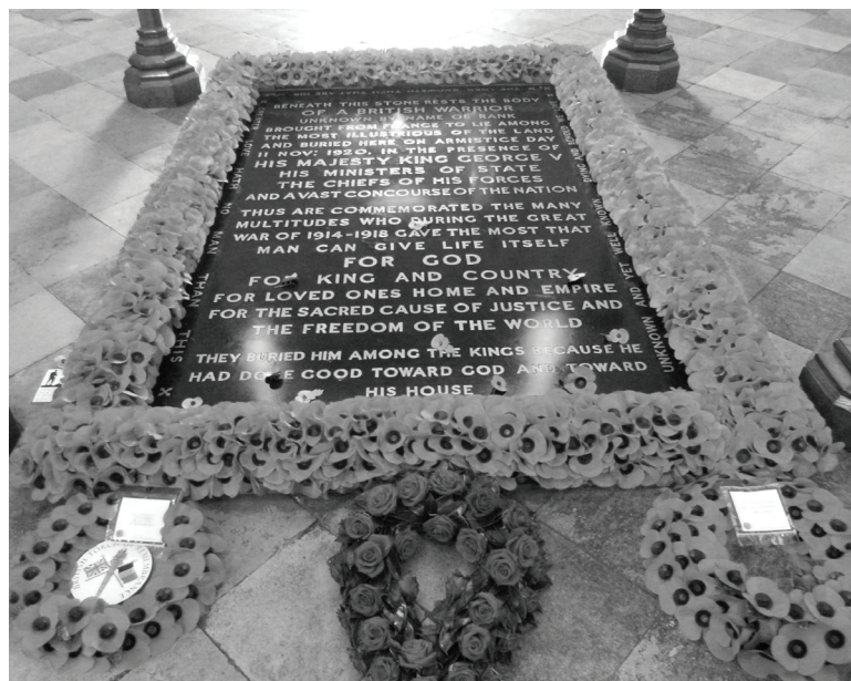
La tombe du Soldat inconnu.

son repos final et chaque année, avec humilité, on lui rend hommage non pour glorifier la guerre, mais en mémoire du coût ultime payé pour nos libertés.