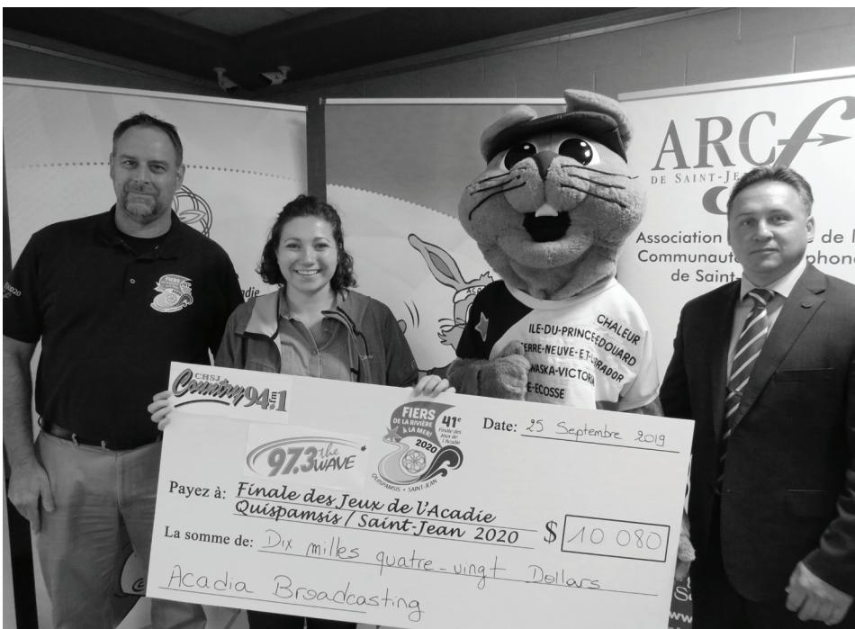
Acadia Broadcasting, qui gère les stations de radio 97,3 The Wave et 94,1 Country, a offert une contribution de 10 080$.