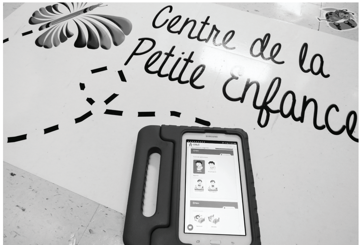
La plateforme Cible Petite Enfance facilitera la communication entre les parents et l'éducateur(trice) de leur enfant.

Nous voilà rendus à l'ère de la facilité et la confidentialité... le tout au service des enfants et de leurs familles.