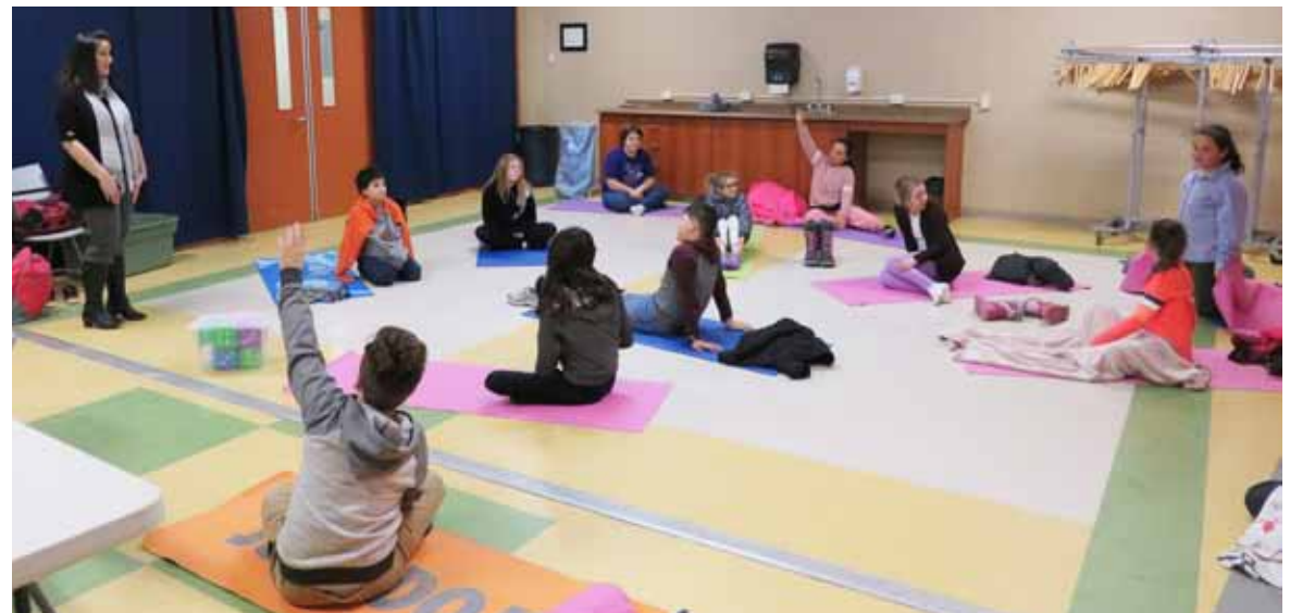
Le groupe de Saint-Jean.

Je me demande donc ce que les jeunes me réservent l'an prochain!