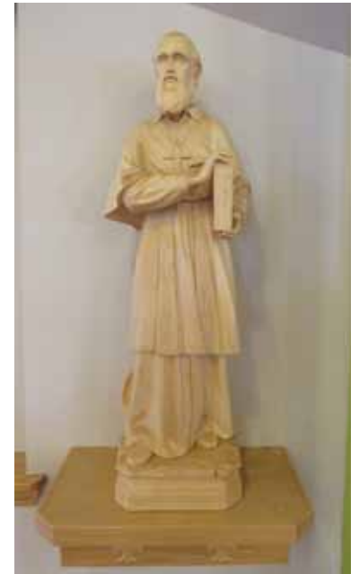
Statue de Saint-François-de-Sales.