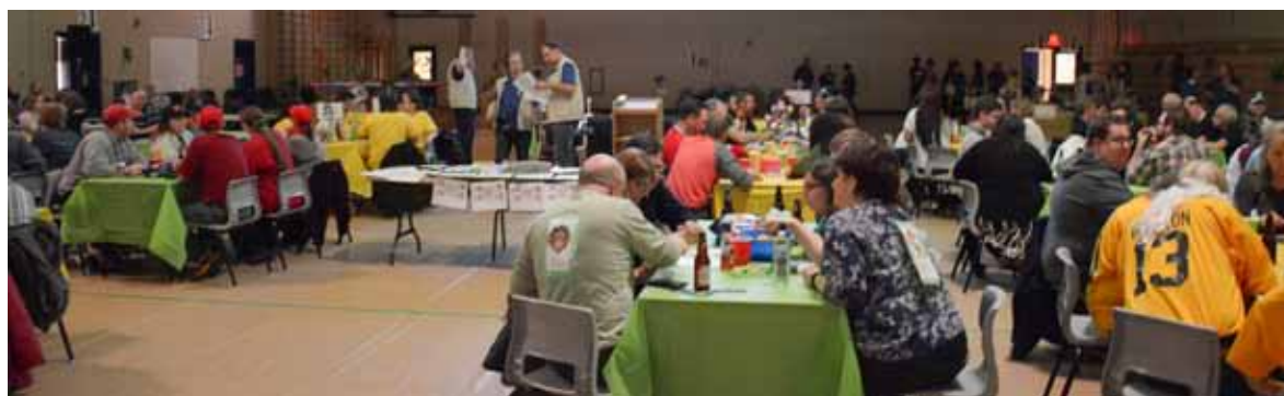
24 équipes ont participé cette année.