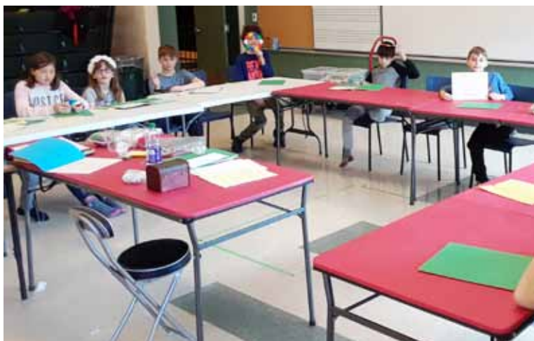
Le groupe de Quispamsis.