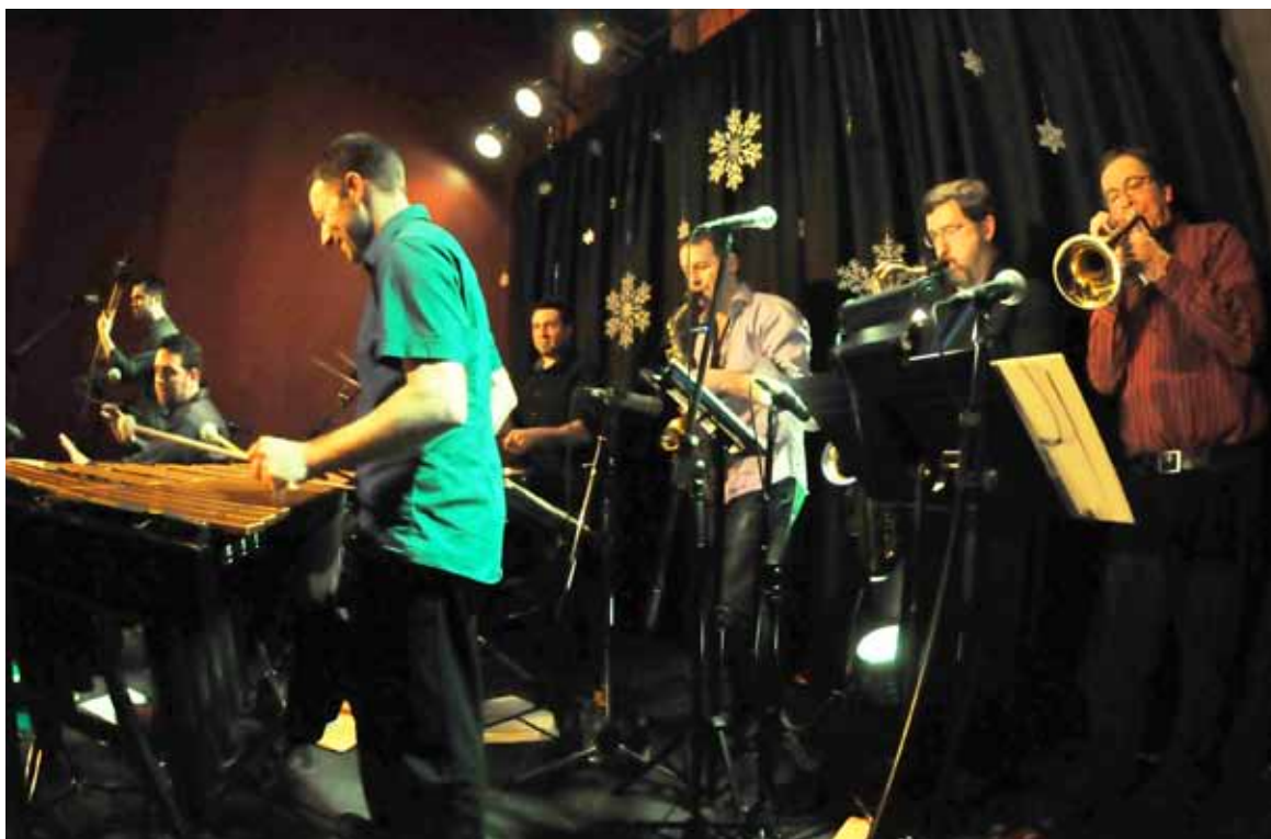
Le groupe musical El Fuego.

C'est donc une date à retenir, un rendez-vous à inscrire à votre agenda familial pour le samedi 16 mars de 16 h à 19 h à la Cafétéria du Centre communautaire Samuel-de-Champlain, au 67 chemin Ragged Point. Venez célébrer la diversité culturelle de notre ville, ses beautés et ses traditions!