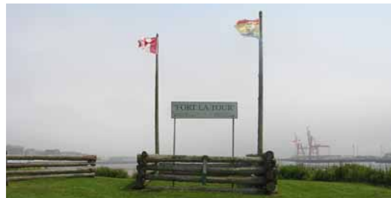
Site actuel du Fort La Tour.