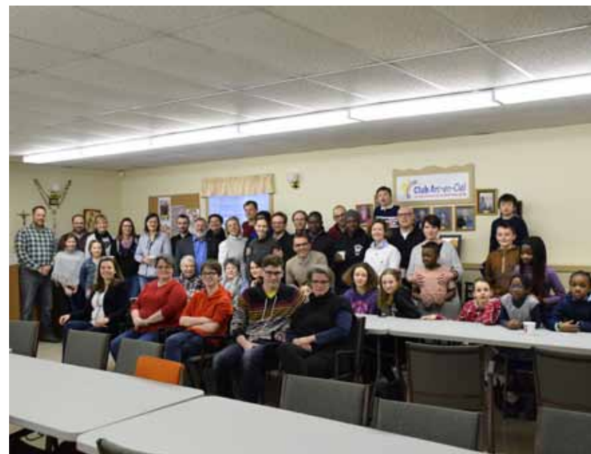
Une cinquantaine de personnes sont venues célébrer l'activité de la Chandeleur.

À la prochaine fois autour d'une nouvelle tradition!