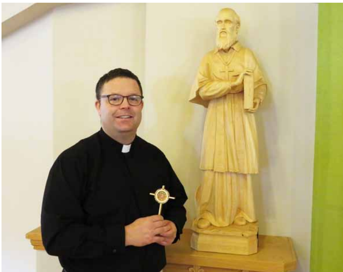
Le Père Knox, tenant la relique de Saint-François-de-Sales.