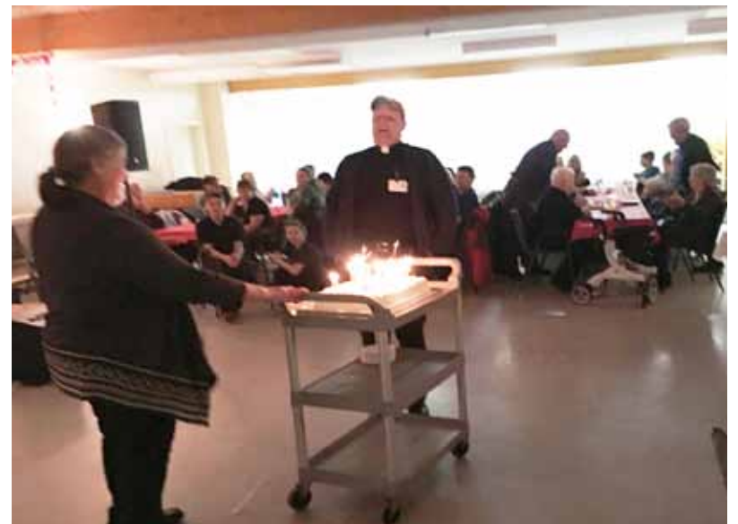
Le 39ième anniversaire du Père Knox a été souligné.