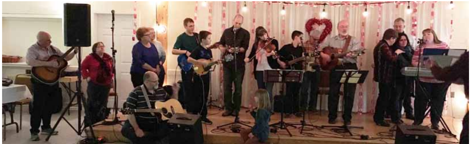
25 musiciens de la communauté ont contribué au spectacle de cette soirée.