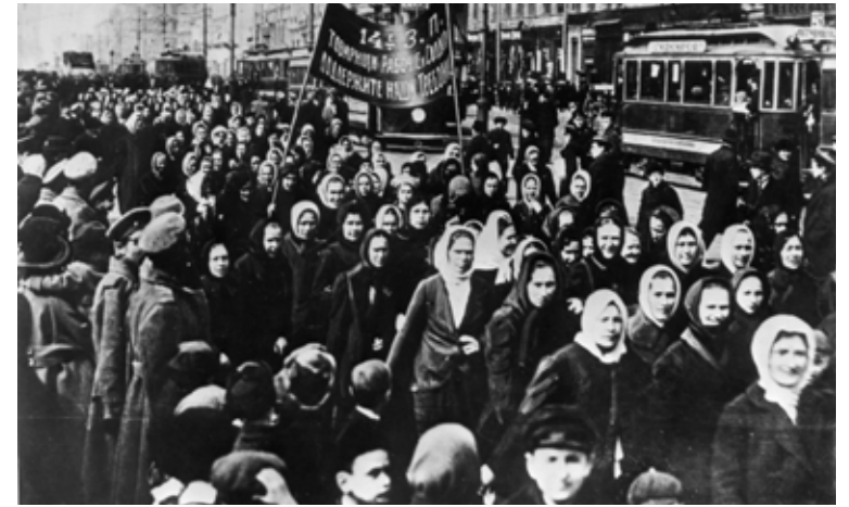
Manifestation de 1917 en Russie.