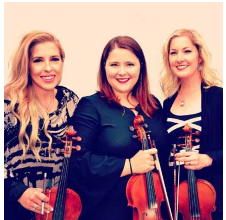
Le groupe musical acadien Fireflies.