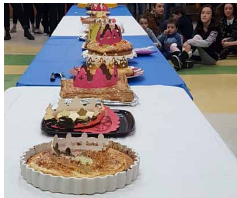
Les galettes servies.

Les participants ayant trouvé cette Galette des Rois comme une excellente occasion de partage culturel, nous allons remettre cela avec la prochaine fête traditionnelle française à célébrer, la Chandeleur, qui cette année sera le samedi 2 février. Mettez cela dans vos calendriers dès maintenant; plus de détails bientôt!