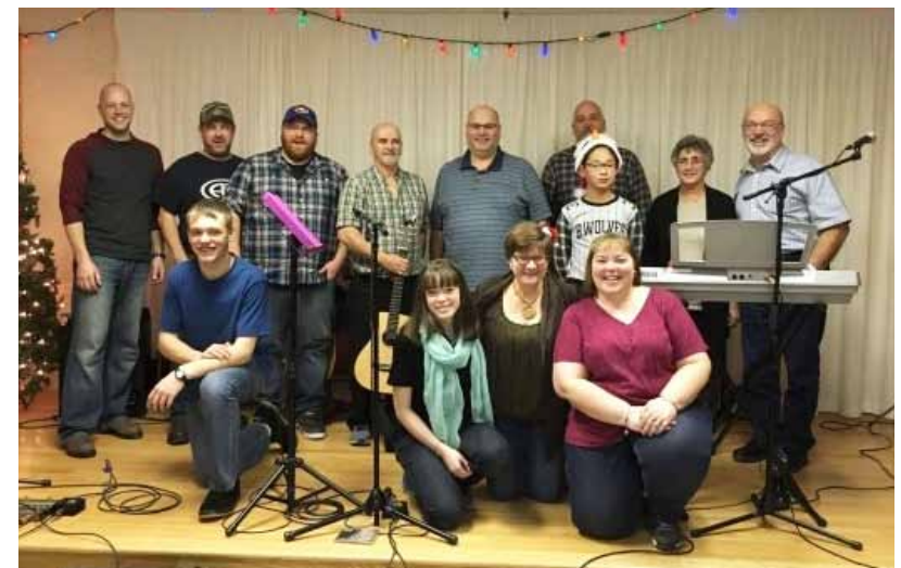
Les musiciens de la soirée.