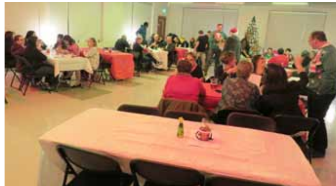
Une cinquantaine d'employés sont venus célébrer dans la Vallée.