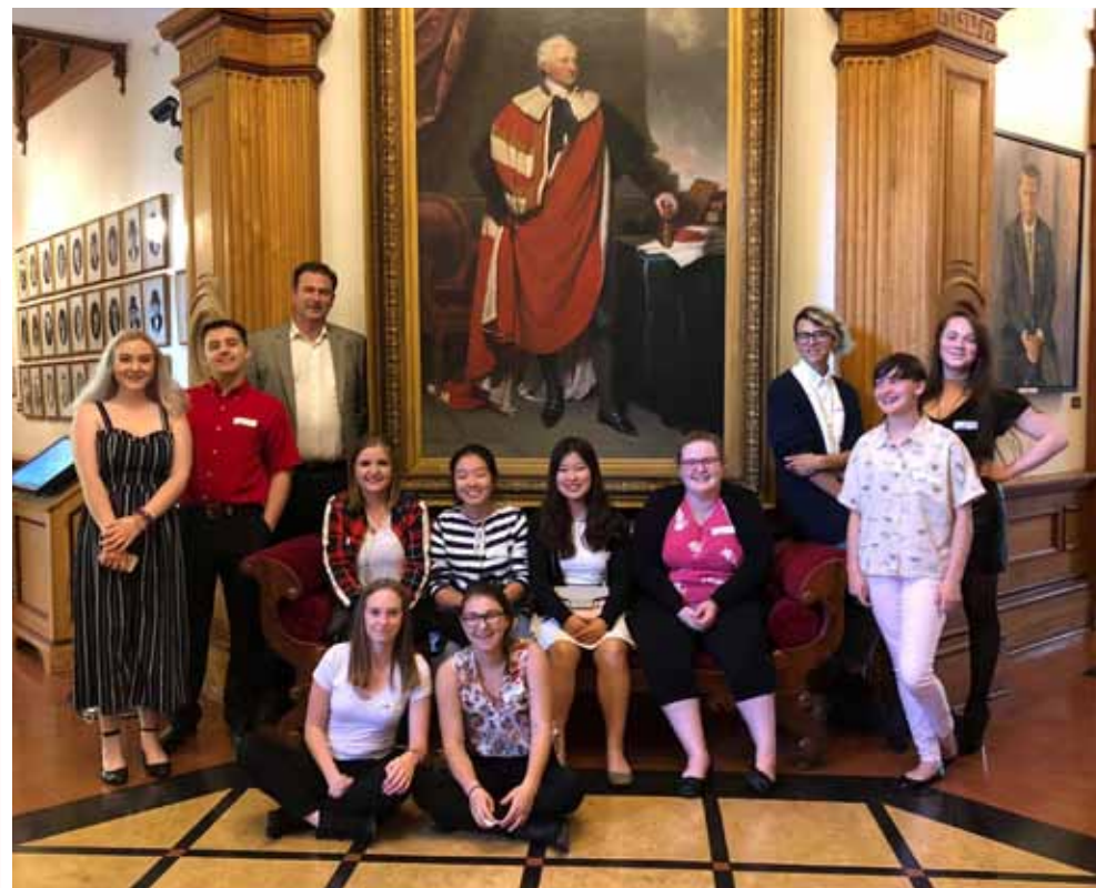
Les membres de la Voix des Jeunes.