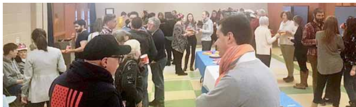
Une cinquantaine de personnes étaient présentes pour célébrer.