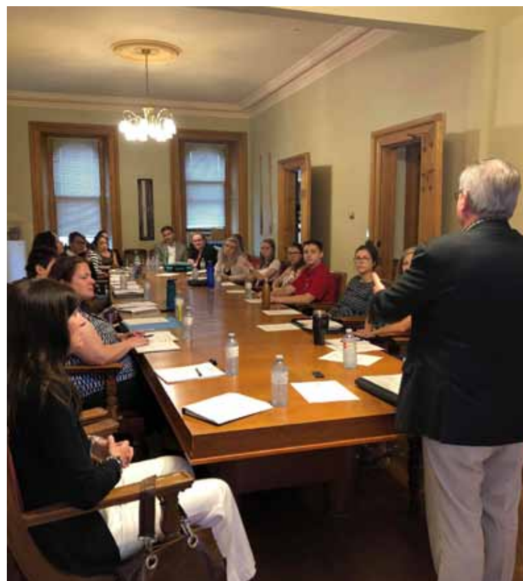
Le comité durant une réunion.

La plus récente implication de la Voix des Jeunes a eu lieu durant la Semaine d'éducation aux droits de l'enfant. Durant cette semaine de sensibilisation, divers articles de la Convention relative aux droits de l'enfant des Nations Unies ont été soulignés auprès du gouvernement. De plus, des présentations sur le sujet ont été faites dans des écoles de la province.