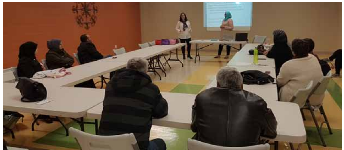
Deuxième atelier Familles en harmonie sur les habilités parentales.