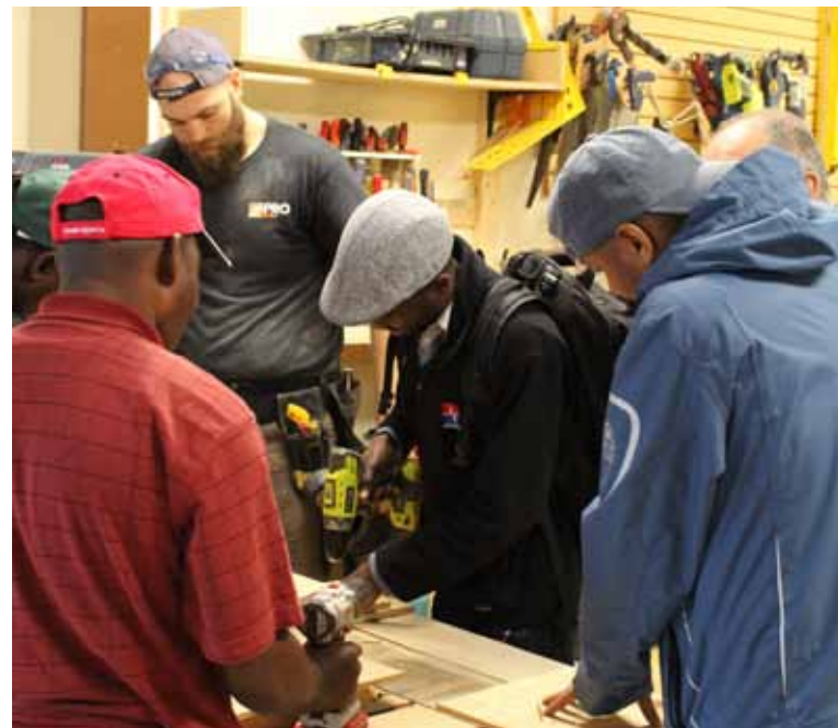
Période d'essais de foret à bois sur une maquette