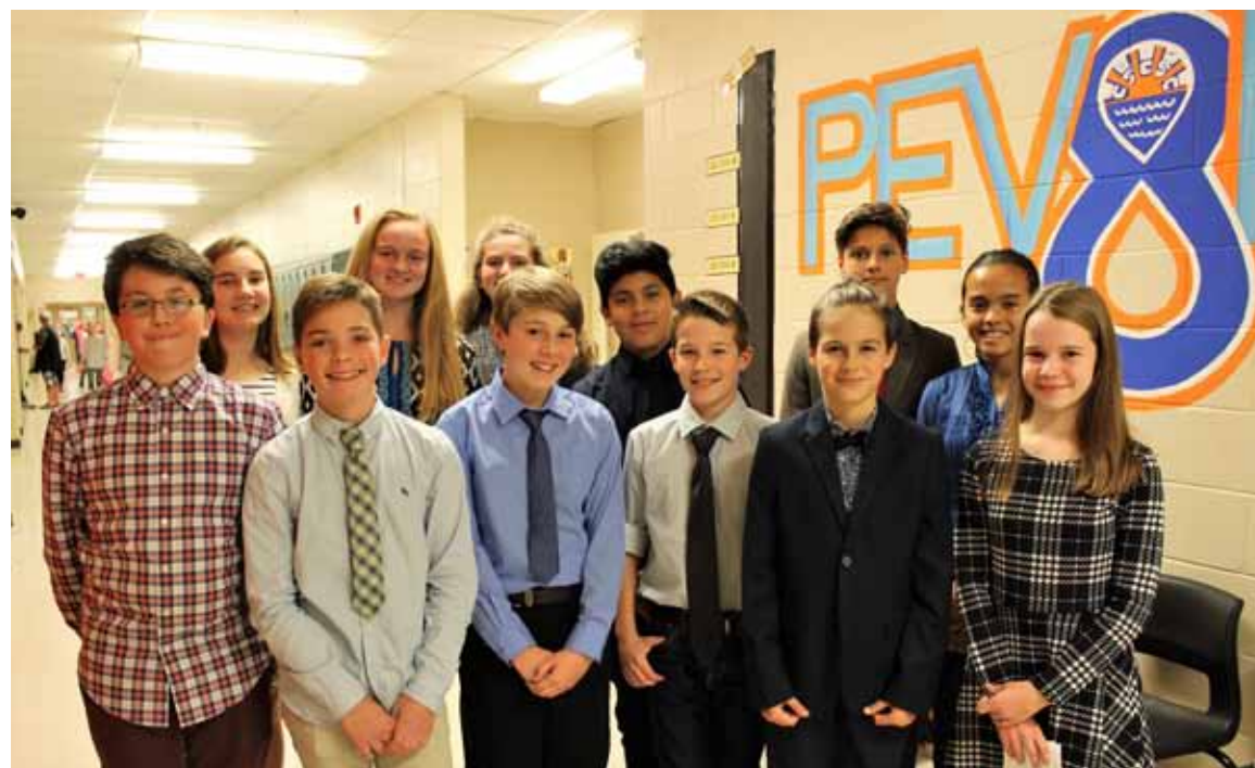
Les 12 candidats qui postulaient pour les 5 postes du CE.