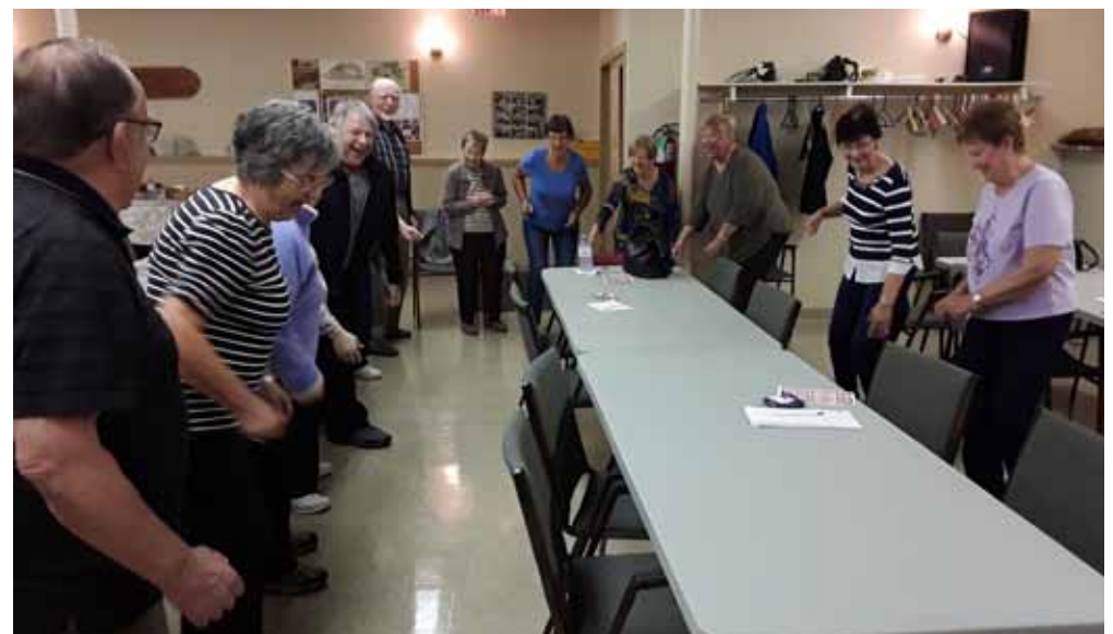
Activité de danse du Club Arc-en-Ciel.