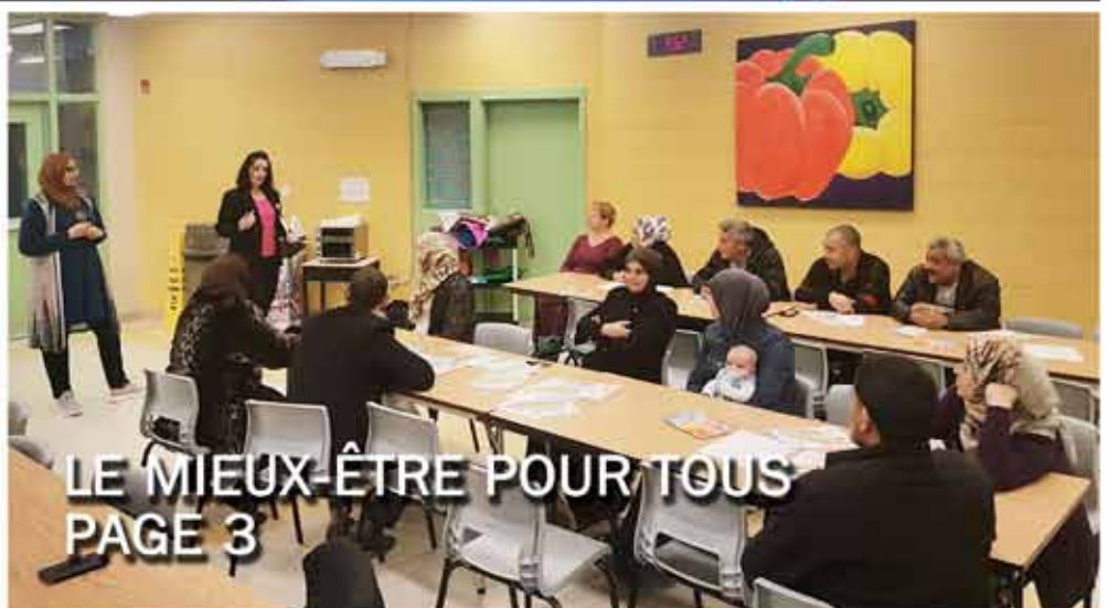
LE MIEUX-ÊTRE POUR TOUS PAGE 3