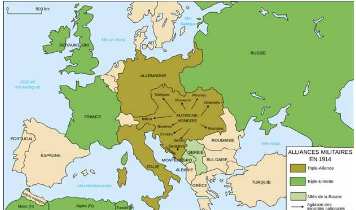
Carte des alliances de la Première Guerre mondiale en 1914.