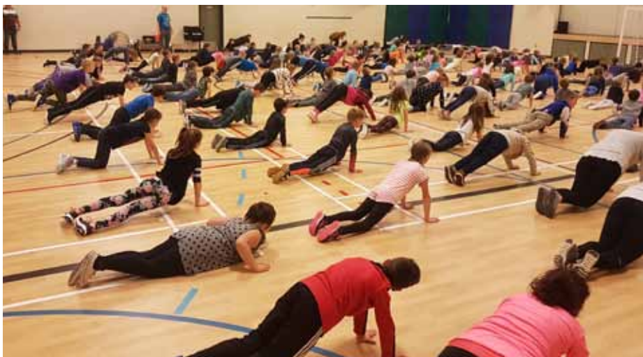
Activité de mieux-être à l'École des Pionniers.