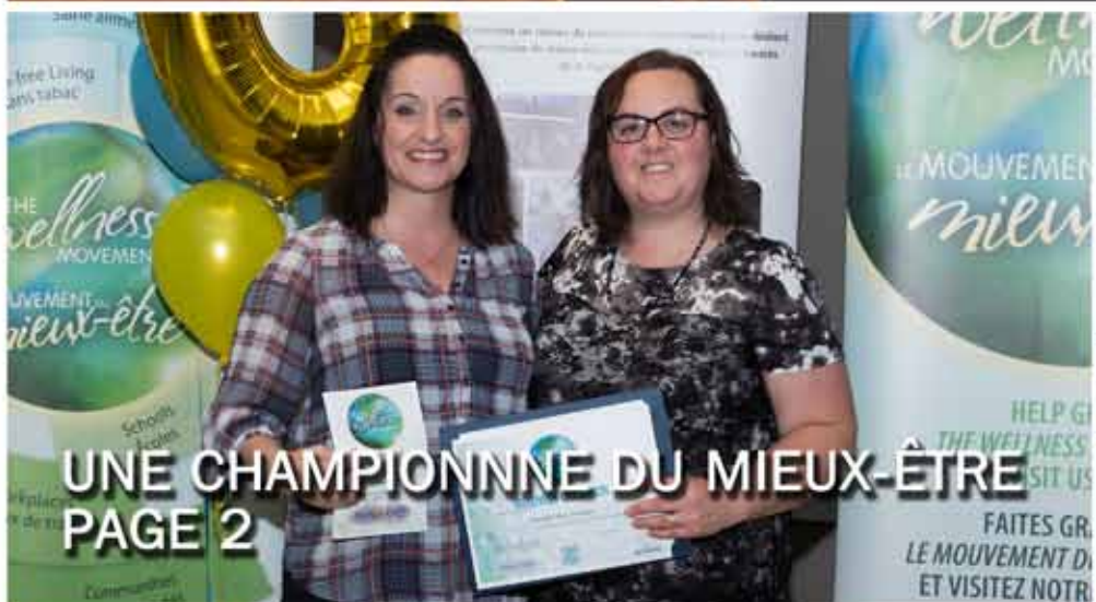
UNE CHAMPIONNE DU MIEUX-ÊTRE PAGE 2