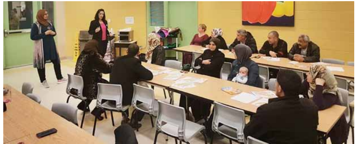
Premier atelier Familles en harmonie sur les boîtes à lunch.