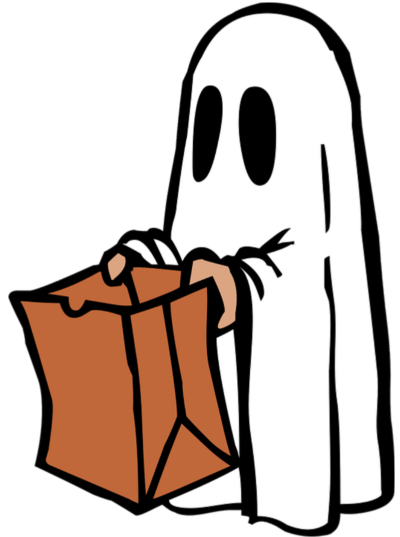
P’tit Jean en fantôme.