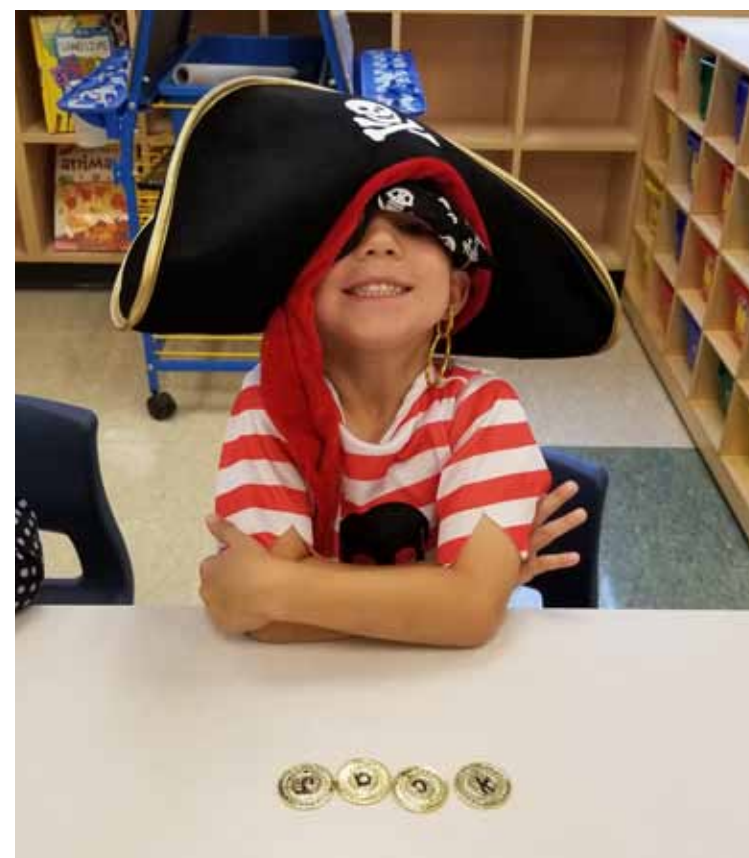
Le pirate Jack Grenier.