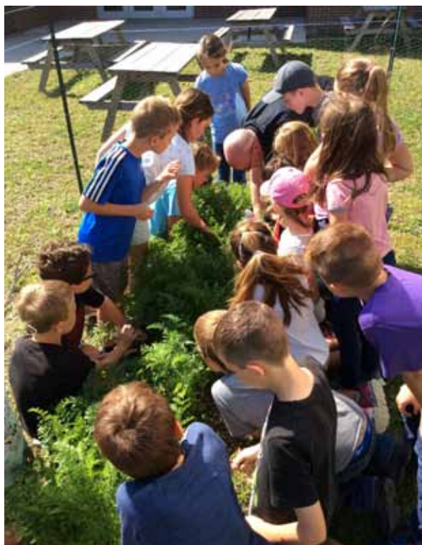
Récolte du jardin.