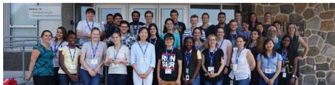
Le groupe de jeunes ayant participé au programme Apprentis en biosciences.