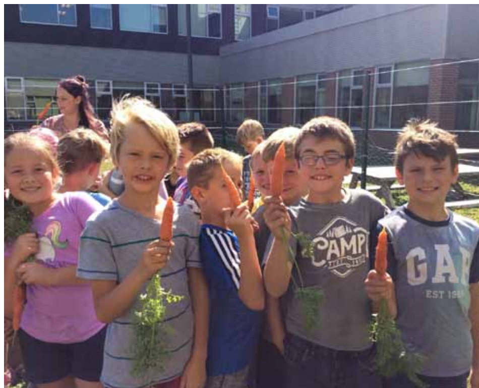
Dégustation des carottes du jardin.