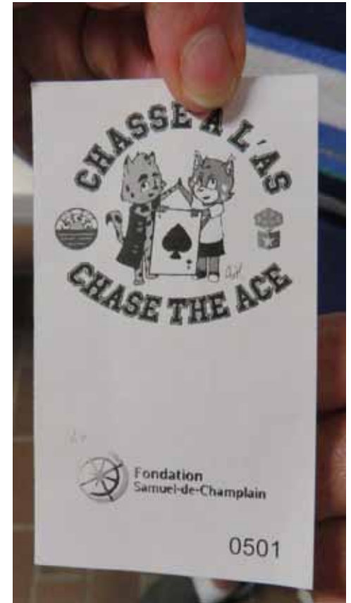
Le premier billet gagnant d'une valeur de 74$.

Fièremment fondée par / Proudly founded by