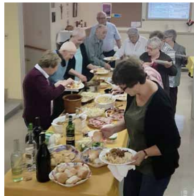
De nombreux plats ont été partagés lors de la dernière réunion du club.