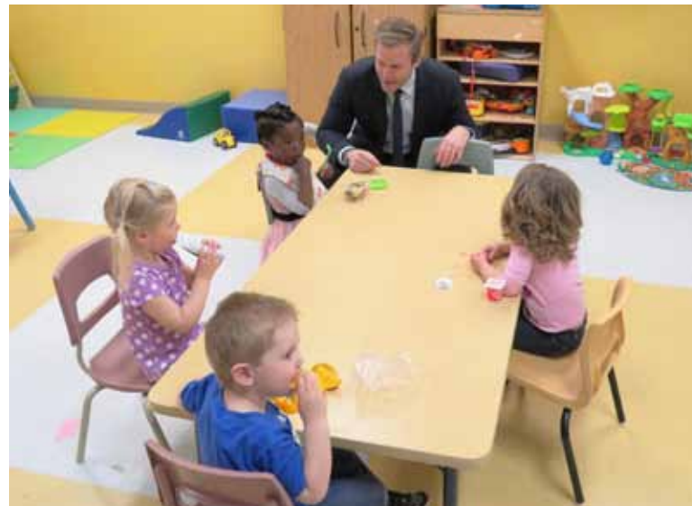
Brian Gallant rendant visite aux tout-petits du nouveau CPE du Centre Samuel-de-Champlain.