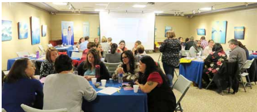
Discussion des représentants d'organismes pour identifier les besoins en santé mentale de la région.