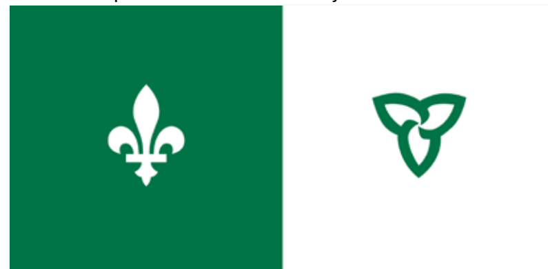
Le drapeau franco-ontarien.

La protection de nos droits linguistiques sera davantage un enjeu en 2019!