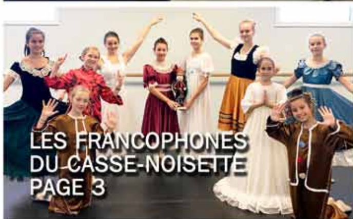
LES FRANCOPHONES DU CASSE-NOISETTE PAGE 3

Le SAINT-JEANNOIS Le journal francophone du Saint-Jean métropolitain