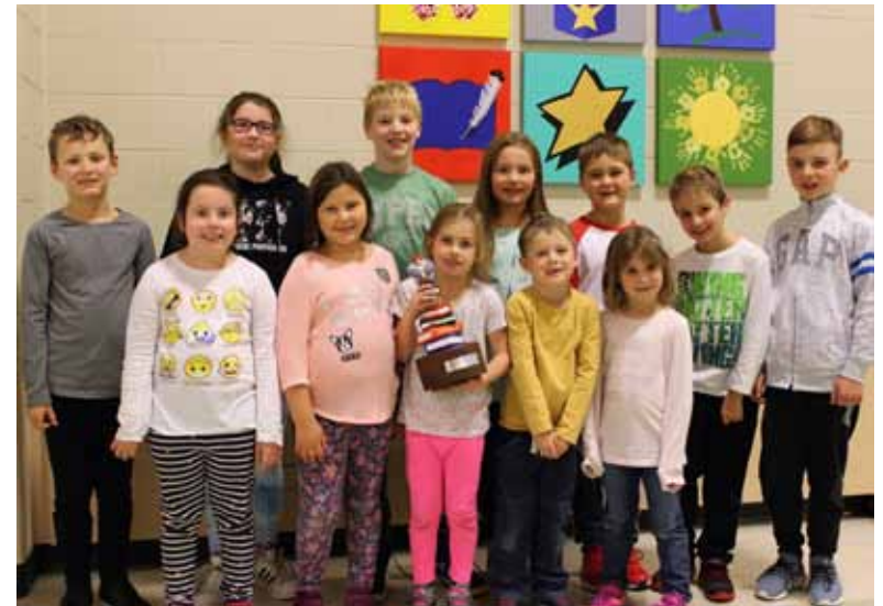
Des jeunes de l'École des Pionniers avec leur prix Cerf-Volant.