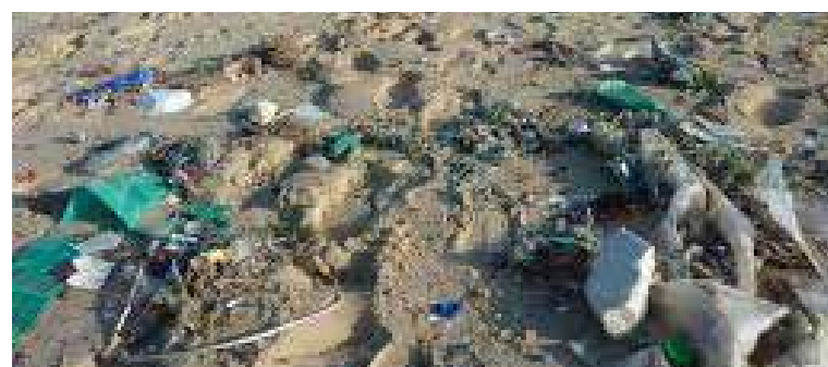
Une plage remplie de déchets rejetés par la mer.

Un petit geste, aussi simple soit-il, aide à nettoyer notre planète et surtout à enseigner aux jeunes à le faire. En plus d'éviter de jeter des déchets le long des routes, faire un peu de conscientisation en