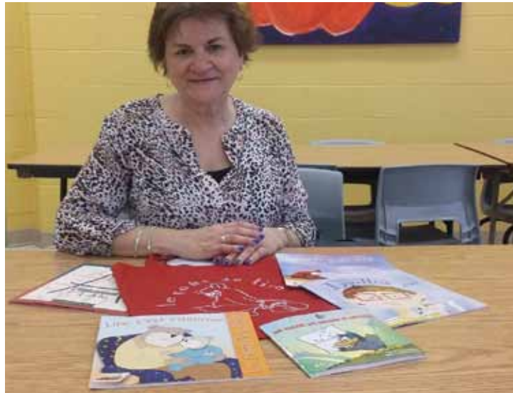
Le goût de lire offre de nombreux livres et guides guidant l'apprentissage de l'enfant.