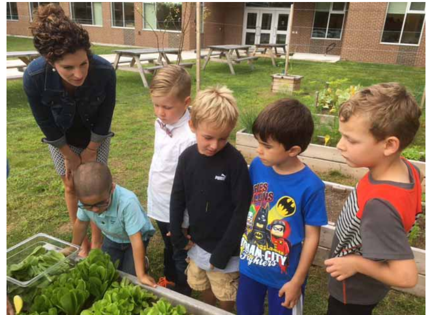
La présence d'un tel jardin à l'école permet aux jeunes d'apprendre de nombreuses choses en dehors des classes.