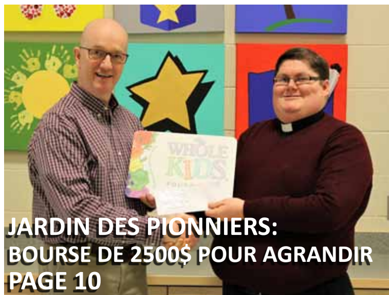
JARDIN DES PIONNIERS: BOURSE DE 2500$ POUR AGRANDIR PAGE 10