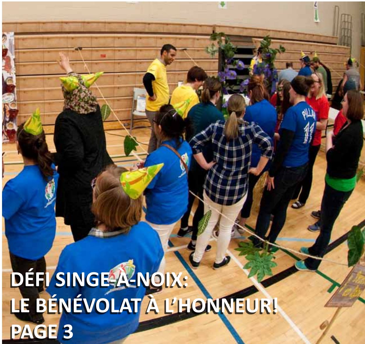
DÉFI SINGE-À-NOIX: LE BÉNÉVOLAT À L'HONNEUR! PAGE 3