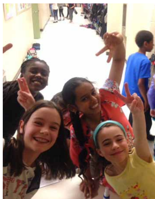
Un grand nombre de filles sont allées auditionner pour décrocher un rôle de soliste pour le spectacle.