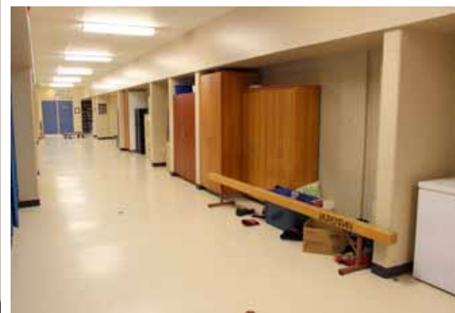
Locaux sous-dimensionnés en guise de bureaux, corridors et salles électriques convertis en endroits d'entreposage: les utilisateurs du Centre scolaire-communautaire Samuel-de-Champlain commencent à être à court d'imagination pour venir à bout du manque d'espace.