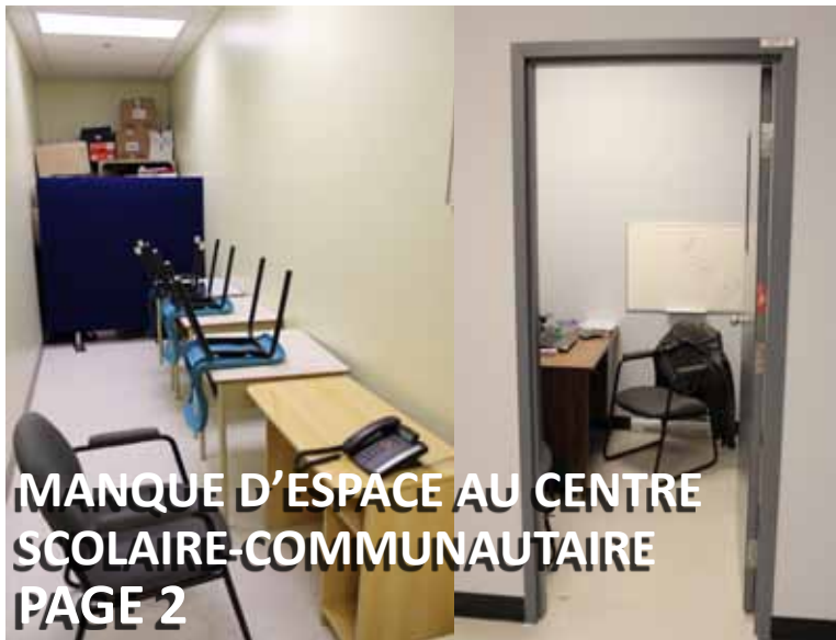
MANQUE D'ESPACE AU CENTRE SCOLAIRE-COMMUNAUTAIRE PAGE 2