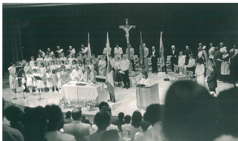
Messe célébrée au Centre communautaire Samuel-de-Champlain.