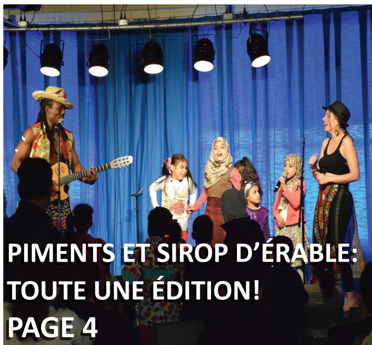
PIMENTS ET SIROP D'ÉRABLE: TOUTE UNE ÉDITION! PAGE 4