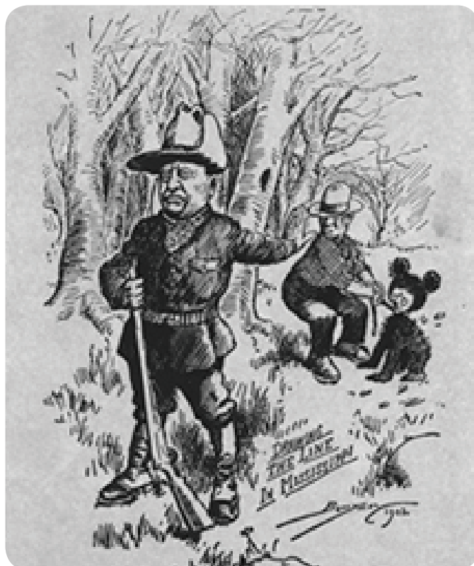
Caricature de Roosevelt refusant d'abattre un ours.