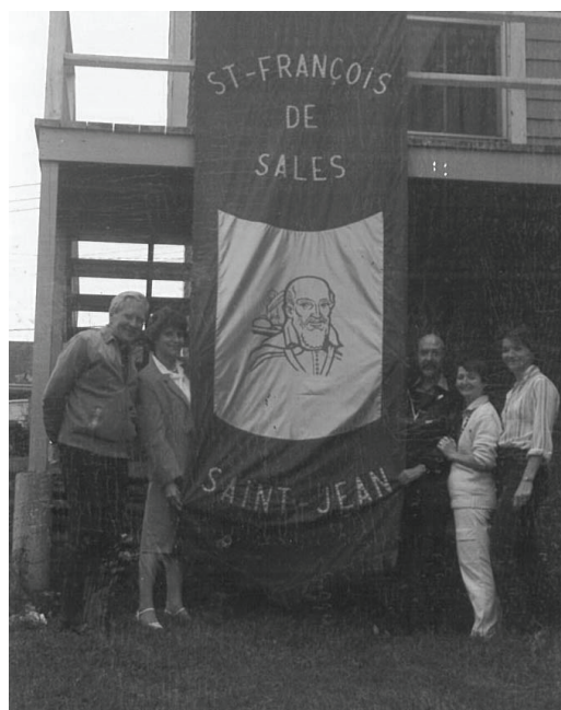
Fondation de la paroisse Saint-François-de-Sales.