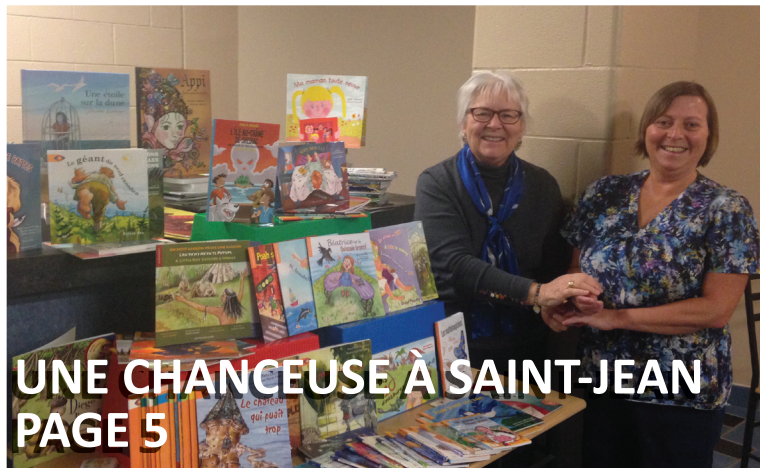
UNE CHANCEUSE À SAINT-JEAN PAGE 5