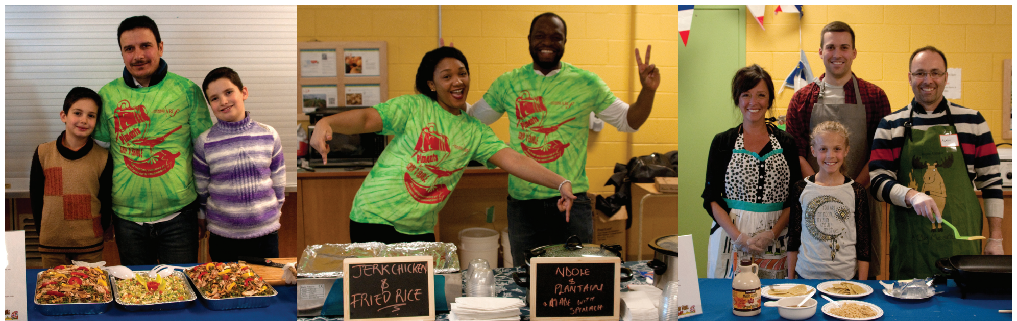
Plusieurs familles ont profité de l'occasion pour faire découvrir des plats typiques de leur culture.