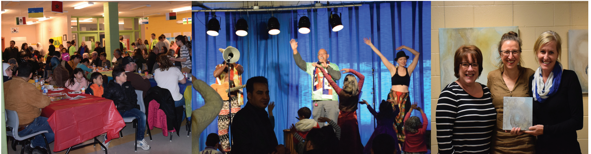
Plats internationaux, performances musicales et arts visuels étaient au menu de cette soirée fantastique.

Le 18 mars dernier a eu lieu la troisième édition de l'événement Piments et sirop d'érable. Plus de 320 personnes ont pris part à cette activité gratuite d'échanges et de partages des cultures au Centre communautaire Samuel-de-Champlain de Saint-Jean. Un tour du monde savoureux avec plus de treize mets délicieux concoctés par des bénévoles en provenance de divers pays. Aussi, de nombreux plats canadiens-français ont été servis au