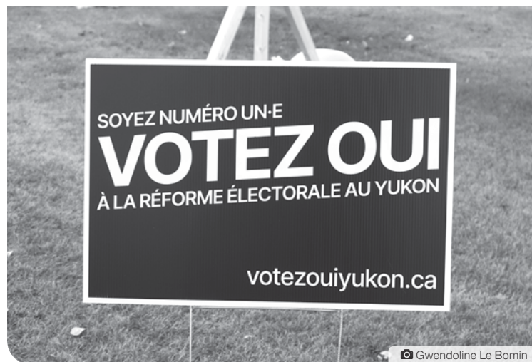
En plus de choisir un-e ou une candidat-e, les électeurs et électrices devront répondre à un plébiscite sur le mode d'élection des membres de l'Assemblée législative du Yukon.

La lecture simple est présentée en collaboration avec le service Formation de l'Association franco-yukonnaise.