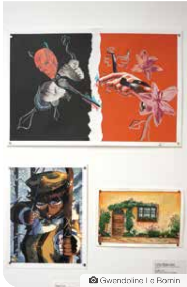
Une exposition d'art jeunesse de tout le territoire a lieu tout au long du mois d'octobre à la galerie Arts Underground. L'exposition est visible jusqu'au 25 octobre. Les artistes, âgé-e-s de 13 à 18 ans, ont été invités à soumettre une œuvre dont elles et ils étaient fiers.