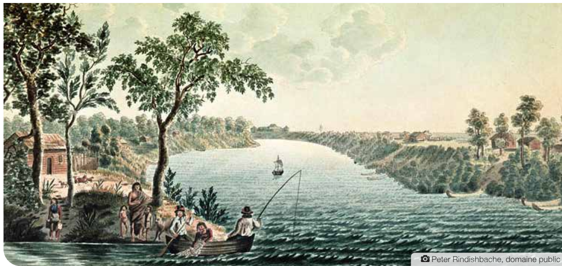
La colonie de la rivière Rouge.