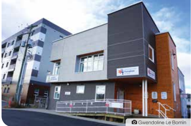
Gwendoline Le Bomin