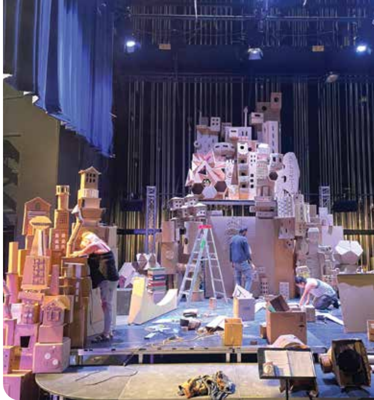
Brian Fidler et le Ramshackle Collective ont créé un spectacle mettant en scène des clowns en carton. Plusieurs représentations ont eu lieu entre le 14 et le 16 octobre au Centre des arts du Yukon.