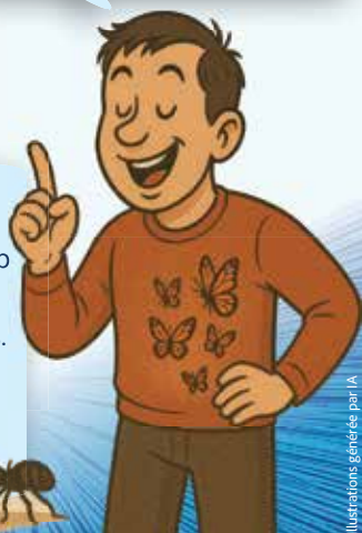
Illustrations générées par IA

Cette capsule linguistique de l'Aurore boréale a été rendue possible grâce à un fonds du Ministère de l'Europe et des Affaires étrangères du gouvernement français.