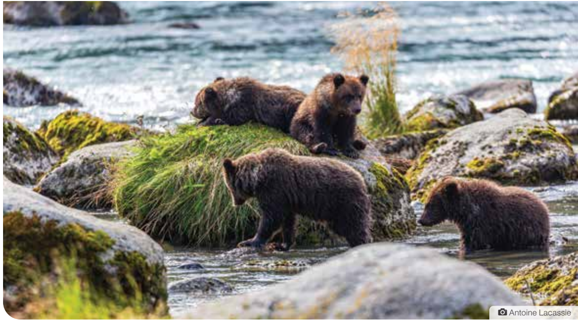
Merci à Antoine Lacassie de nous avoir partagé un de ses clichés des quatre ours grizzlis qui vivent avec leur maman aux abords du lac Chilkoot, à Haines, en Alaska.