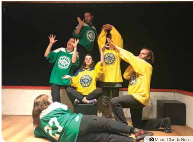
Le 16 octobre dernier, le public était au rendez-vous au Centre de la francophonie pour assister au premier match d'improvisation de la saison de la FIN. Les Verts ont remporté cette première rencontre.