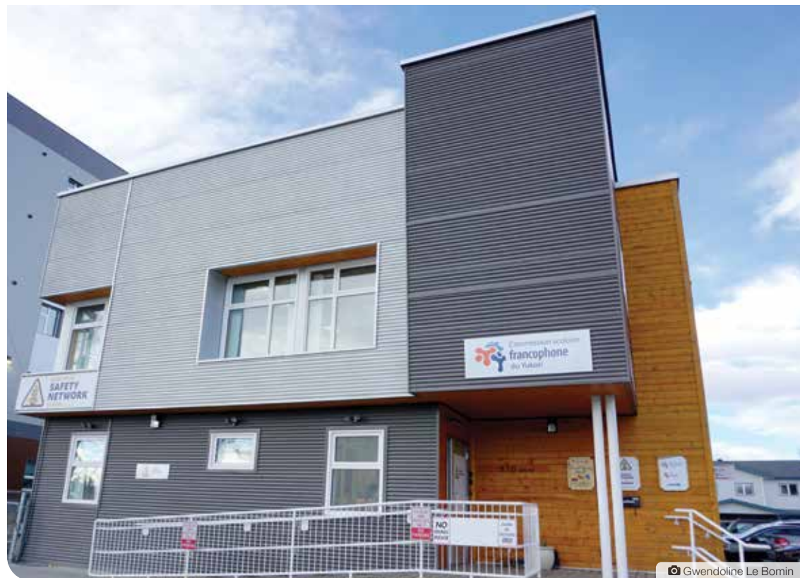
La nouvelle garderie ouvrira ses portes dans le même bâtiment qu'occupe déjà la CSFY.

Bien qu'initialement la CSFY ait souhaité que cette nouvelle garderie ouvre au centre-ville, M. Blais estime finalement que ce quartier présente un fort potentiel. «Les gens qui viennent du nord de la ville et du quartier de Whistle Bend,