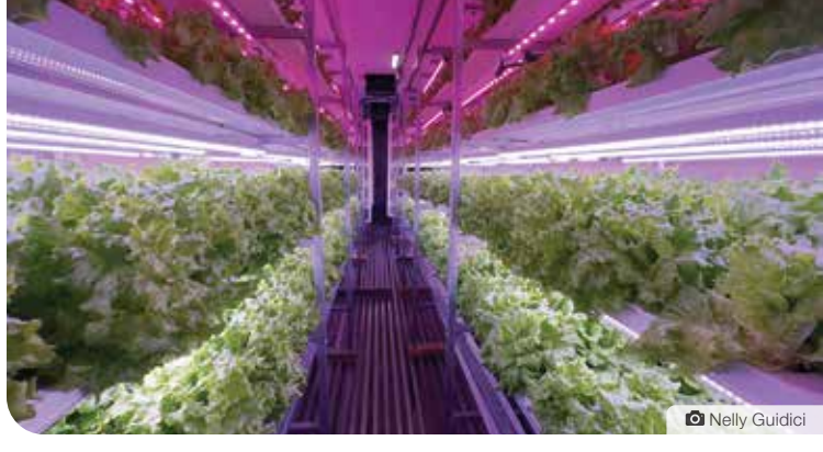
La ferme hydroponique, appelée Ag1054, est un projet d'agriculture nordique au bord du lac Kluane au Yukon.

Lorsque ce projet a débuté, l'expérimentation était le moteur principal. «C'était un essai pour plusieurs raisons, afin de comprendre dans quelle mesure il serait possible de cultiver des légumes dans une unité comme celle-ci, hors réseau. Comme il faut produire notre propre