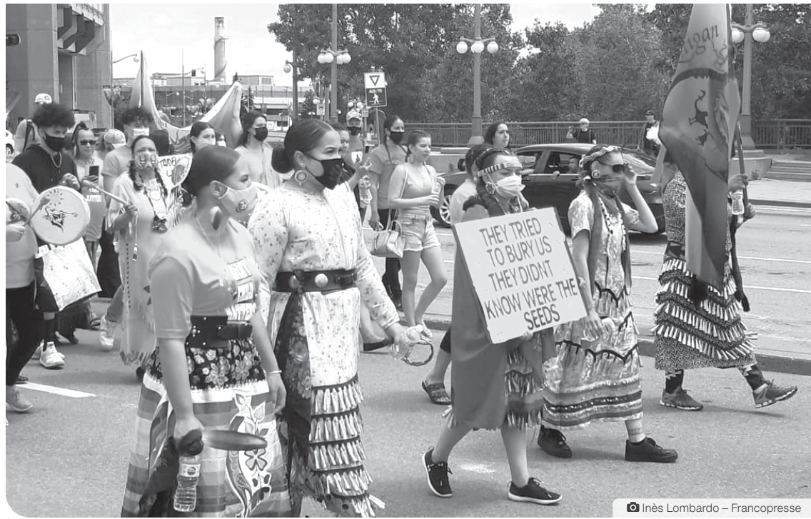
Les traumatismes n'ont pas pris fin avec le dépôt du rapport de la Commission vérité et réconciliation. En 2021, la découverte de sépultures anonymes sur les terrains de pensionnats autochtones a bouleversé la population canadienne et donné du poids à l'utilisation du mot « génocide. »

L'Association internationale est arrivée à cette conclusion après une accélération du rythme et une augmentation de la sévérité des attaques de l'État d'Israël contre la population civile palestinienne depuis 2023.