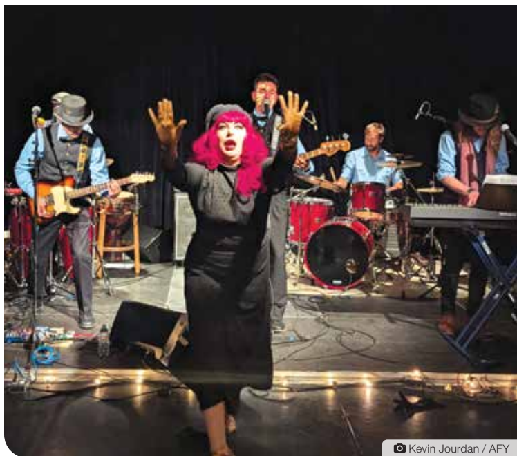
Kevin Jourdan / AFY