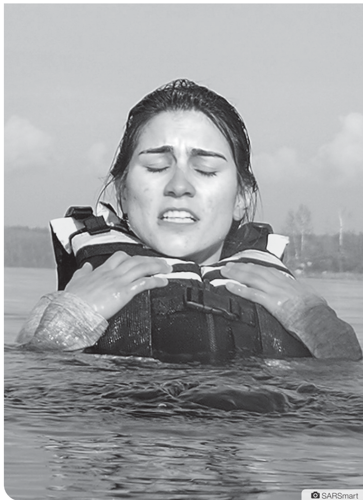
L'activité d'immersion dans les eaux froides permet de tester ses réflexes et d'apprendre les bons gestes.

Articles de l'Arctique est une collaboration des cinq médias francophones des trois territoires canadiens : les journaux L'Aiglon, L'Aurore boréale et Le Nunavoix, ainsi que les radios CFRT et Radio Taïga.