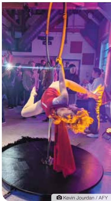
Kevin Jourdan / AFY