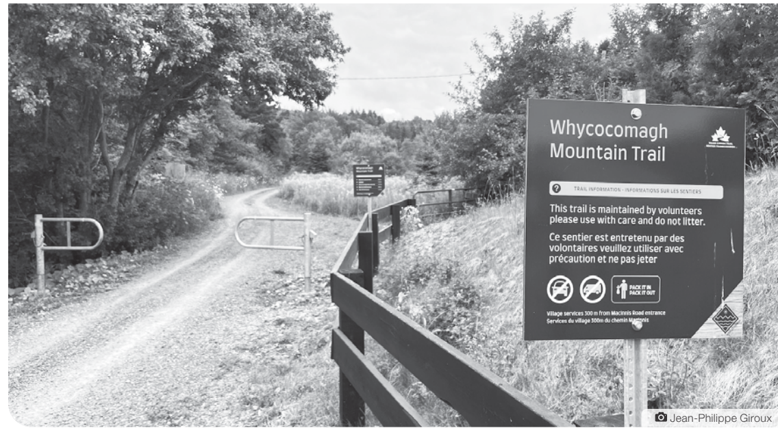
Le Sentier à Whycocomagh, en Nouvelle-Écosse.

« Le Sentier permet de voir l'immensité du pays, qui est grand et petit à la fois. C'est faisable de