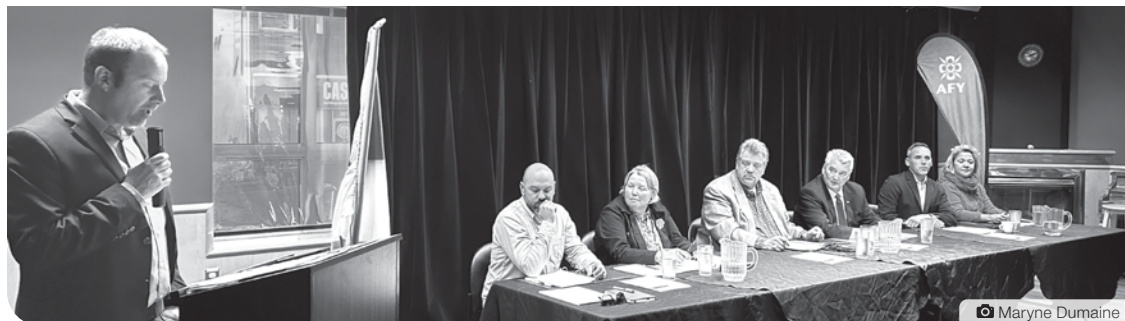
Le forum avait lieu dans la salle communautaire du Centre de la francophonie.