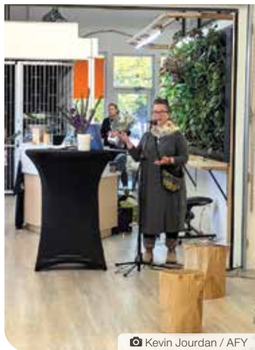
Kevin Jourdan / AFY