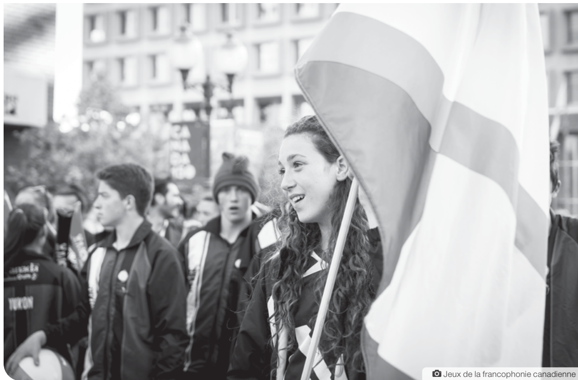
Les derniers Jeux de la francophonie canadienne se sont déroulés à Moncton-Dieppe au Nouveau-Brunswick en 2017.

Avec neuf jeunes sélectionnés cette année, l'équipe du Nunavut est la plus grande jamais constituée à se présenter aux Jeux. L'équipe par-