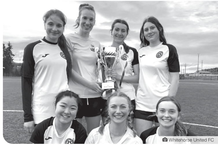
Whitehorse United FC

Les U17 de Whitehorse United ont remporté leur premier tournoi de Sevens avec un but en or dans le temps additionnel de la finale, 2-1 contre l'équipe Green. Bravo!