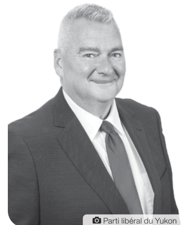
Parti libéral du Yukon