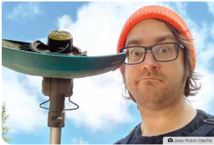
Plywood Joe était de passage à Whitehorse le 23 juin au Solstice Saint-Jean, organisé par l'Association franco-yukonnaise, puis à Yellowknife le 25 juin, pour présenter son projet Plywood Joe qui met en musique le quotidien d'un charpentier.

« Ça rend hommage aussi au domaine ouvrier que j'essaie de comprendre », ajoute-t-il. « Plusieurs le valorisent, mais ce projet le met vraiment de l'avant-plan, parce que je raconte vraiment de tout et de rien qui se passent dans ma communauté d'un côté campagnard. Et c'est un peu drôle aussi, parce que