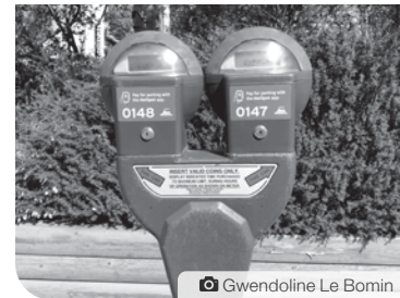
Gwendoline Le Bomin

L'amende pour défaut d'affichage d'un permis de stationnement sera de 75 $.