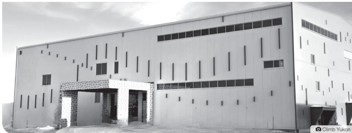
Le bâtiment qui accueillera les installations de Climb Yukon et du club de gymnastique Polarettes est en construction sur la voie Goddard de Whistle Bend.

Aujourd'hui, il n'existe pas d'option pour grimper en hauteur à l'intérieur