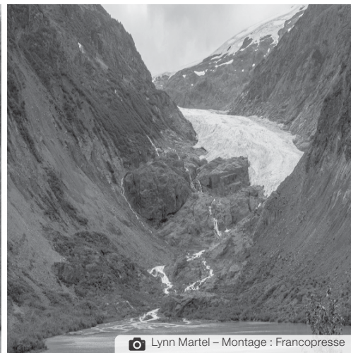
Le glacier Bear, en Alaska, le 22 septembre 2014, le 22 juin 2020 et le 28 août 2024. Selon le gouvernement américain, ce glacier a perdu 12,5 millions de pieds carrés de glace à son extrémité entre 2018 et 2019.

Athabasca, dans les Rocheuses, ont tous les deux perdu entre 6 et 7 mètres.