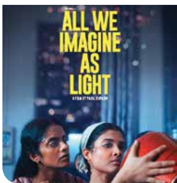
All We Imagine as Light est un long métrage indien remarqué à la fois à Cannes et au TIFF en 2024. Le film sera présenté le 16 février au Centre des arts du Yukon.

Tout au long du festival, les gens de l'industrie sont conviés à venir réseauter, parfaire leurs talents, et les montrer afin de décrocher l'une des bourses offertes. Un événement de type pitch aura lieu le 9 février. M. Bosc compte y présenter un projet. « J'ai envoyé mon dossier, avec un court métrage que je suis en train d'écrire autour de la thématique de ma vie d'expatrié au Yukon, avec aussi ce que j'ai vécu