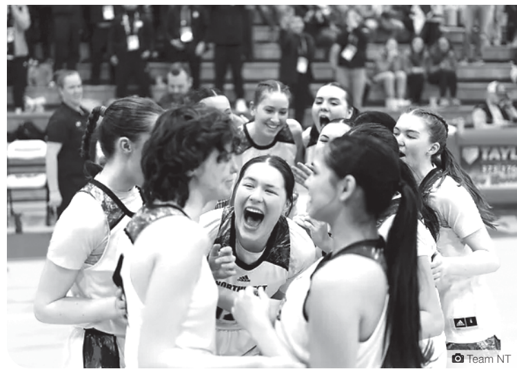
Jeux d'hiver de l'Arctique en Alaska.

Le 20 janvier 2025, Donald Trump a été investi 47 e président des États-Unis. Quelques heures après la victoire du candidat républicain, ouvertement favorable aux industries de l'énergie fossile, l'administration Biden a mis de l'avant une loi limitant le forage dans la réserve faunique nationale de l'Arctique en Alaska à 400 000 acres. Située au nord-est de l'Alaska, cette réserve englobe une partie de la plaine côtière arctique de l'ouest et abrite la harde de caribous de la Porcupine (218 000 têtes) lors de la période de mise bas et de post-mise bas. Les Gwich'in de l'Alaska, du Yukon et des T.N.-O., se sont unis depuis 30 ans afin qu'une protection définitive de cette zone soit déclarée. Avec l'arrivée de Donald Trump au pouvoir,