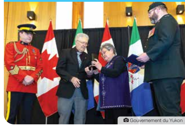
Gouvernement du Yukon