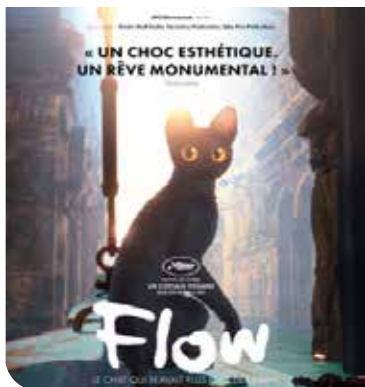
Flow ; le chat qui n'a pas peur de l'eau est un film d'animation muet. Présenté le 9 février au Centre des arts du Yukon.

De même, le film Bergers de Sophie Deraspe sera présenté en version originale française, avec sous-titres en anglais. Cette production franco-qubécoise a notamment reçu le prix du meilleur long métrage canadien au dernier