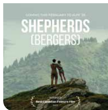
Le film Bergers sera présenté en français le 12 février au Centre des arts du Yukon.

Certaines projections seront présentées avec sous-titres en français dans cette édition du ALFF, dont le documentaire de Old Crow a Philosophy le 10 février.