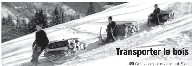
Transporter le bois