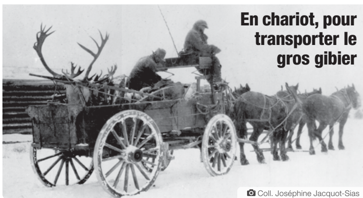
En chariot, pour transporter le gros gibier