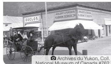
Archives du Yukon, Coll. National Museum of Canada #762