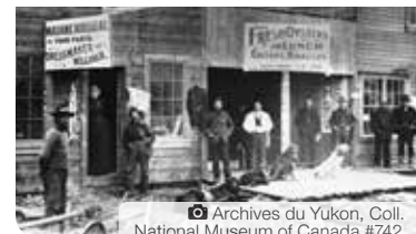
Archives du Yukon, Coll. National Museum of Canada #742