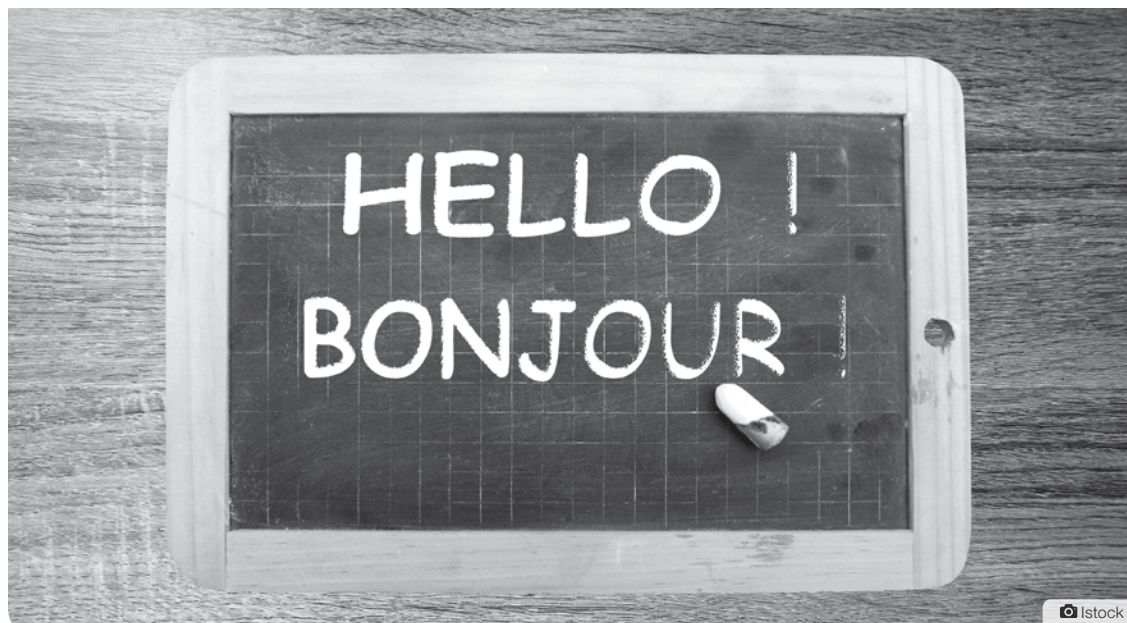
Environ un million de postes en entreprises privées exigent d'être bilingue au Canada.

plus de 20 % dans cette catégorie, seuls le Yukon (27,2 %) et le Nunavut (28,6 %) sont au-dessus de la moyenne nationale de 22,8 % (hors Québec et Nouveau-Brunswick).