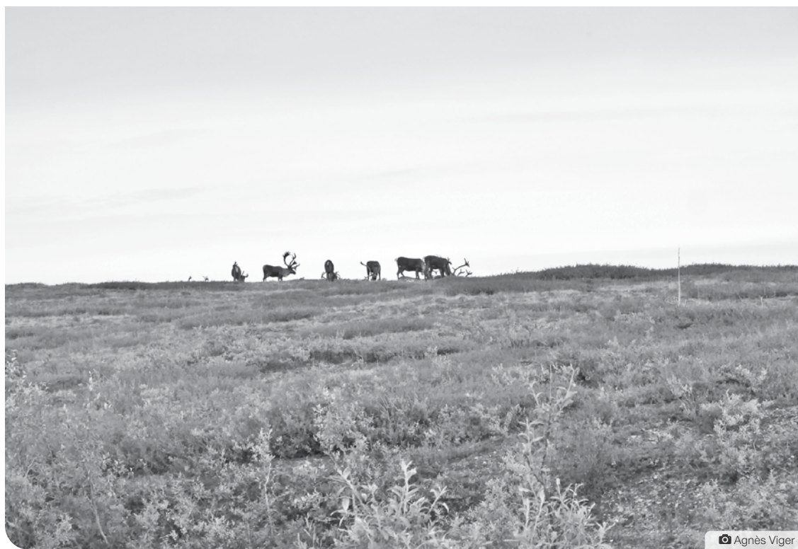
Les caribous sont vus comme des frères par les Gwitchins, et le respect et l'ouverture d'esprit sur le sujet de la chasse et des moyens traditionnels de subsistance sont attendus de la part des personnes en visite au territoire.