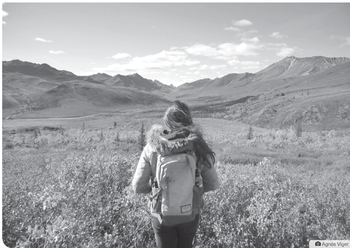
Garder les terres et l'eau propres est attendu des voyageurs visitant les territoires traditionnels des Premières Nations yukonnaises.

Ces enseignements ancestraux ont pour but d'aider à éduquer tout le monde : personnes en visite, population yukonnaise et prestataires de services touristiques. « Il s'agit d'un modèle de relation fondé sur le soin et le partage. Nous voulons nous assurer que ceux qui