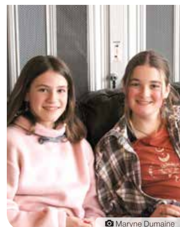
Il n'y a pas d'âge pour être bénévole!

Cette année, c'est la Fabrique d'improvisation du Nord qui a remporté le Prix bénévole remis par l'AFY. Toute l'équipe qui fait et qui organise les spectacles d'impro les jeudis est composée de personnes bénévoles. Ces gens ne sont pas payés pour faire rire le public, ni pour mettre la musique ou vendre des boissons.