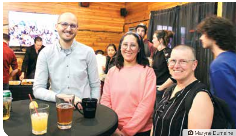
Le bénévolat est une bonne façon de rencontrer des gens et de créer des liens sociaux en arrivant au Yukon.