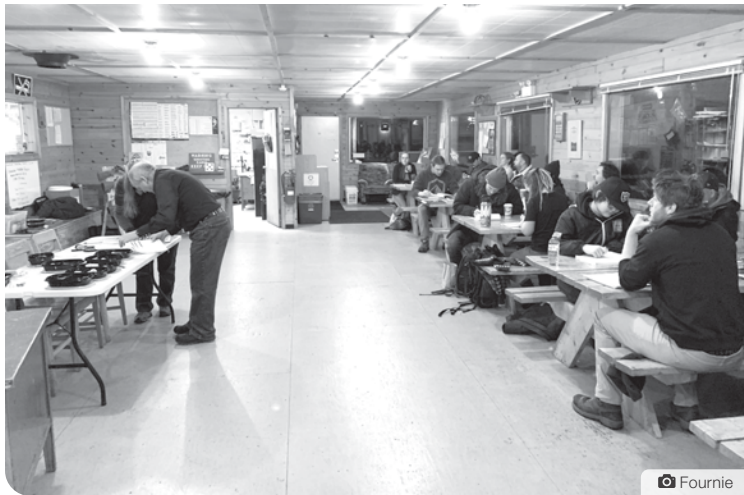
Au Yukon, les propriétaires légitimes d'armes à feu doivent entre autres suivre une formation de deux jours et passer un examen avant l'obtention d'un permis de chasse.

Le ministre fédéral de la Sécurité publique, Marco Mendicino, était de passage au Yukon à la mi-janvier et il a saisi cette occasion pour s'entretenir avec plusieurs groupes de chasse du territoire. Deux semaines après sa visite, il a annoncé sur Twitter le retrait de deux amendements qui étaient au cœur des préoccupations des communautés rurales du Canada : « comme nous l'avons dit à maintes reprises, l'intention du gouvernement est de se concentrer sur les AR-15 et autres armes d'assaut, et non sur les armes couramment utilisées pour la chasse ».