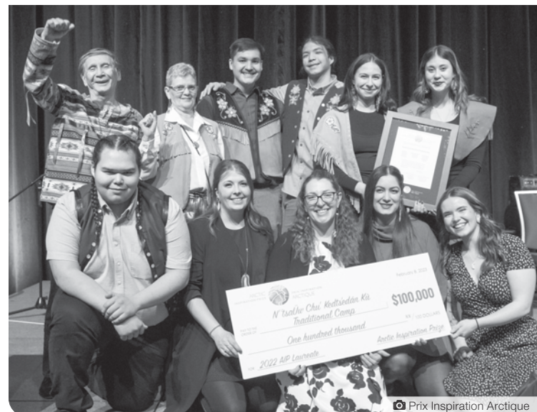
Au Yukon, le camp traditionnel N'tsa'ŭ Chu' Kedts'edán Kù, à l'initiative de la Commission Scolaire des Premières Nations du Yukon, sera construit sur le campus de l'école secondaire Porter Creek à Whitehorse.