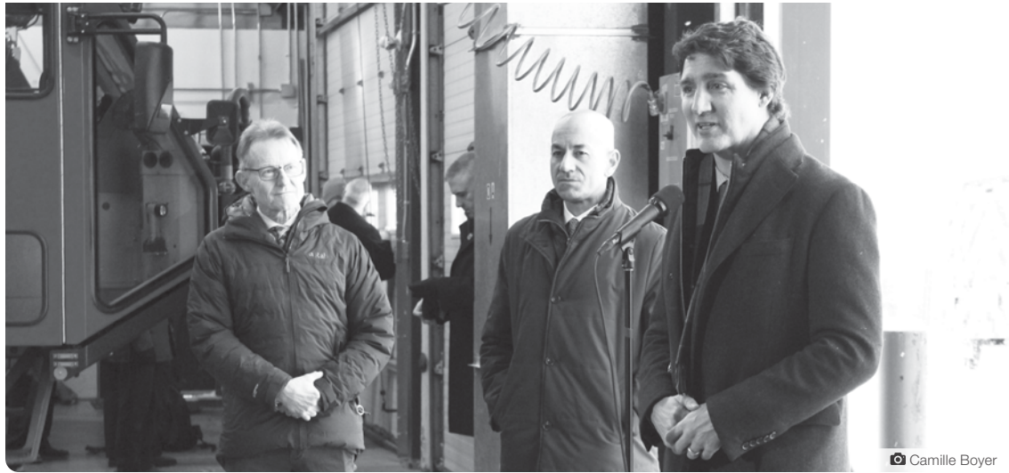
Justin Trudeau répond aux questions de la presse lors de son passage au Yukon.

Ce sont des missiles américains qui ont abattu l'objet en question au-dessus du Yukon, le 11 février, sous le Commandement de la défense aérospatiale de l'Amérique du Nord (NORAD). NORAD est une organisation conjointe entre les États-Unis et le Canada chargée du contrôle aérospatial, d'alertes aérospatiales, et d'alertes maritimes de l'Amérique du Nord.