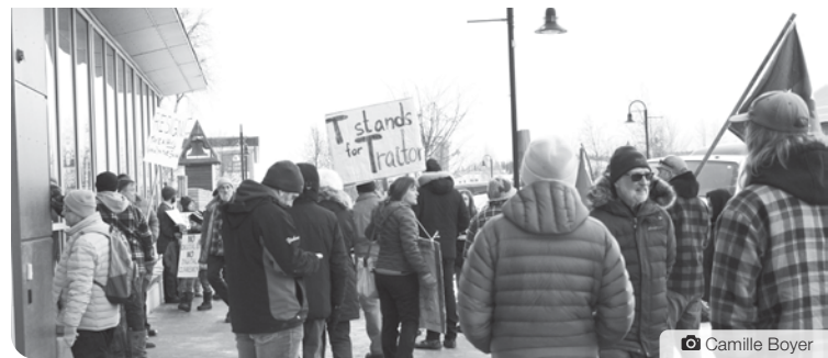
Quelques manifestant-e-s se tenaient à l'entrée du musée MacBride lors du souper-bénéfice auquel Justin Trudeau a assisté le dimanche 12 février.

Pendant sa visite, Justin Trudeau a également tenu des conversations sur la santé, les infrastructures, les changements climatiques et la croissance économique avec différents groupes yukonnais.