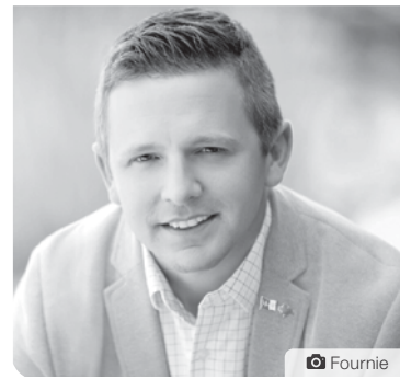
Le libéral Francis Drouin a lissé son discours après avoir fustigé ses collègues anglophones du Québec sur Twitter cette semaine.

communautés ne sont pas laissées en arrière. Je respecte tous mes collègues et la façon dont ils défendent leurs communautés. Moi, mon intérêt est qu'on passe rapidement cette loi. »