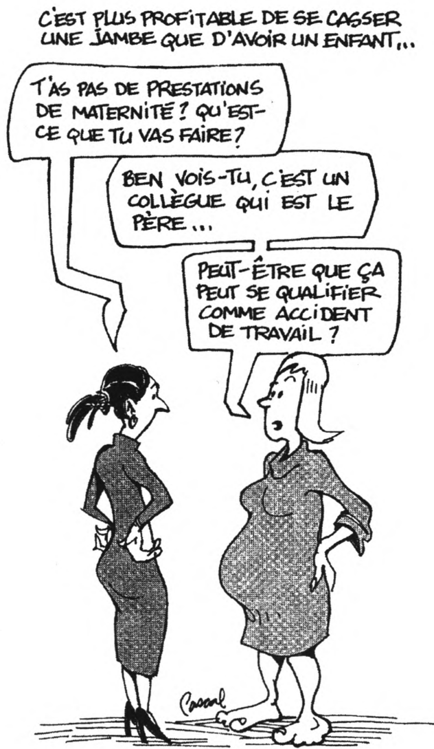
Tiré du livre Femmes et famille de la collection La Gazette des femmes, publié par le gouvernement du Québec. 1999.