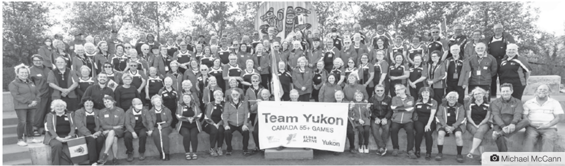
Cette année, Équipe Yukon a envoyé un nombre record d'athlètes à Kamloops, en Colombie-Britannique.

« Je perds mes partenaires de tennis avec les années qui passent. Ils se tournent vers le pickleball, alors je m'y suis mis aussi. C'est plus doux, mais tout aussi intéressant que le tennis. Il