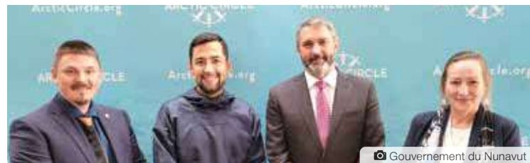
Gouvernement du Nunavut

Quelques jours avant le forum, la compagnie torontoise Neo Performance Materials annonçait d'ailleurs la signature d'une entente pour une exploitation des terres rares du Groenland. « Le projet