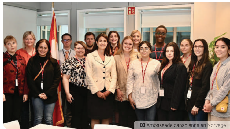
Ambassade canadienne en Norvège