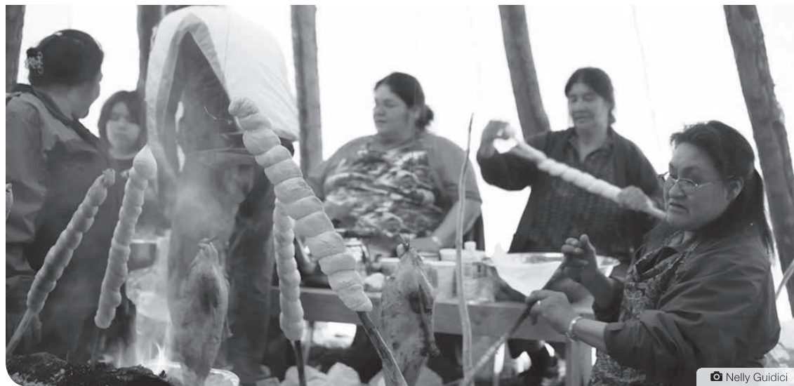
Les cas de transmission du virus à l'homme sont rares, mais il est recommandé de respecter certaines règles pour éviter les risques de contamination humaine par une cuisson à 70 degrés Celsius de la viande.

« La grippe aviaire est une préoccupation au Nunavut, car de nombreux Nunavummiuts chassent les oiseaux sauvages et ramassent des œufs sauvages qui font partie