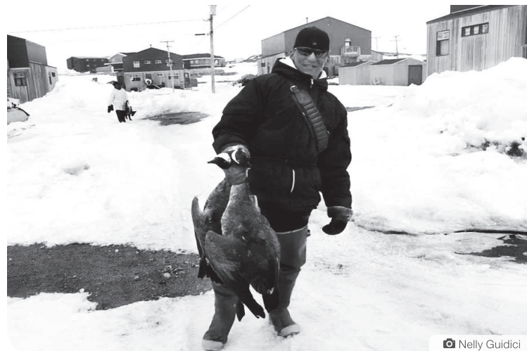
Dans le territoire cri de la Baie-James au Québec, la chasse à la bernache est une période culturelle très importante pour les familles qui se retrouvent dans leurs camps au printemps lors du retour des oies.

Une collaboration des cinq médias francophones des trois territoires canadiens : les journaux L'Aquilon, L'Aurore boréale et Le Nunavoix, ainsi que les radios CFRT et Radio Taïga.