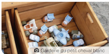
Garderie du petit cheval blanc