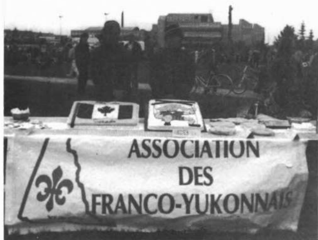
Les traditionnels gâteaux-anniversaire ont régalé près de 300 personnes

Un gros merci au secrétariat d'état qui, au travers du comité de la Fête du Canada territorial, a subventionné cette journée nationale.