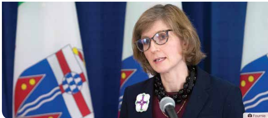
En octobre 2021, les autorités yukonnaises ont élargi le programme d'approvisionnement sûr en opioïdes. Ceux-ci sont prescrits par un médecin et visent à prévenir les surdoses.