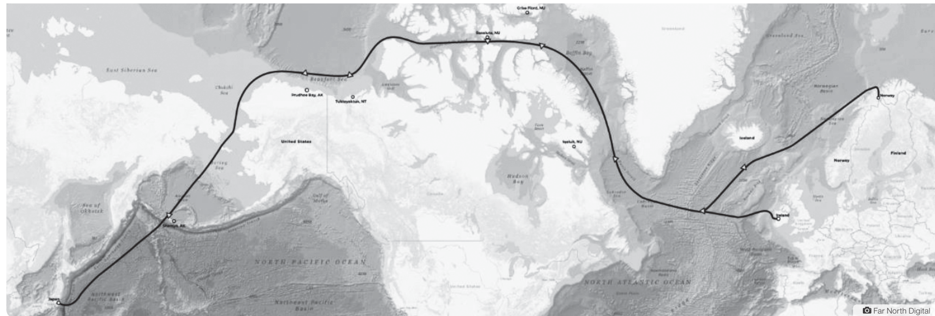
Un projet international de fibre optique sous-marine vise à relier le Japon à l'Europe en passant par le passage du Nord-Ouest. Plusieurs collectivités du Nunavut et des Territoires du Nord-Ouest pourraient bénéficier d'une connexion à Internet à haut débit d'ici la fin de l'année 2025.

L'organisme Far North Digital-True North Global Networks, basé à Anchorage en Alaska, a annoncé son intention de construire un système de câbles à fibre optique qui permettra de relier l'Asie à l'Europe en passant par l'Arctique. Ce projet international, en partenariat avec l'entreprise finlandaise Cinia, devrait être terminé à la fin de l'année 2025. 16 500 kilomètres de câbles sous-marins devraient transiter à travers le passage du Nord-Ouest pour un coût total de 1,48 milliard $.