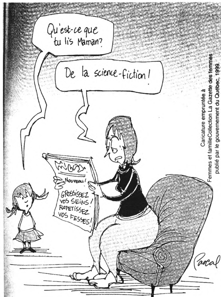
Caricature empruntée à Femmes et famille Collection La Gazette des femmes publié par le gouvernement du Québec, 1999.