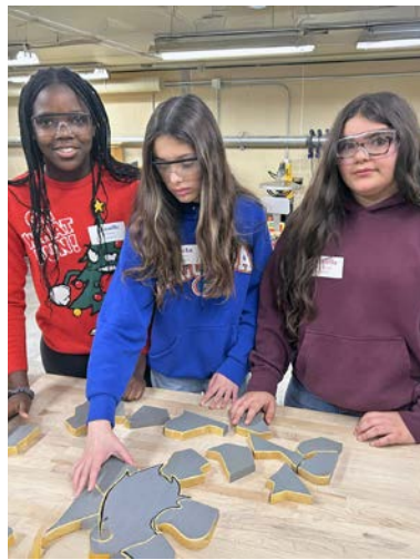
Des élèves de 8 e année décorent des biscuits préparés par les élèves du secondaire inscrits dans les cours d'Hôtellerie et Nutrition.

Les 4 et 5 décembre, les Griffons de l'ÉS du Sacré-Cœur ont eu le plaisir d'accueillir les élèves de la 8 e année provenant de 10 écoles élémentaires de la région du Grand Sudbury, St-Charles, Warren et Noëlville. Ces deux journées remplies de découvertes, d'apprentissage et de plaisir ont permis aux élèves d'en apprendre davantage sur les programmes et les cours offerts de la 9 e à la 12 e année ainsi que la vie scolaire à Sacré-Cœur. Au programme : exploration du laboratoire de santé, simulation réaliste avec un mannequin médical de haute technologie, expé-