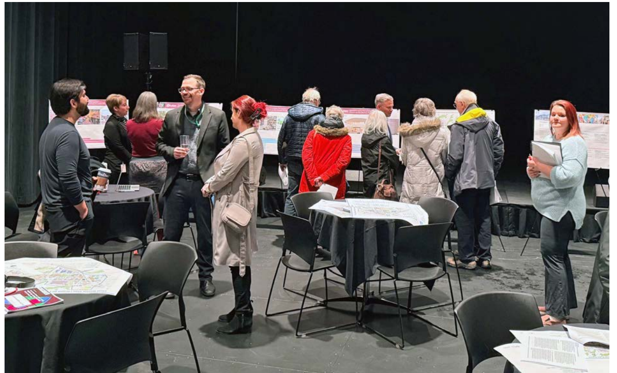
Le dévoilement aux citoyens de la dernière mouture du Plan directeur du centre-ville.

Parmi les changements proposés au Plan directeur, notons l'adoption d'un nouvel énoncé de vision pour le centre-ville, qui se lit comme suit: «Le centre-ville de Sudbury est le cœur dynamique du Nord de l'Ontario; il a un esprit accueillant, une économie dynamique et un milieu urbain interconnecté. Cet énoncé veut offrir une orientation pour les projets d'aménagement futurs et reflète mieux les priorités des entreprises ainsi que des résidentes et des résidents de la Ville du Grand Sudbury».