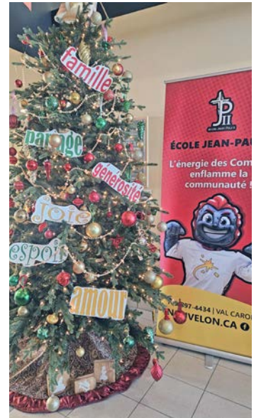
L'arbre de Noël de l'école Jean-Paul II rayonne et sème les valeurs catholiques.

En tant que communauté unie, les familles de Jean-Paul II ont prouvé qu'il est possible de semer l'espoir et de partager l'esprit de Noël avec ceux qui en ont le plus besoin. Merci de faire de notre communauté un endroit où la bienveillance brille de mille feux!