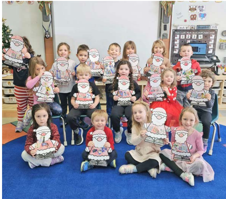
Les élèves de la classe de maternelle A sont impatients d'aller poster leurs lettres au Père Noël.