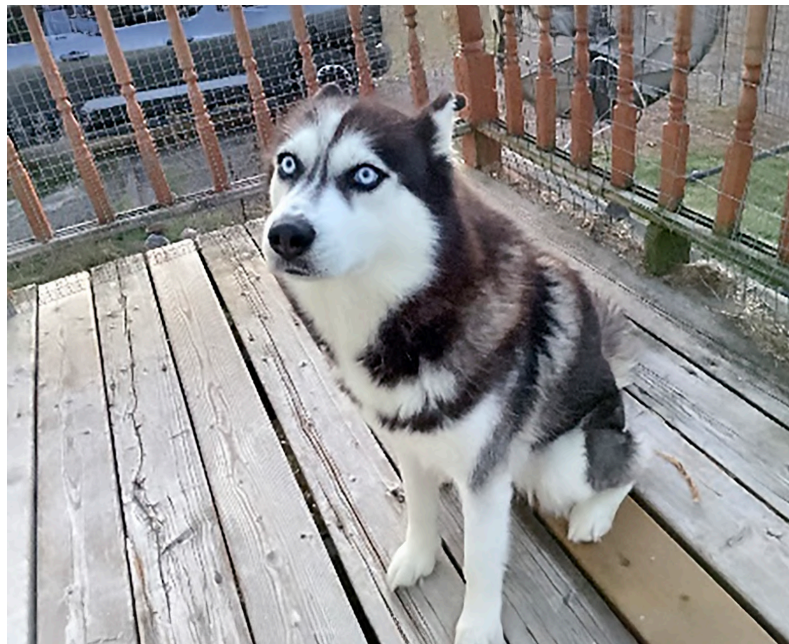
Skyler, le Husky Sibérien.

L es huskies sont très énergétiques. Est-ce que tu connais tout ce qu'il y a à savoir à propos des huskies? Sinon, voici des informations sur leurs origines, leurs caractéristiques physiques et mentales, ainsi que leurs besoins.