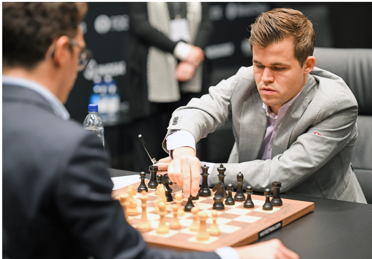
Magnus Carlsen.

Magnus a attiré l'attention du monde des échecs par ses nombreuses victoires comme celle du tournoi C du tournoi de Wijk aan Zee en janvier 2004, à l'âge de treize ans, puis cette même année a atteint le titre le plus prestigieux du monde des échecs, le titre de grand maître. Magnus devint premier mondial à seulement 19 ans et un mois, qui le fera le plus jeune joueur à atteindre le numéro un au classement.