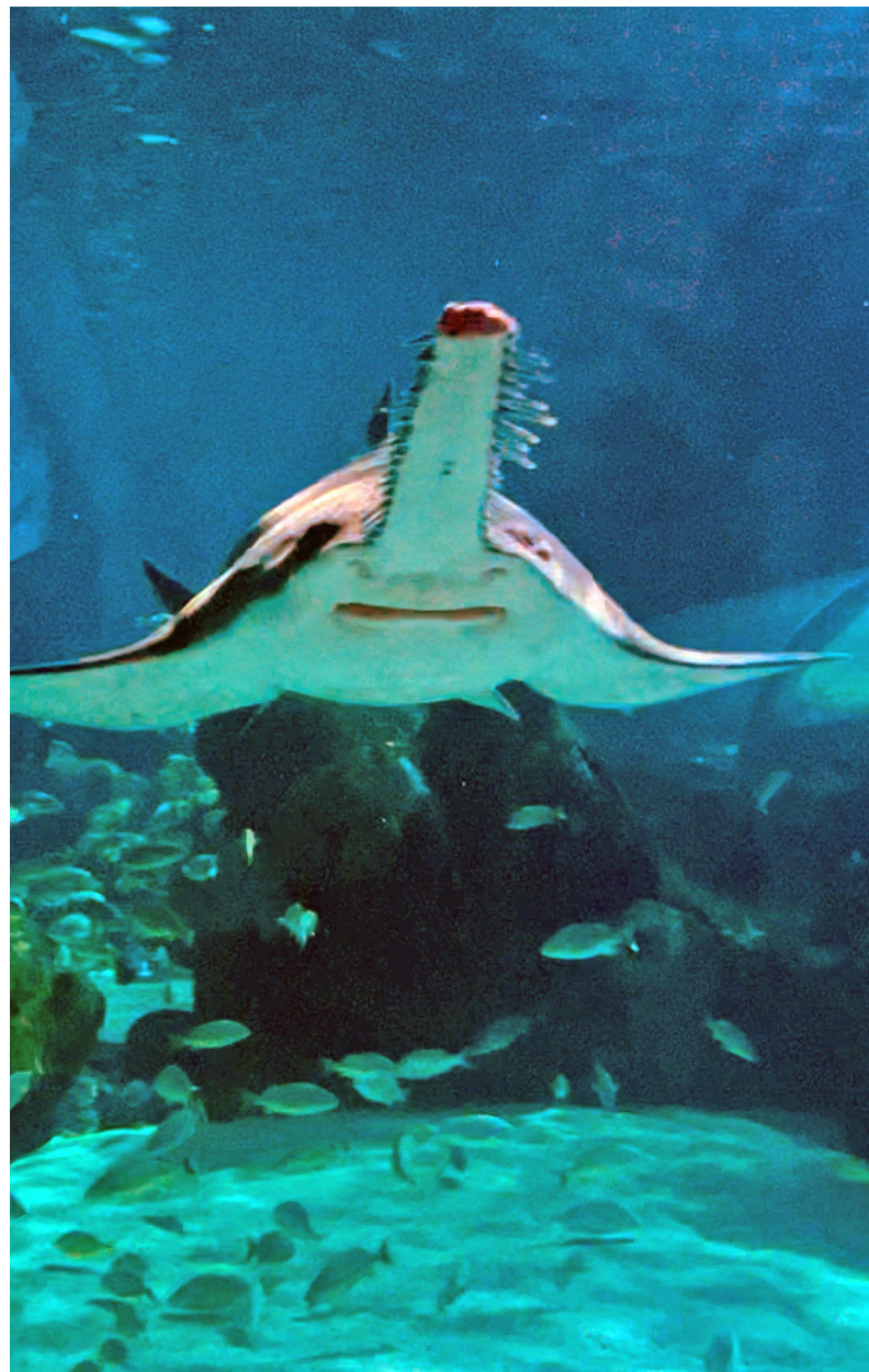
Photos prises par Emma Gingras lors d'un voyage à l'aquarium Ripley's.

En conclusion, le poisson-scie est une espèce très différente des autres. C'est un poisson très intéressant avec plusieurs traits uniques. Mais, ce poisson a un gros risque d'extinction comme il l'a déjà été dans plusieurs pays.