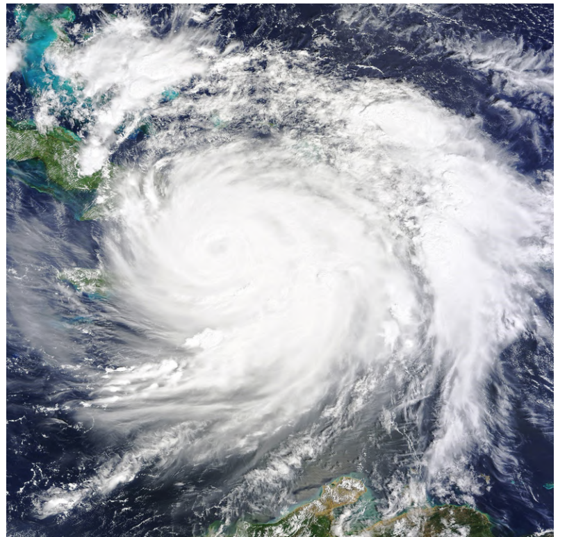
Scènes de l'ouragan Melissa.

Les scientifiques s'améliorent dans l'analyse des effets des changements climatiques sur les phénomènes météorologiques extrêmes, comme les sécheresses, les inondations et les ouragans. Il existe plusieurs organisations qui effectuent leurs propres analyses, y compris Environnement et Changement climatique Canada. Melissa s'est renforcée de façon très significative au cours de cette même période, ce qui en fait un cas de ce que certains appellent une