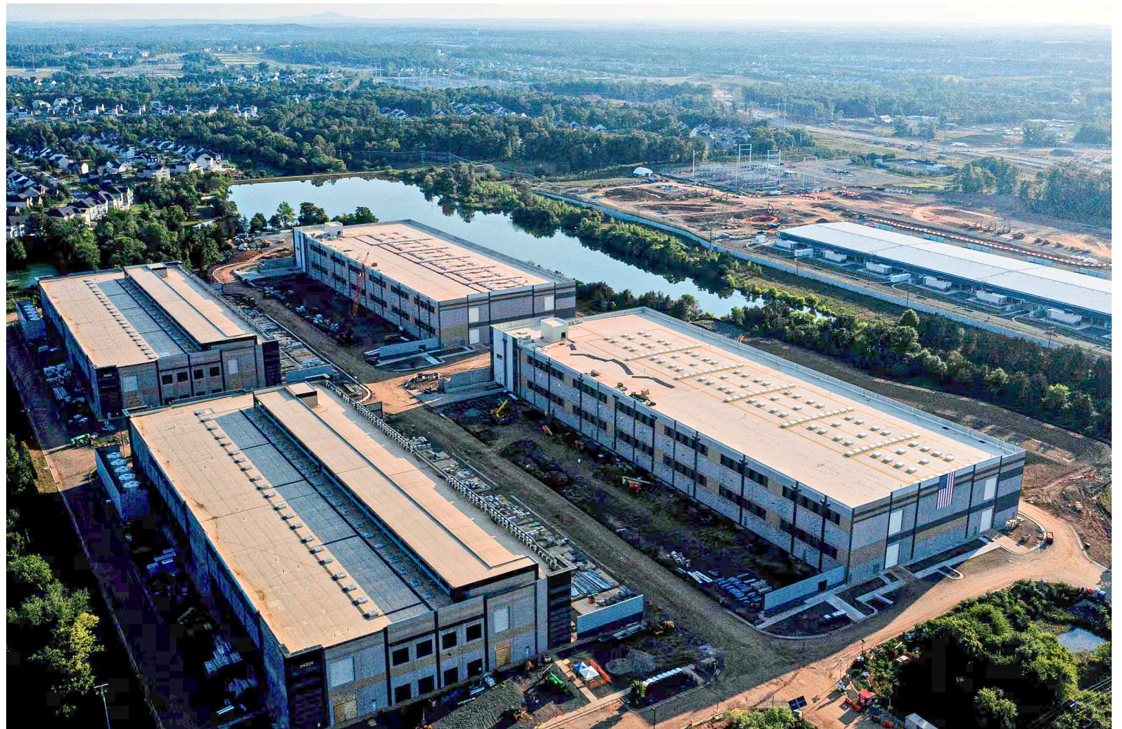
Photographe: Nathan Howard (Getty Images). Un centre de données pour l'IA en Stoneridge, Virginia.

On s'attend à ce que tous ces problèmes environnementaux s'intensifient dans les prochaines années. Cependant, on