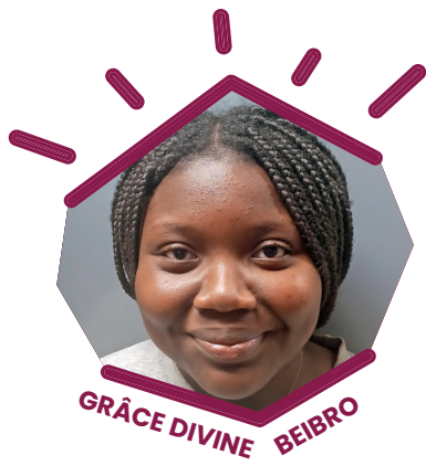
GRÂCE DIVINE BEIBRO

C ette Halloween, l'école Macdonald-Cartier s'est transformée en un véritable royaume de frissons et de rires. Entre costumes colorés, surprises inattendues et rires partagés avec mes amis, j'ai vécu une journée où l'enchantement a pris vie sous mes yeux.