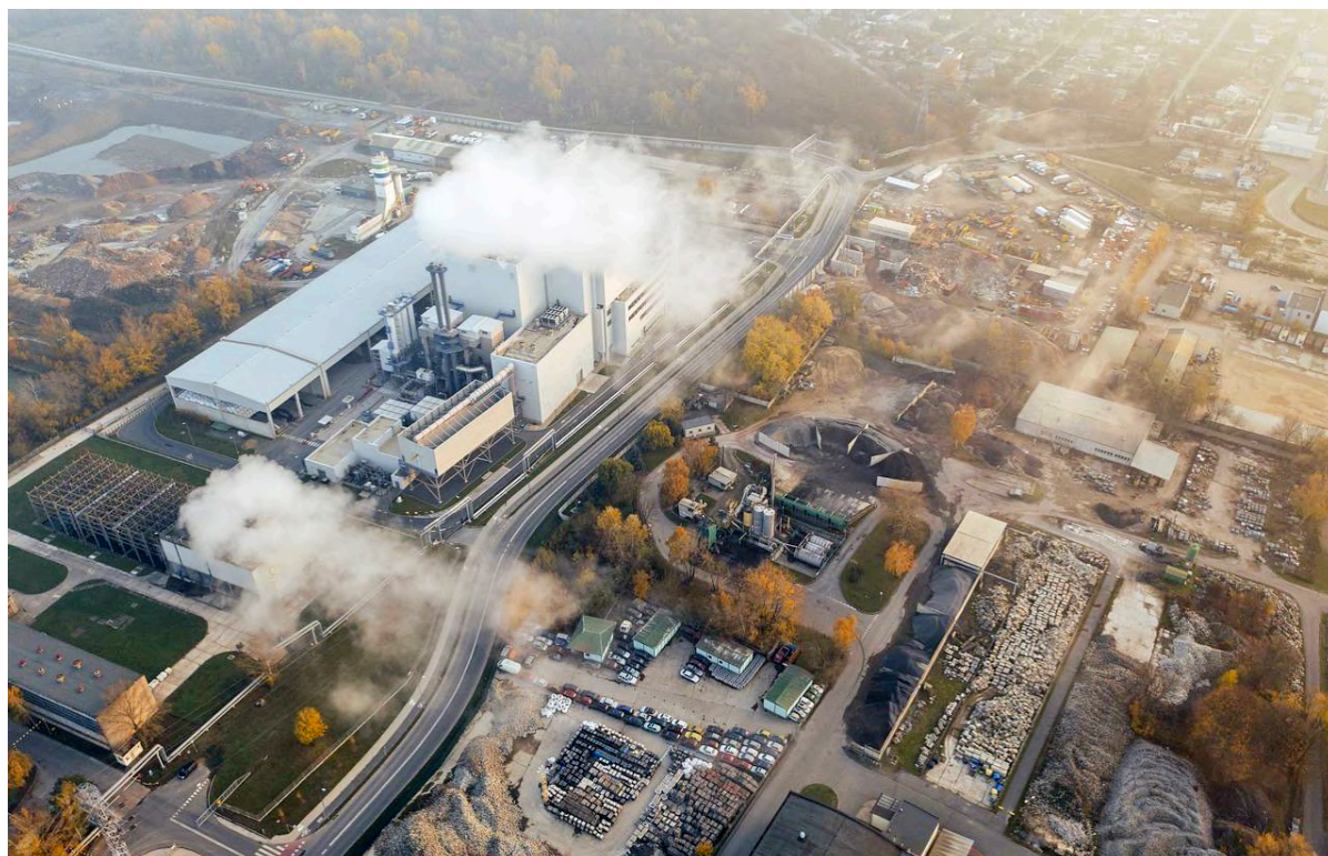
L'émission du CO2 d'un centre de données.

Cet outil offre plusieurs avantages qui façonnent notre manière de travailler comme la rapidité et l'efficacité. Une machine qui peut répondre à n'importe quelle question possible, c'est surtout une technologie révolutionnaire.