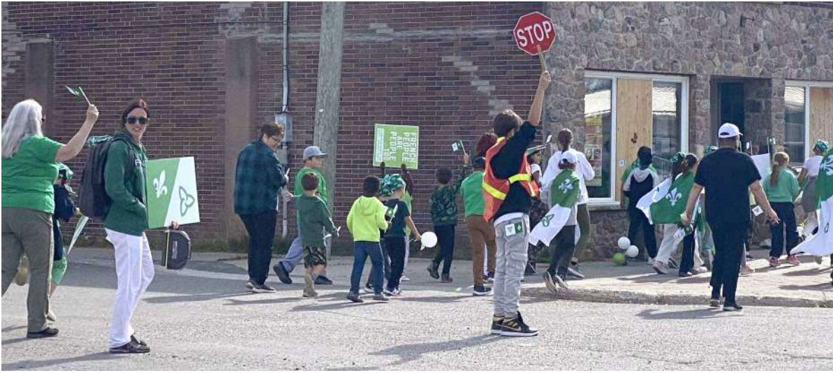
Marche sur la rue Main à Geraldton.