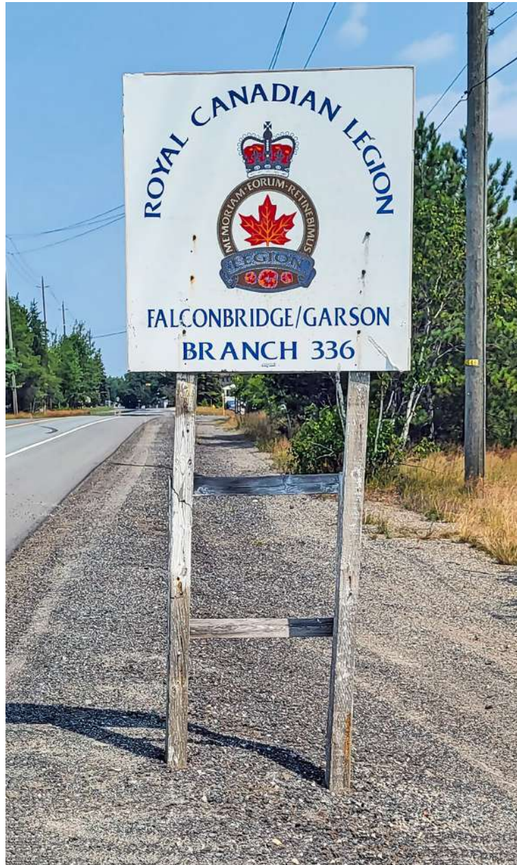
Affiche de la succursale 336 de la Légion royale canadienne.