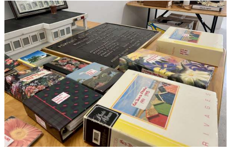
Des artefacts mi'kmaq aux albums souvenirs, on trouve un peu de tout sur le passé de Pomquet, au Centre historique.