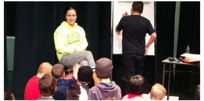
Chaque atelier a lieu dans une salle de classe et est diffusé virtuellement aux autres salles de classe dans la province au même moment.

Dans ce contexte, cette nouvelle réglementation provinciale marque un tournant significatif dans la gestion des technologies au sein des établissements scolaires francophones de Colombie-Britannique, visant à créer un environnement d'apprentissage plus concentré et sécurisé pour tous les élèves.