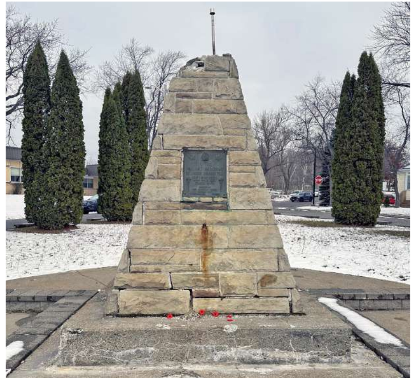
Cénotaphe de Falconbridge-Garson.