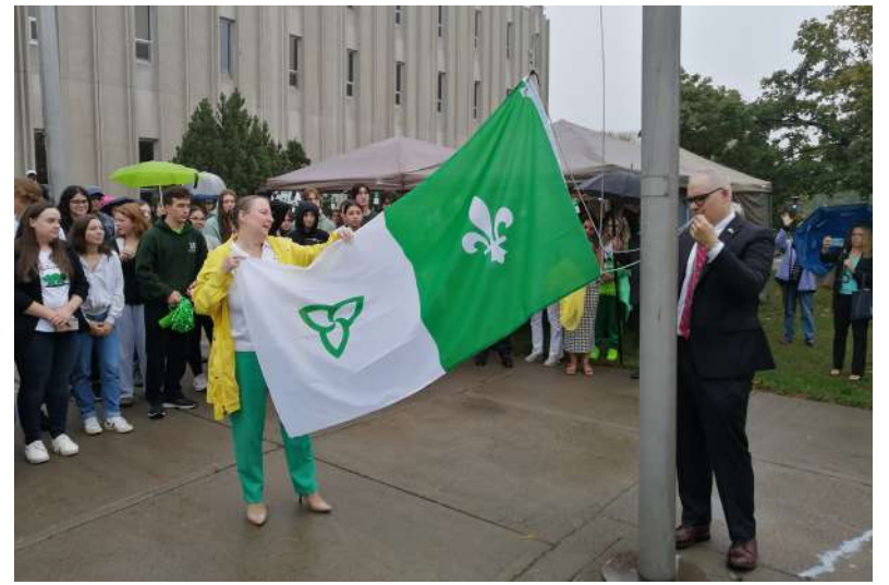
Le 49 e lever du drapeau, au pied du bâtiment de l'UdeS.

Il reste évident que ce programme requiert une structure, autrement dit des laboratoires et des équipements sophistiqués. Le recteur en semble conscient et dit avoir développé des partenariats stratégiques pour y avoir accès. En