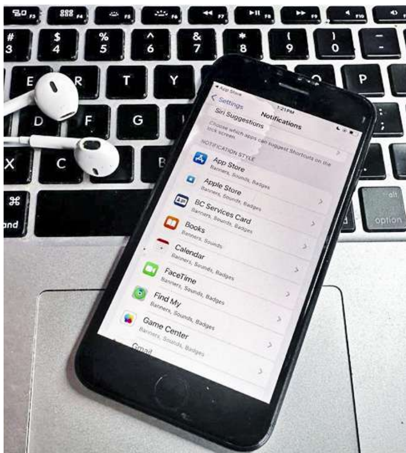
Période de repos obligatoire pour les téléphones portables et les appareils électroniques en classe en C.-B.

À noter que les enregistrements ne sont pas disponibles sur des services comme YouTube afin de respecter l'anonymat des élèves.