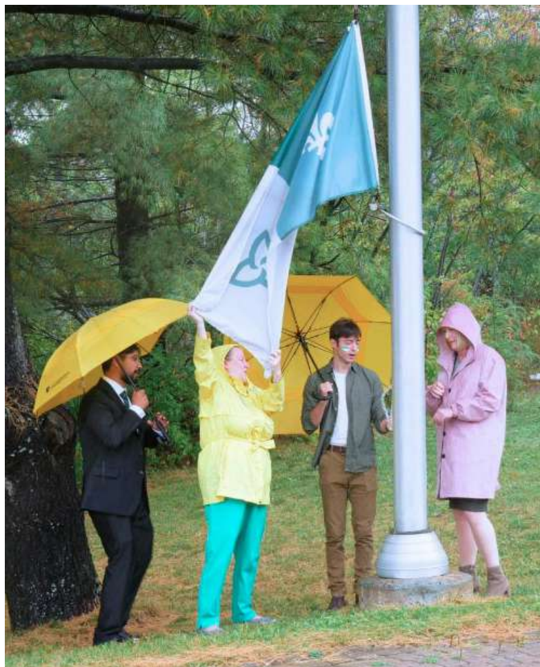
Université Laurentienne.

À l'Université Laurentienne, à Sudbury, l'Association des étudiants francophones (AEF) a organisé un événement grandiose pour le lever du drapeau franco-ontarien. C'était un moment de grande fierté.