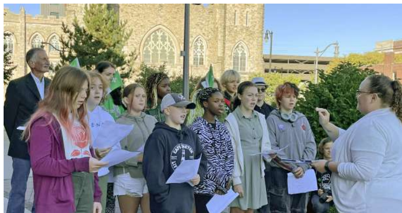
Thunder Bay la chorale