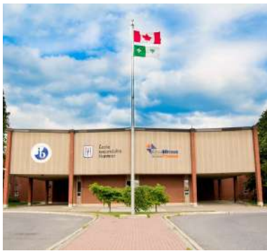
École secondaire Hanmer.

La Ligue de basketball mineur de Vallée Est (VEMBL) et le Five de Sudbury présenteront des camps d'évaluation pour différents groupes d'âge de joueurs dans la communauté en préparation pour la saison 2024-2025. Les sessions se dérouleront au gymnase de l'École secondaire Hanmer le lundi 7 octobre à 18 h 15 pour les enfants de 8 ans et moins, et à 19 h pour les jeunes de 10 ans et moins. Le mardi 8, mercredi 9 et jeudi 10 octobre à 18 h 30, les essais pour les circuits de 12 ans, 14 ans et 18 ans et moins se tiendront au même endroit. Pour d'autres renseignements, consultez le www.vembl.ca . La VEMBL est membre de l'Association de basketball de l'Ontario (OBA), un organisme provincial qui coordonne le développement du sport partout dans la province. (É.B.)