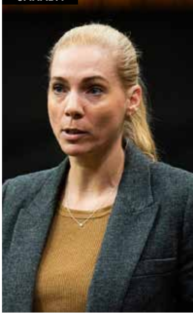
La ministre du Patrimoine canadien, Pascale St-Onge.