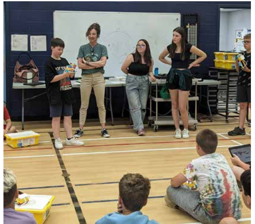
Un élève a le privilège de présenter l'invention qu'il a conçue pendant l'activité de technologie.