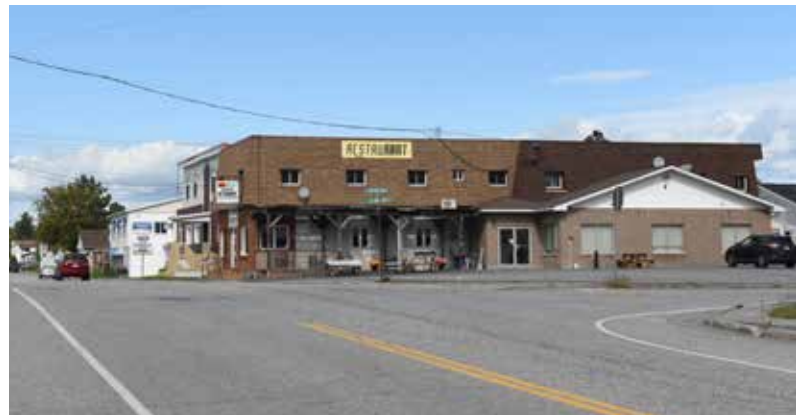
Le centre-ville.

Que ce soit des établissements de la rue St-David au centre-ville, dont l'épicerie, la