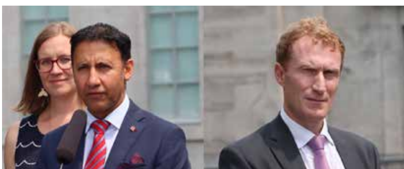
Arif Virani et Marc Miller, respectivement ministre de la Justice et ministre de l'Immigration, ont aussi des responsabilités en vertu de la Loi sur les langues officielles.

For further information, please contact the consultant's office by email at 31862-CSCDGR@jrichards.ca