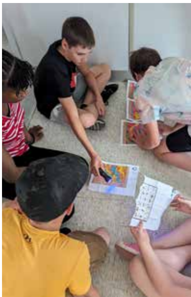
Les élèves apprennent de nouvelles techniques en peinture lors de l'atelier d'arts.