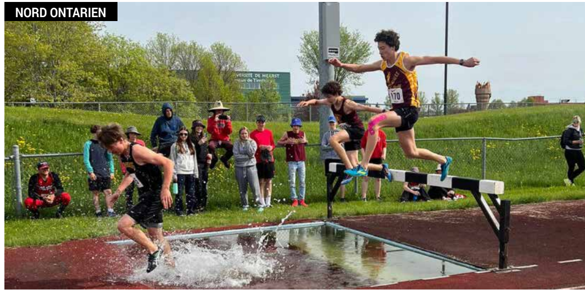
Une course à obstacles lors des compétitions de l'AANEO en 2022.