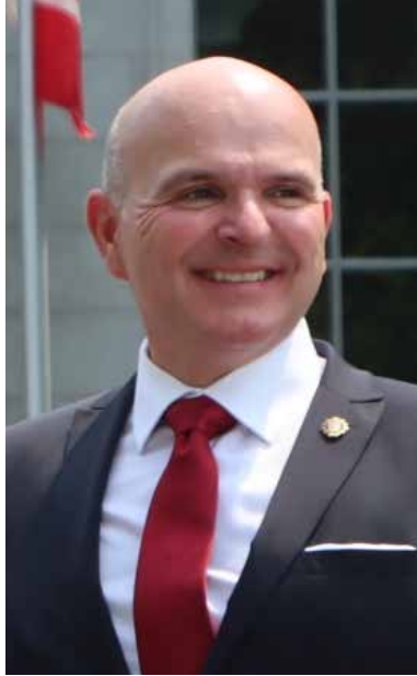
Le ministre des Langues officielles, Randy Boissonnault.