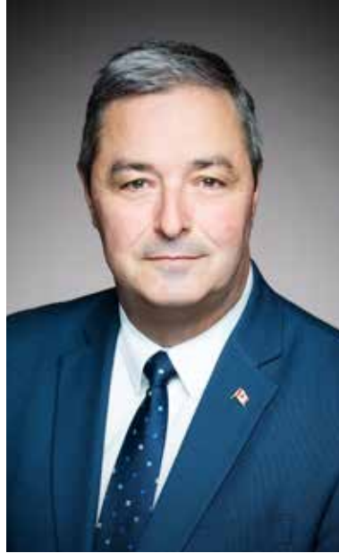
Le député conservateur Joël Godin.