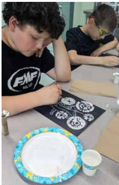
Les élèves apprennent de nouvelles techniques en peinture lors de l'atelier d'arts.