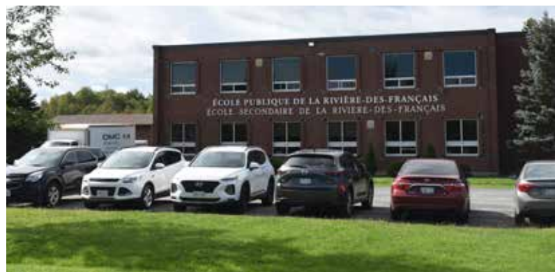
L'École secondaire de la Rivière des Français.

station d'essence et l'église, des métiers comme l'agriculture et la production de sirop d'érable, ou bien des personnes facilement reconnaissables dans le village, la chanson est en quelque sorte une représentation de la vie quotidienne des résidents et des expériences vécues par les touristes.