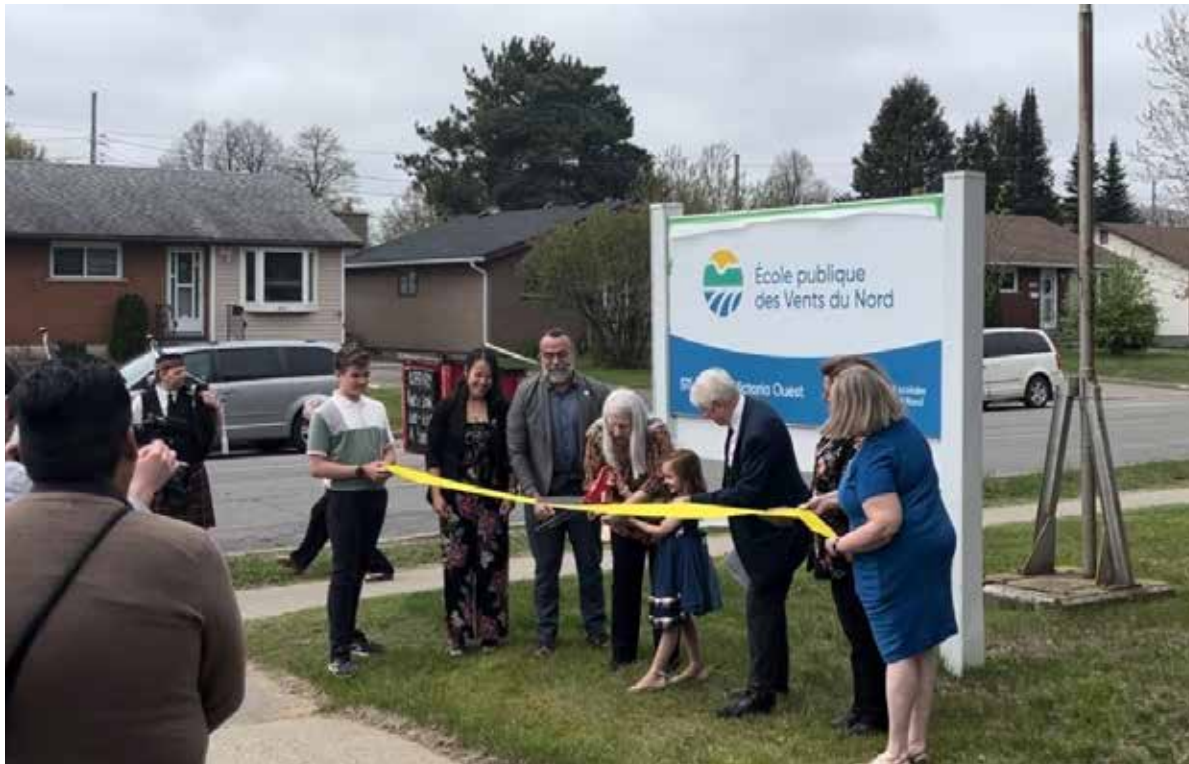
Le dévoilement de la pancarte devant l'École publique des Vents du Nord.

de la direction s'est penché sur la question d'une nouvelle désignation plus convenable.