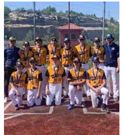
Les Alouettes de Notre-Dame