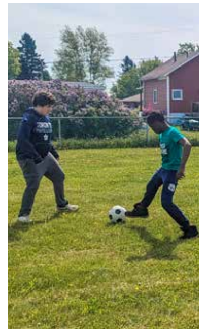
Sur le terrain de soccer, le match est à la fois compétitif et amical.