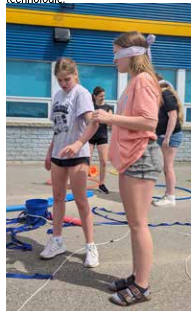
Une élève travaille sa communication pour guider son amie qui doit traverser le parcours sans toucher les objets au sol.