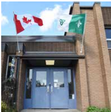
L'entrée de l'École publique des Vents du Nord à l'automne 2023.

Pendant plusieurs mois, un comité de jeunes, de parents et