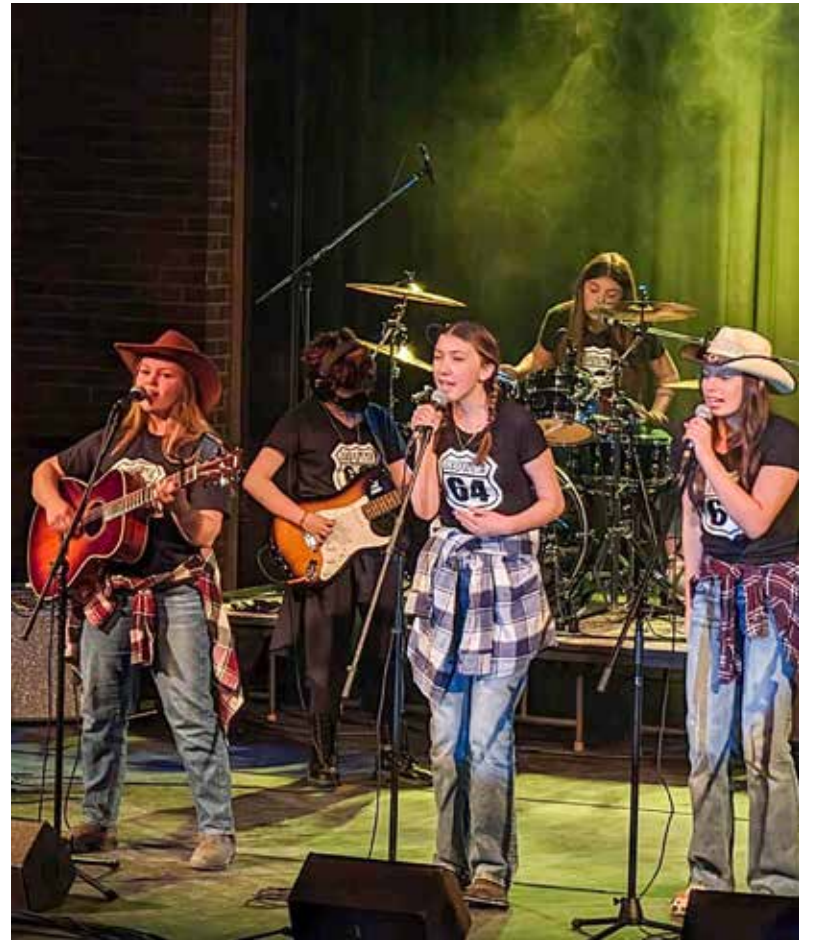
Le groupe Route 64.

«On avait commencé la première session, on avait écrit quelques paroles et on avait fait