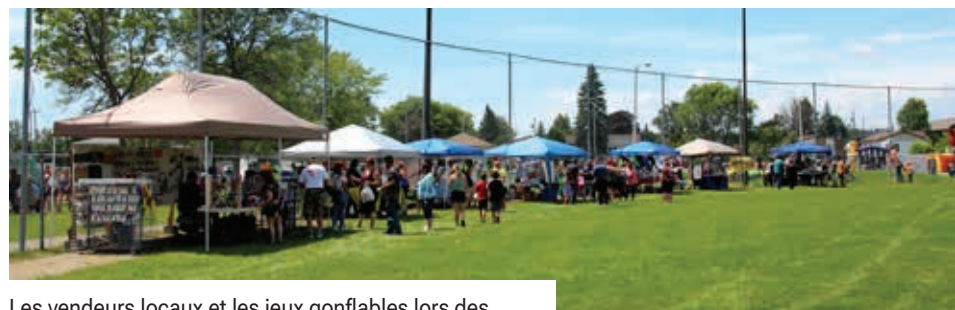
Les vendeurs locaux et les jeux gonflables lors des Journées Rayside-Balfour de 2022.

Tous les détails sont disponibles sur le site https://www.cafeheritage.ca/rayside-balfour-days-2023/ .