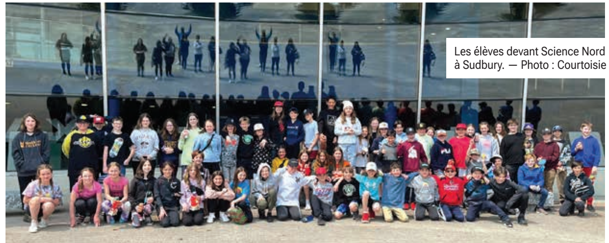
Les élèves devant Science Nord à Sudbury.

Les élèves de la 6 e année de l'École catholique Anicet-Morin de Timmins ont passé une journée dans la grande ville de Sudbury. Ils ont participé à une journée remplie d'ateliers à Science Nord et ont bien terminé le voyage en s'amusant chez Urban Air.