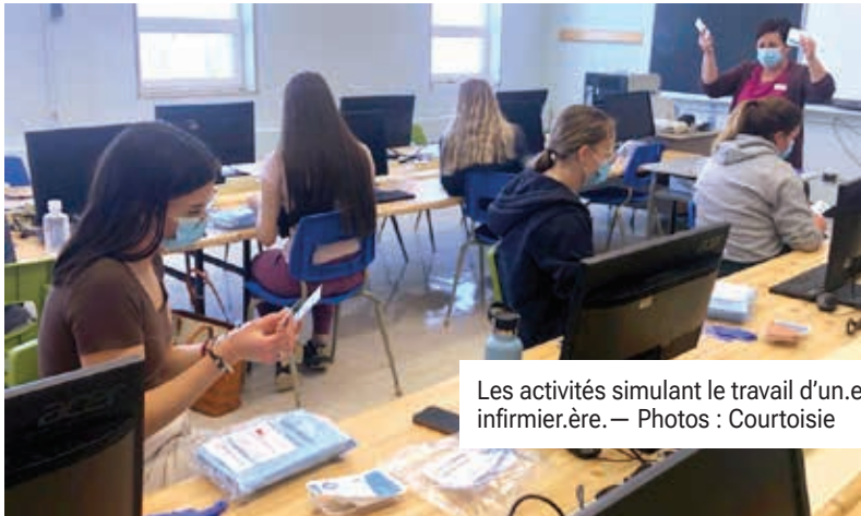
Les activités simulant le travail d'un.e infirmier.ère.