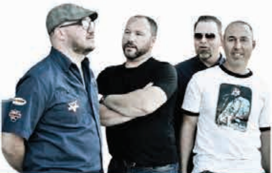
STILLWELL GROUPE MUSICAL

SOIRÉE VINS-FROMAGES ET SPECTACLE DU GROUPE 'STILLWELL'