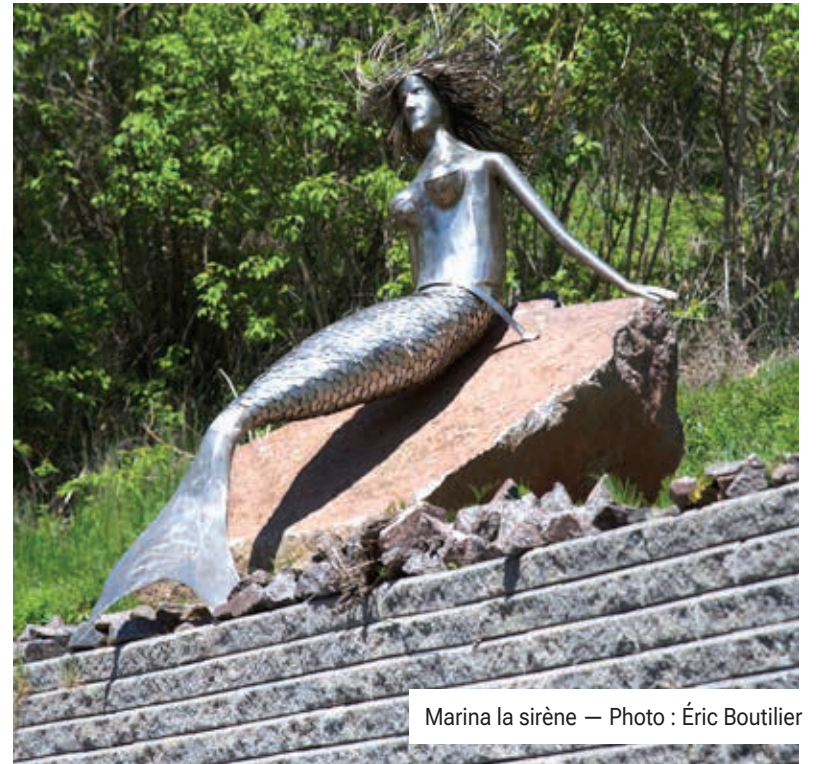
Marina la sirène

La Caisse Alliance contribue à bâtir un avenir fort et en santé pour les communautés du Nord de l'Ontario. Elle investit concrètement dans des actions et des outils afin de pouvoir continuer d'innover et d'accroître son autonomie financière.