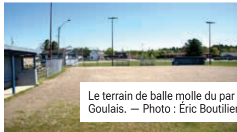
Le terrain de balle molle du parc Goulard.

Les pompiers bénévoles de la caserne #1 de Nipissing Ouest organisent un tournoi de balle molle. La compétition aura lieu au parc Goulard de Sturgeon Falls la fin de semaine du 14 au 16 juillet. Des rafraîchissements, des collations et un repas de poisson seront disponibles pendant l'événement. Les équipes devront avoir au moins deux femmes dans leur alignement. Les joueurs auront droit à trois lancers par apparition au bâton. Les inscriptions seront acceptées par courriel à fireassociation1@gmail.com jusqu'au vendredi 2 juin. Les profits générés par le tournoi seront au profit de l'Association des pompiers bénévoles de la caserne #1. (É.B.)