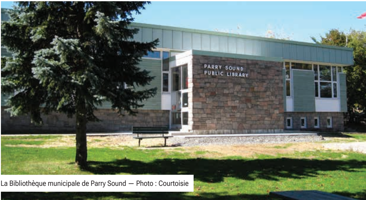
La Bibliothèque municipale de Parry Sound

La Bibliothèque de Parry Sound possède déjà environ 300 livres en français. Elle dessert également les collectivités de Carling, McDougall et The Archipelago.