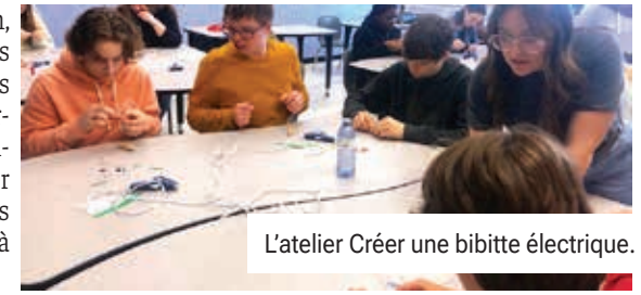
L'atelier Créer une bibitte électrique.