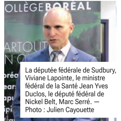
La députée fédérale de Sudbury, Viviane Lapointe, le ministre fédéral de la Santé Jean Yves Duclos, le député fédéral de Nickel Belt, Marc Serré.