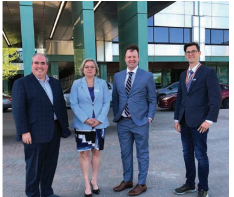
Le commissaire aux services en français de l'Ontario, Carl Bouchard, a visité l'Université Laurentienne, l'Université de Sudbury et Horizon santé nord.