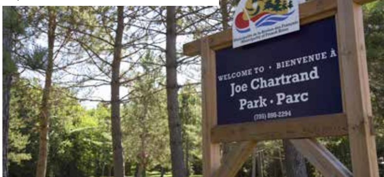
Le parc Joe Chartrand

Des activités en lien avec les Familles métisses du Nipissing et un prélèvement de fonds pour améliorer le parc Joe Chartrand seront présentés à Noëlville au cours des deux prochaines fins de semaine. Le Rendez-vous métis, une journée de musique, d'ateliers et d'expositions, aura lieu dans le parc le samedi 20 août de 13 h à 19 h. L'évènement Helping Hands, des spectacles de musique et de magie, se déroulera le 27 août de 14 h à 22 h. Il y aura également des marchands et des structures gonflables pour enfants durant les deux journées. (É.B.)