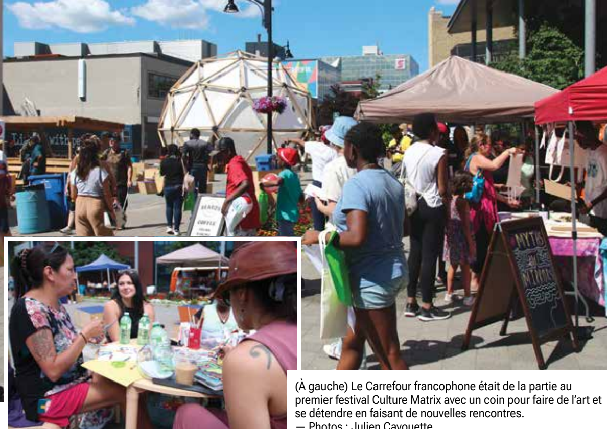
(À gauche) Le Carrefour francophone était de la partie au premier festival Culture Matrix avec un coin pour faire de l'art et se détendre en faisant de nouvelles rencontres.

La petite foule diversifiée avait accès à un kiosque de Myths and mirrors et Réseau Access Sudbury en plus de quelques vendeurs locaux sur la rue Durham samedi après-midi. Le festival Up Here a offert un appui logistique et une partie de leur équipement pour le nouveau festival.