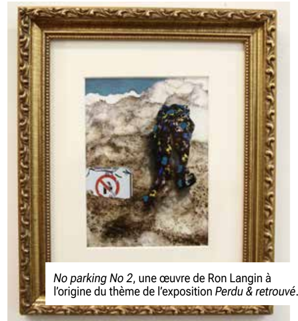
No parking No 2 , une œuvre de Ron Langin à l'origine du thème de l'exposition Perdu & retrouvé .