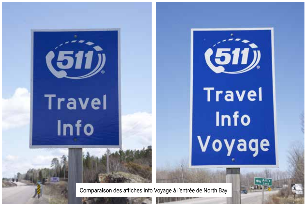
Comparaison des affiches Info Voyage à l'entrée de North Bay