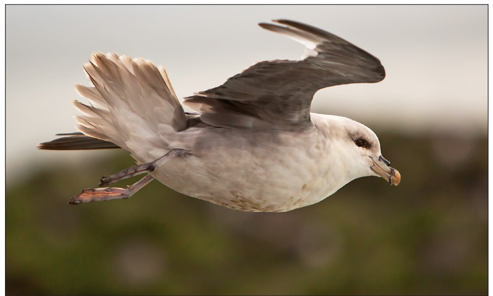
Le fulmar boréal est une espèce d'oiseau marine que vous pouvez apercevoir à Terre-Neuve-et-Labrador entre avril et juin, au moment de la saison de nidification.

Passionnées de nature et de sciences environnementales, les organisatrices du Feminist Bird Club YYT souhaitent offrir un espace accueillant pour les membres des commu-