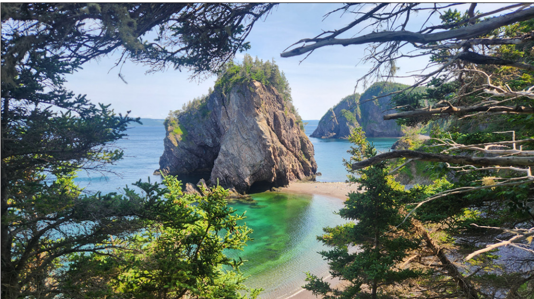
Cette plage se trouve où? Tentez votre chance!