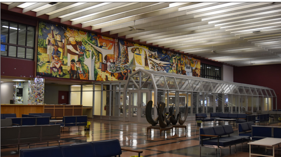
Indice: À cet endroit, ils accueillent en grand de la grosse visite surprise.