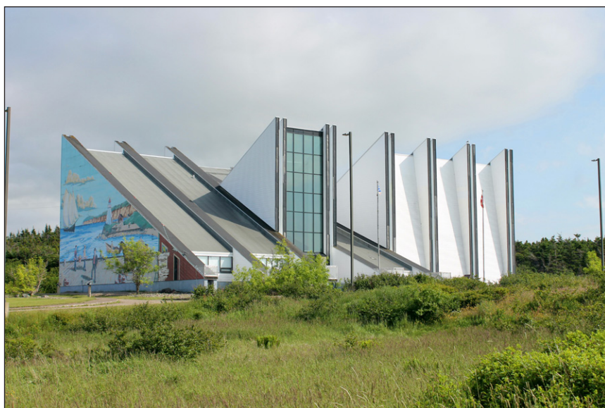
Indice: L'architecture distincte de ce musée est d'origine internationale: se sont les vestiges du pavillon de l'ex-Yougoslavie de l'Expo 67, acquis par l'ancien premier ministre terre-neuvien Joseph Smallwood.