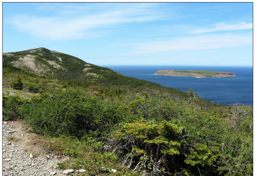
Indice: La Grand'Terre doit son nom aux colons français qui se sont installés sur cette île.