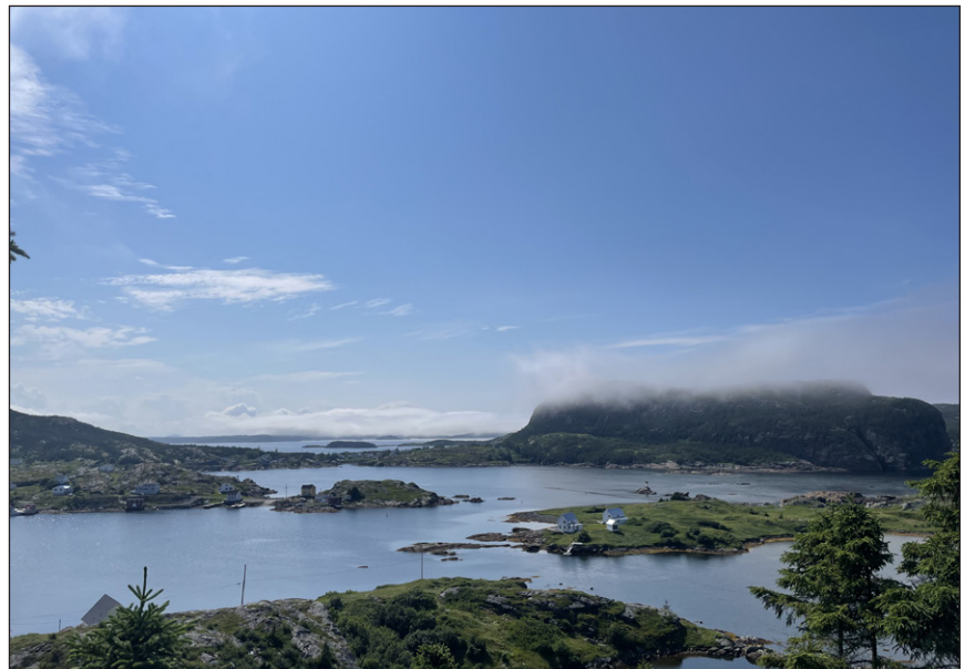
Indice: Toujours pas à Cuba, pour vous rendre à ce village de pêcheurs, il faut suivre la rue vers les plages.