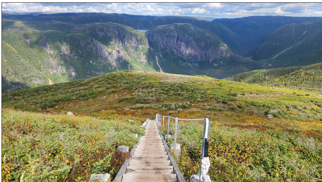
Indice: Le camping, des festivals artistiques et littéraires, la randonnée et des fjords vous attendent ici.