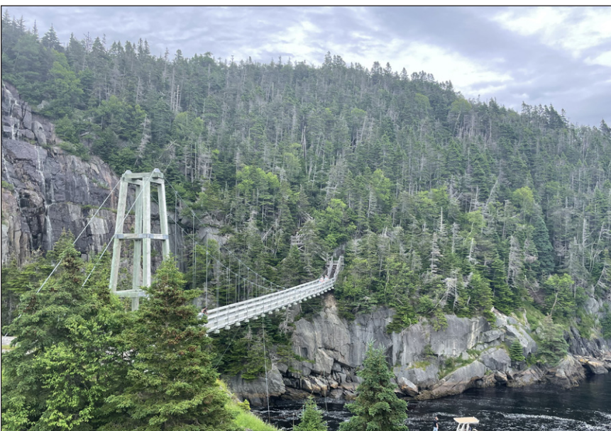
Indice: Un village réinstallé transformé en sentier de randonnée du East Coast Trail.