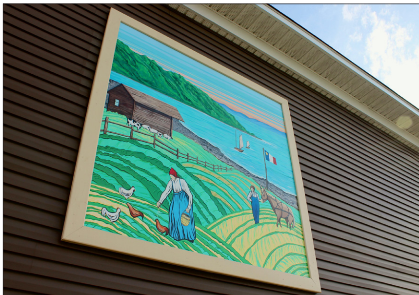
Indice: Rendez-vous à l'ancien Acadian Village pour découvrir cette murale.