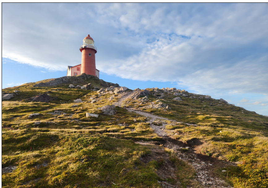
Indice: Commandez un pique-nique et déjeuner avec vos amis au bord de mer, tout le long de l'été!