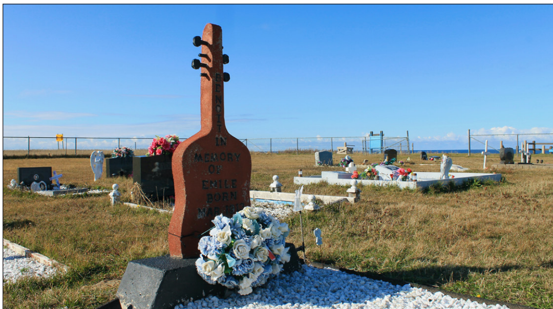
Indice: Pèlerinage incontournable pour les amateurs de la musique terre-neuvienne: la pierre tombale de ce célèbre musicien franco-terre-neuvien prend la forme de l'instrument emblématique de sa carrière.