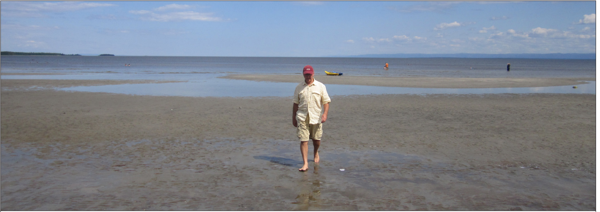
Indice: Ce n'est pas à Cuba, mais le festival des plages pourrait accueillir davantage de membres du personnel militaire suite à une récente annonce de financement.